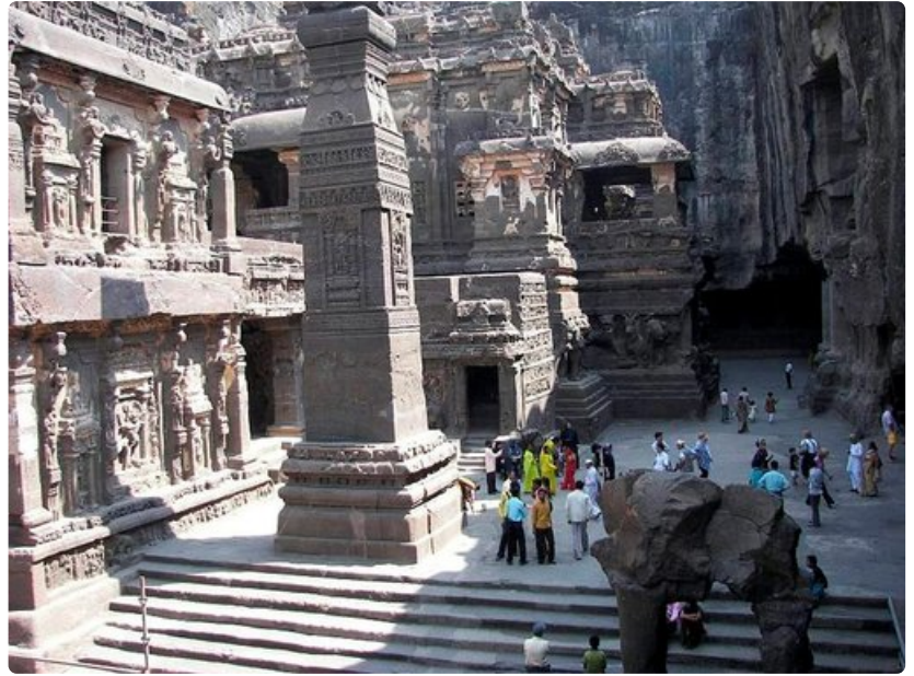
Elloran loppumattomat luolat on kaiverrettu tuliperäiseen kallioon.

Kolmannen päivän ohjelmaan kuuluu venematka Sindhuburgin linnoituksen temppeliin. Lisäksi vierailimme käsityökylässä. Taj Mahal -kokkien valmistaman lounaan nautimme rantalomakylässä, jonka jälkeen matkaamme bussilla Laxmi Narayanan vanhaan temppeliin.