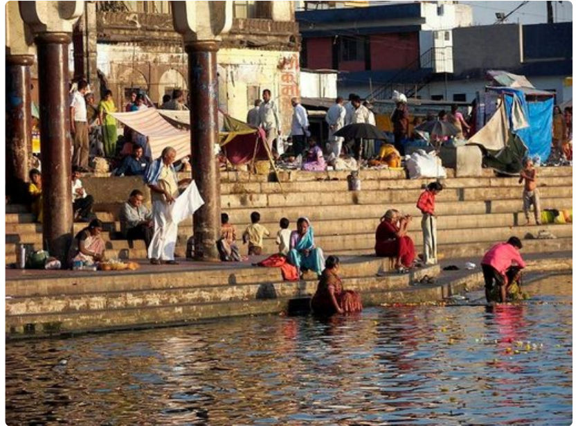
Pyhä Godavari-joki Nasikissa on täynnä elämää.