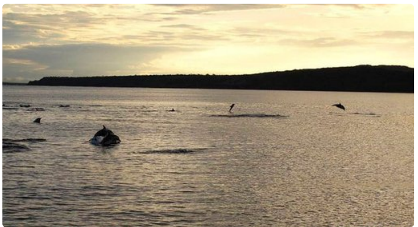
Delfiinit seuraavat alusta matkalla Plazasin saarella.