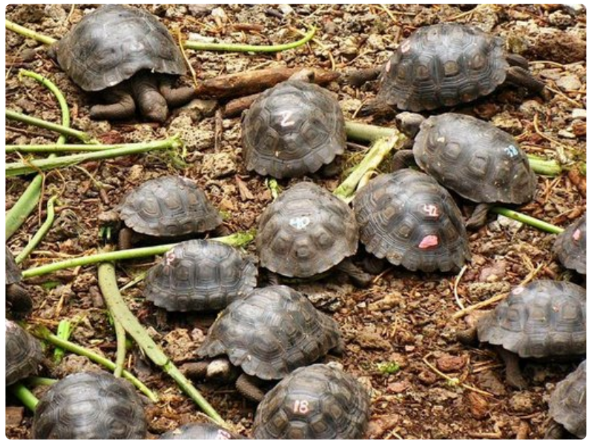
Jokainen hautomossa syntyvä kilpikonna saa tunnistenumeron.