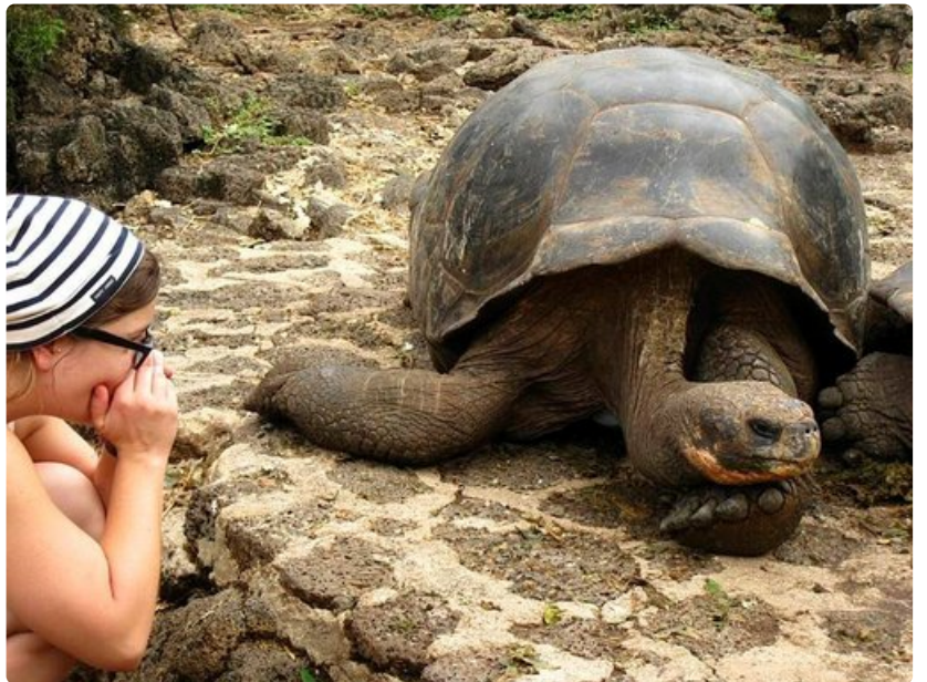
Jättiläiskilpikonna ei jaksa jutustella suomeksi.