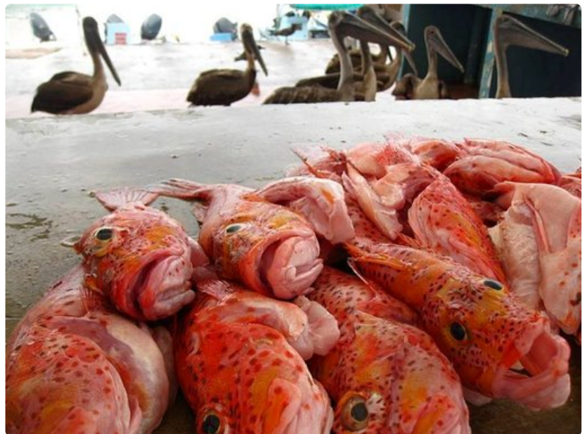
Kalaa tahtoivat syödä muutkin kuin matkailijat.