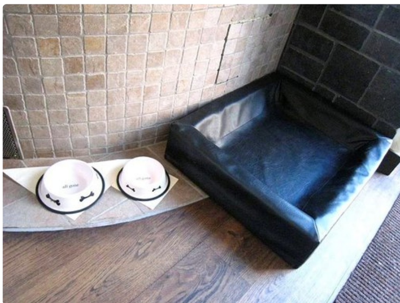
Keskiaikahotellissa koiriakin hemmotellaan.