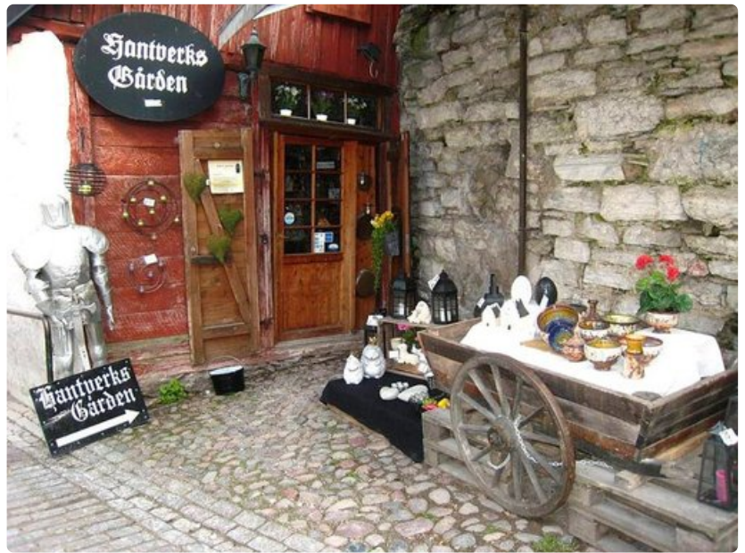
Visbyn Vanhassakaupungissa on viehättäviä pieniä käsityöliikkeitä.

Kolea, mutta aurinkoinen aamu aukeaa vanhan hansakaupungin Visbyn kaduilla. Ruotsin aurinkoisin kaupunki on alkukesästä parhaimmillaan, kun luonto alkaa näyttää vehreyttään ja kukat ovat vasta puhkeamassa. Keväällä tai alkusyksyllä koetusta seesteisestä rauhasta voi vain haaveilla kiireisimpinä kesäkuukausina.