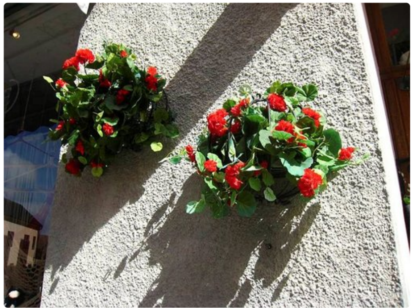
Visby on kukkasten kaupunki.