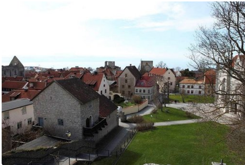
Visbyssä on paljon historiaa.

- Ravintola 50 Kvadrat, S:t Hansplan. Ruotsalaista keittiötä, vaikutteita koko maailmasta. Historiallisessa talossa hämyisiä satojen viinimerkkien viinikellari. Palkittu ruokaravintola perustaa menunsa lähiruokaan. Avoinna 1.4.-15.9. Muina aikoina ryhmille.