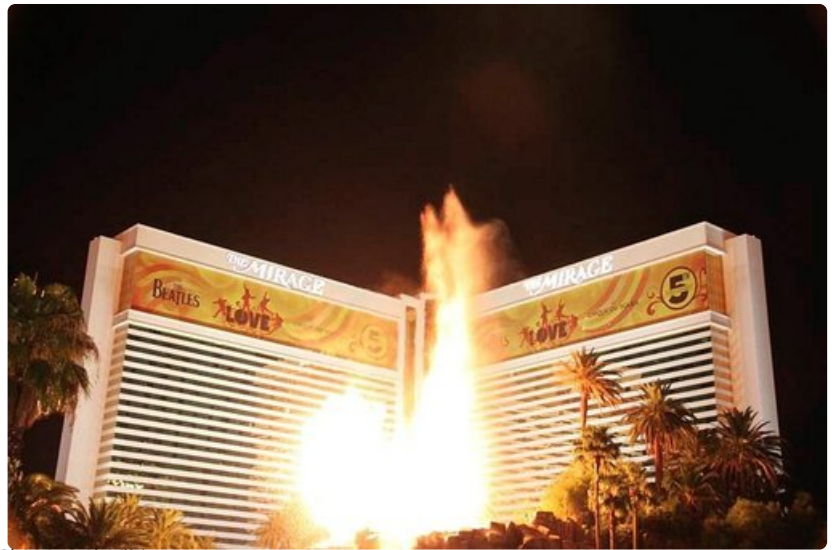
The Mirage –kasino tarjoaa Las Vegasin komeimman valoshown joka ilta kello 23.