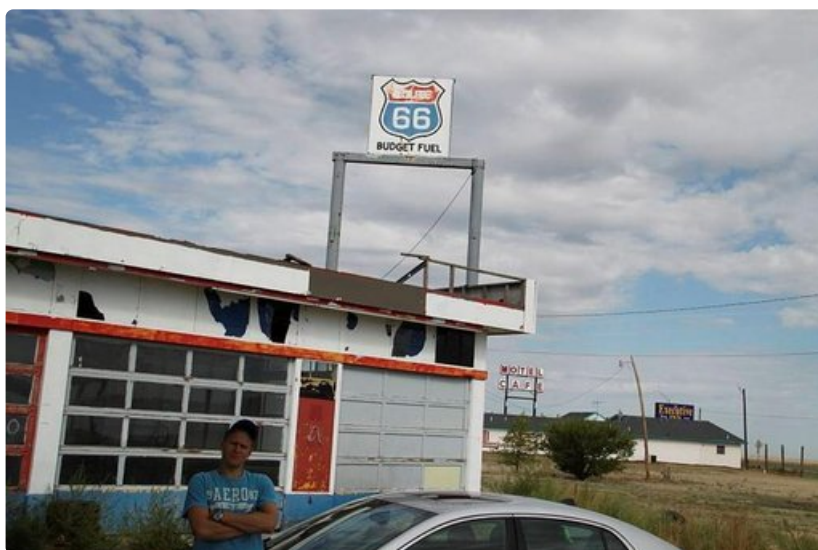
Ainakin bensa on halpaa hylätyillä asemilla.