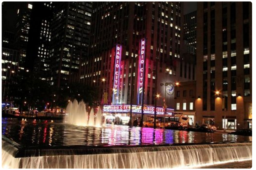
Radio Cityn katolta tarjoutuu yksi parhaimpia yöllisiä näköaloja New Yorkiin, aulan näkymät eivät ole yhtään huonommat.