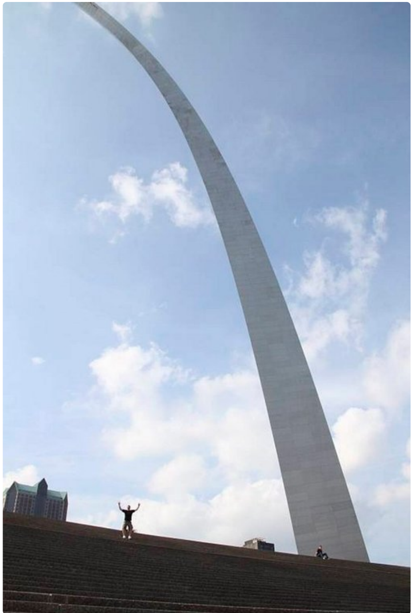
Suomalaisen suunnittelun rinnalla untee itsensä pieneksi.