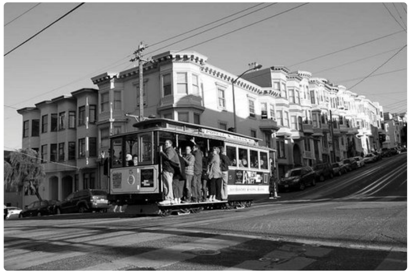
San Franciscon raitiovaunut ovat enemmän matkailijoiden kuin paikallisten asukkaiden käytössä.