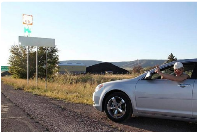
Legendaarinen Route 66 vielä edessäpäin.

Yhdysvalloissa on helppo ajaa, sillä kyltit ja tienviitat on merkitty hyvin. Ajamisen helppoudesta kertoo se, että eräässä vaiheessa GPS:imme opasti: aja tätä tietä 1006 mailia ja käänny sitten loivasti vasempaan.