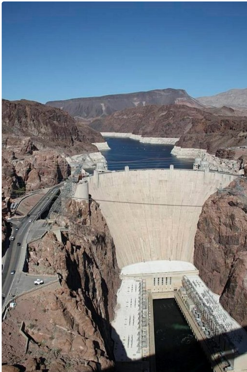
Hooverin pato on vakuuttava osoitus insinööritaidosta.

o Majoittuminen on kallista, kesällä teltttailemalla voi säästää ison summan. o Poliisit ovat erittäin tarkkoja. Kansainvälinen ajokortti mukaan ja nopeusrajoituksia kannattaa noudattaa pilkun tarkasti.