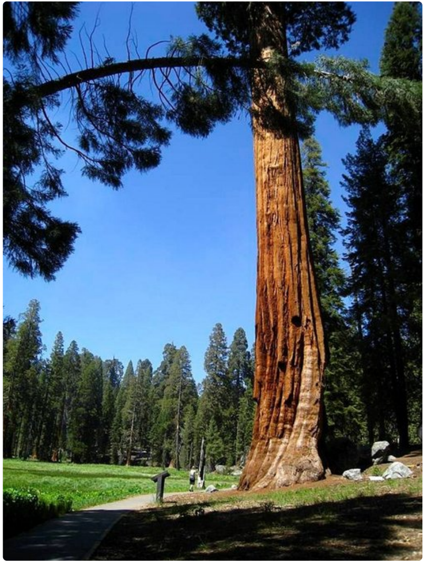
Tavalliset havupuut kalpenevat mammuttipetäjien rinnalla.