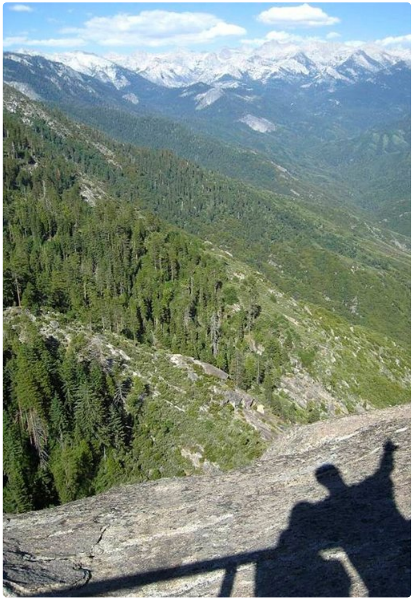
Sierra Nevadan vuoriston korkein huippu kohoaa yli 4000 metriin.

Päivä huipentuu komeisiin metsämaisemiin Kings Canyonilla, ja kuin pisteenä i:n päälle pääsemme yllättäen nauttimaan myös elämämme pisimmästä alamäestä laskeutuessamme puistosta takaisin kohti rannikkoa. Alhaalla meitä tervehtivät paahteiset viiniviljelmät, ja auringon laskiessa horisonttiin vilkutamme taustapeleistä hyvästiksi