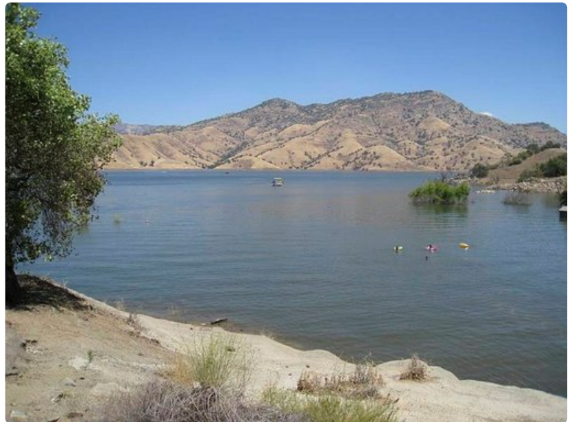
Lake Kaweah -järvi juuri ennen Sequoian sisäänkäyntiä on suosittu lomakohde.