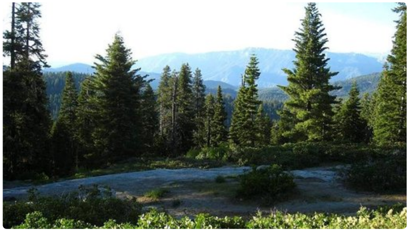
Kansallispuistot ovat rauhallinen keidas keskellä kiireistä Kaliforniaa.