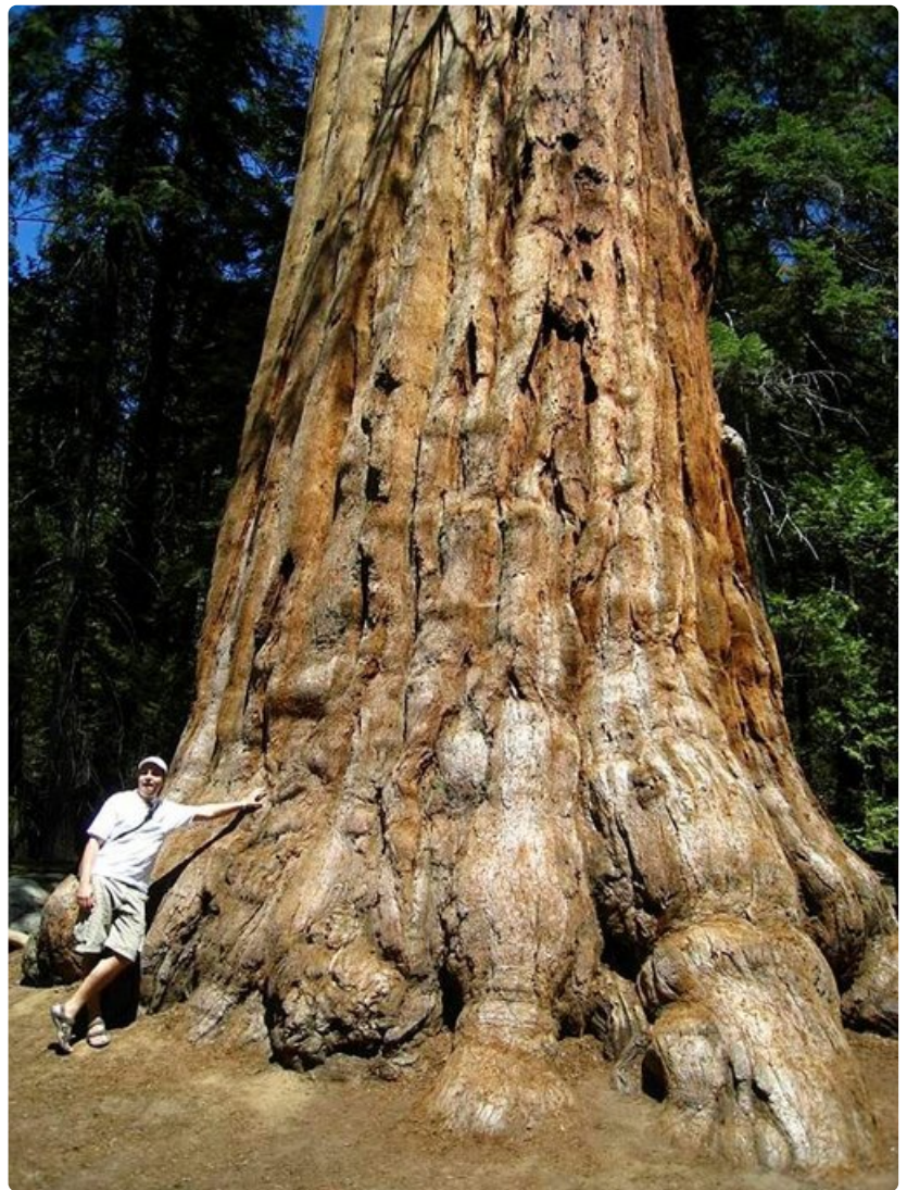
Suurimmat mammuttipetäjistä ovat halkaisijaltaan yli 7 metriä.

Varoitukset: Sequoian kansallispuisto on pääosin erämaata, joten vierailijan on hyvä tutustua etukäteen mahdollisiin turvallisuus- ja säävaroituksiin.