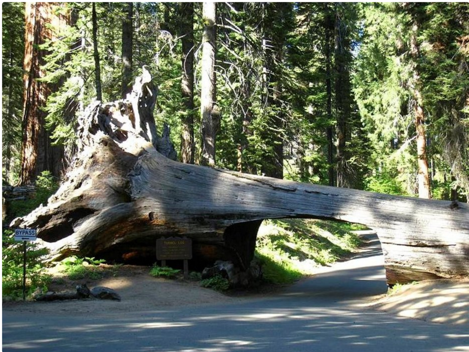
Tunnel Log, luova ratkaisu autotielle kaatuneen puun aiheuttamaan ongelmaan.