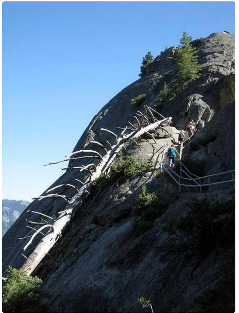
Reippailuhenkiset nauttivat kiipeämisestä Moro Rockin huipulle.