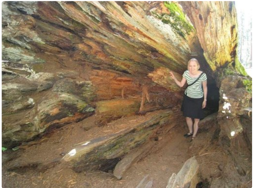
Vuosien saatossa kaatuneet mammuttipetäjät muodostavat mielenkiintoisia yksityiskohtia puistoon.