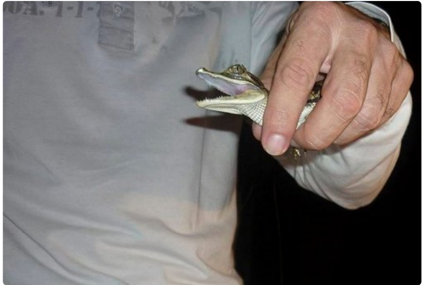
Opas esittelee kaimaanin poikasta.