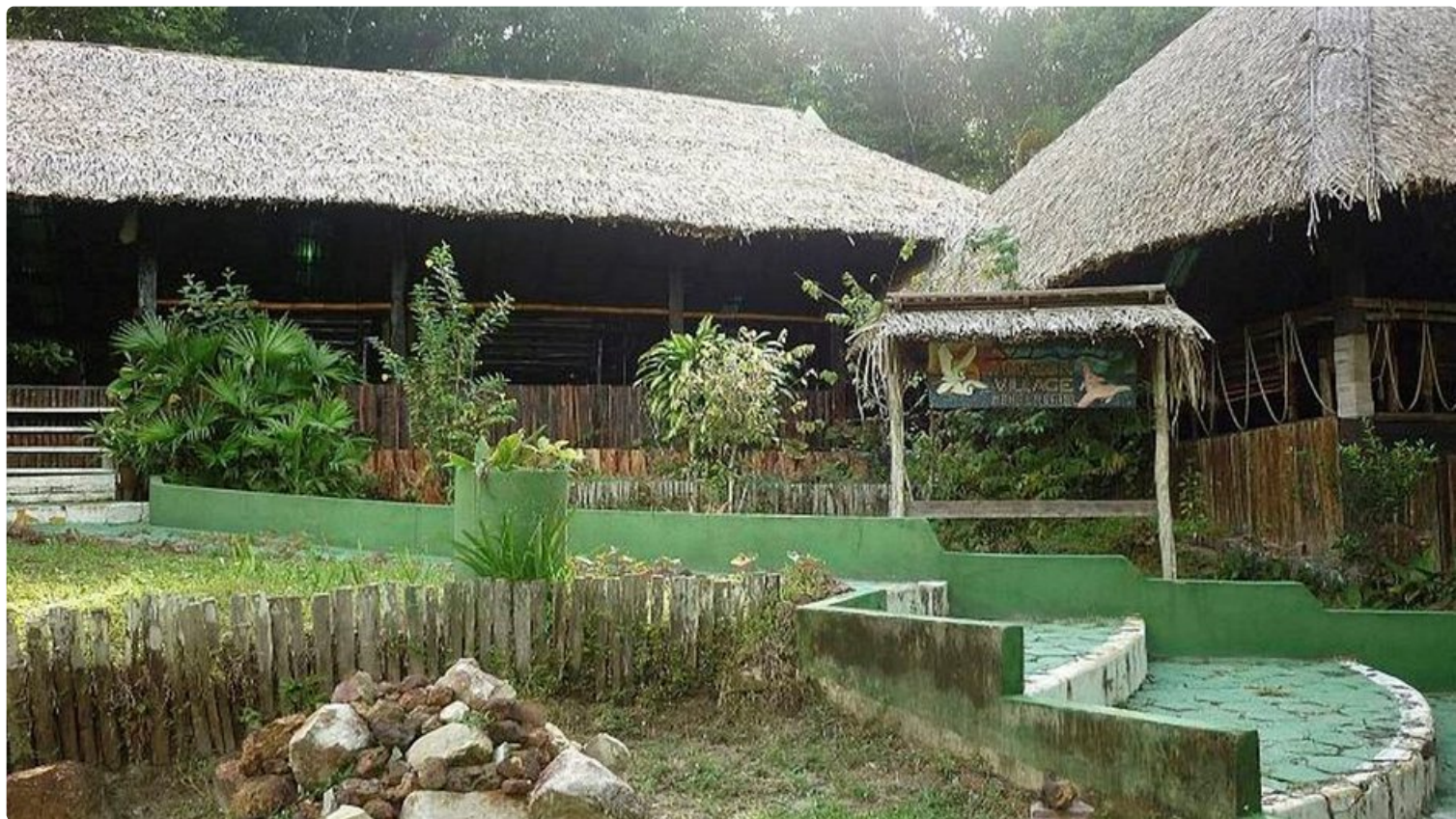
Majapaikkamme vastaanotto ja ruokasali.