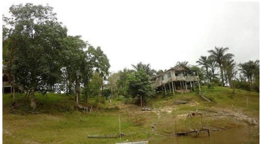
Paikallisten asukkaiden rakentama asumus kyhjäyttää joen rannassa.