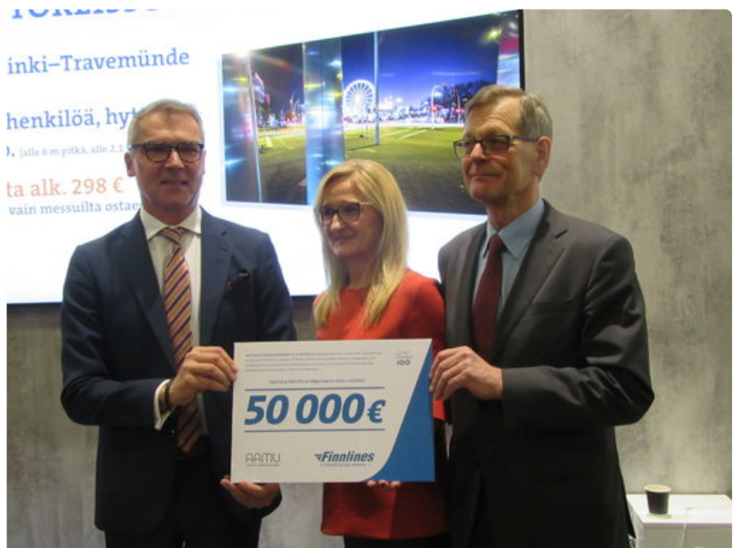
Finnlines lahjoitti 50 000 euroa Suomen Lasten Syöpäsäätiölle.