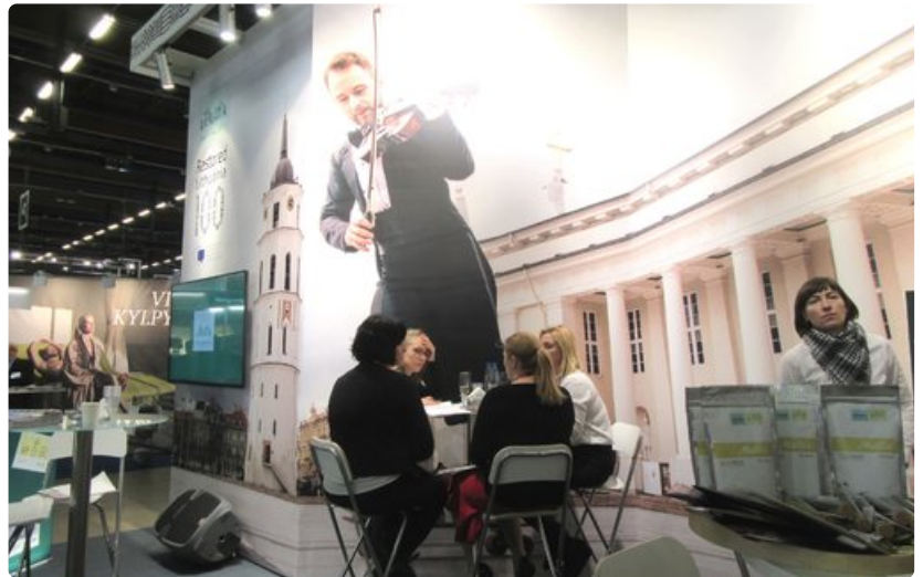
Liettua tarjoaa messuilla kulttuurimatkoja.