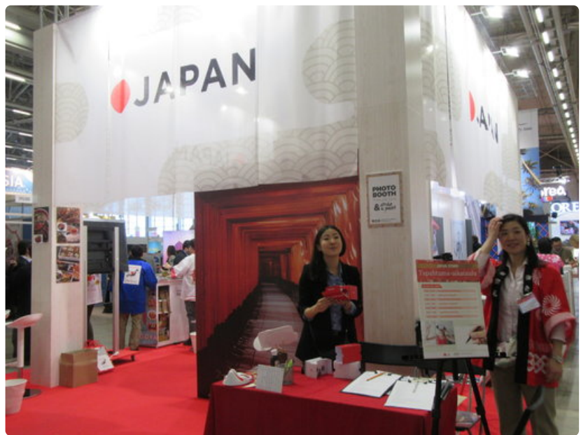
Japani tarjoaa 3G-elämyksiä.