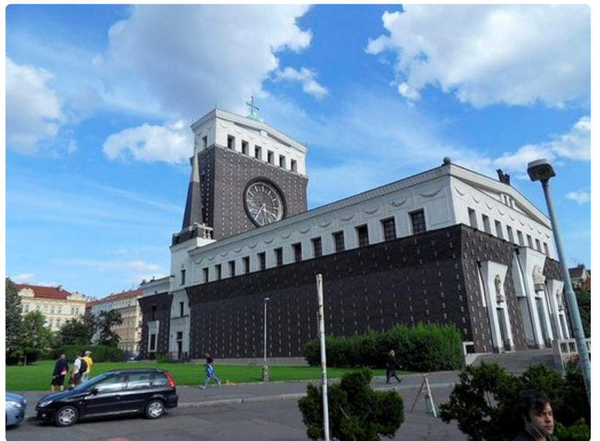
Moderni Herran siunatun sydämen kirkko on Jirího z Podebradin -aukion maamerkki.