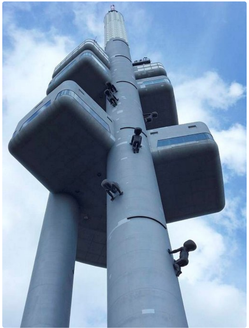
Cernýn vauvat kiipeilevät tv-tornissa.

Miten pääsee: Muun muassa Finnair, Czech Airlines ja Norwegian lentävät Helsingistä Prahaan.