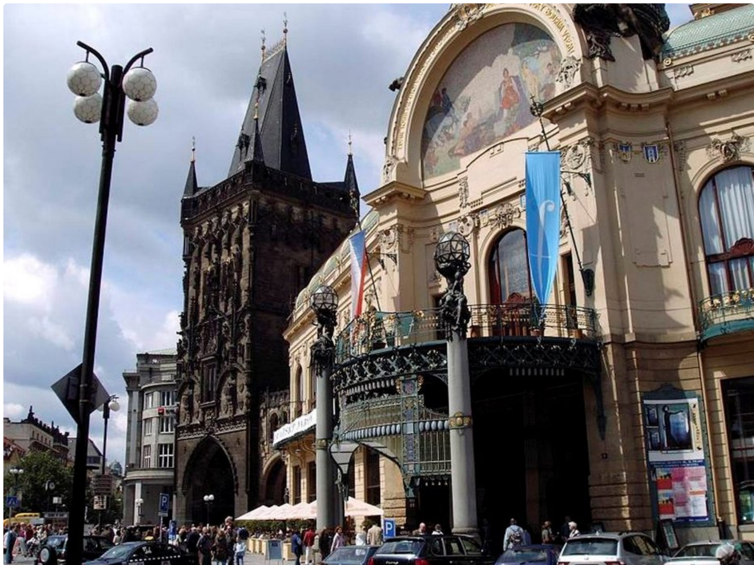
Gotiikkaa ja jugendia rinnakkain Náměstí Republikyillä.