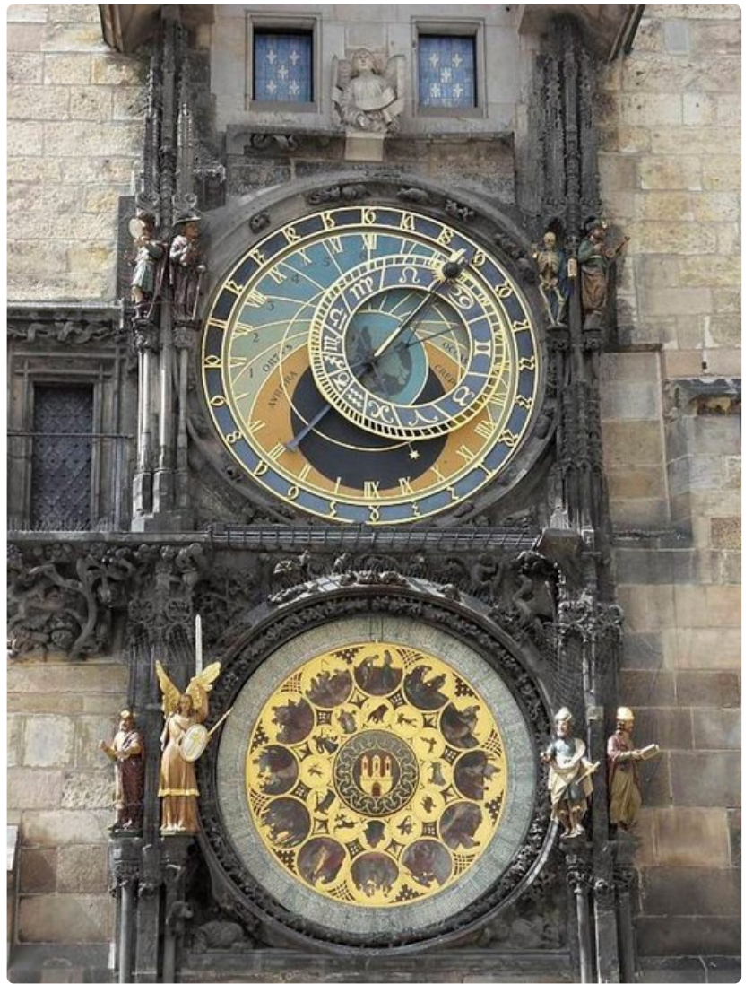
Vanhankaupungin raatihuoneen astronominen kello on vuodelta 1410.