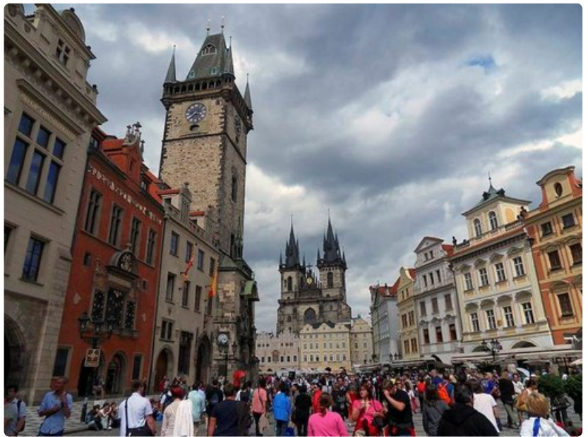
Vanhankaupungin aukio houkuttelee kauneudellaan.