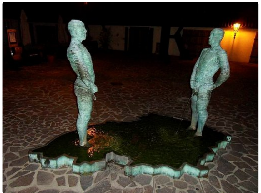
Cernýn tulkinassa Tšekkiin virtsataan idästä ja lännestä.