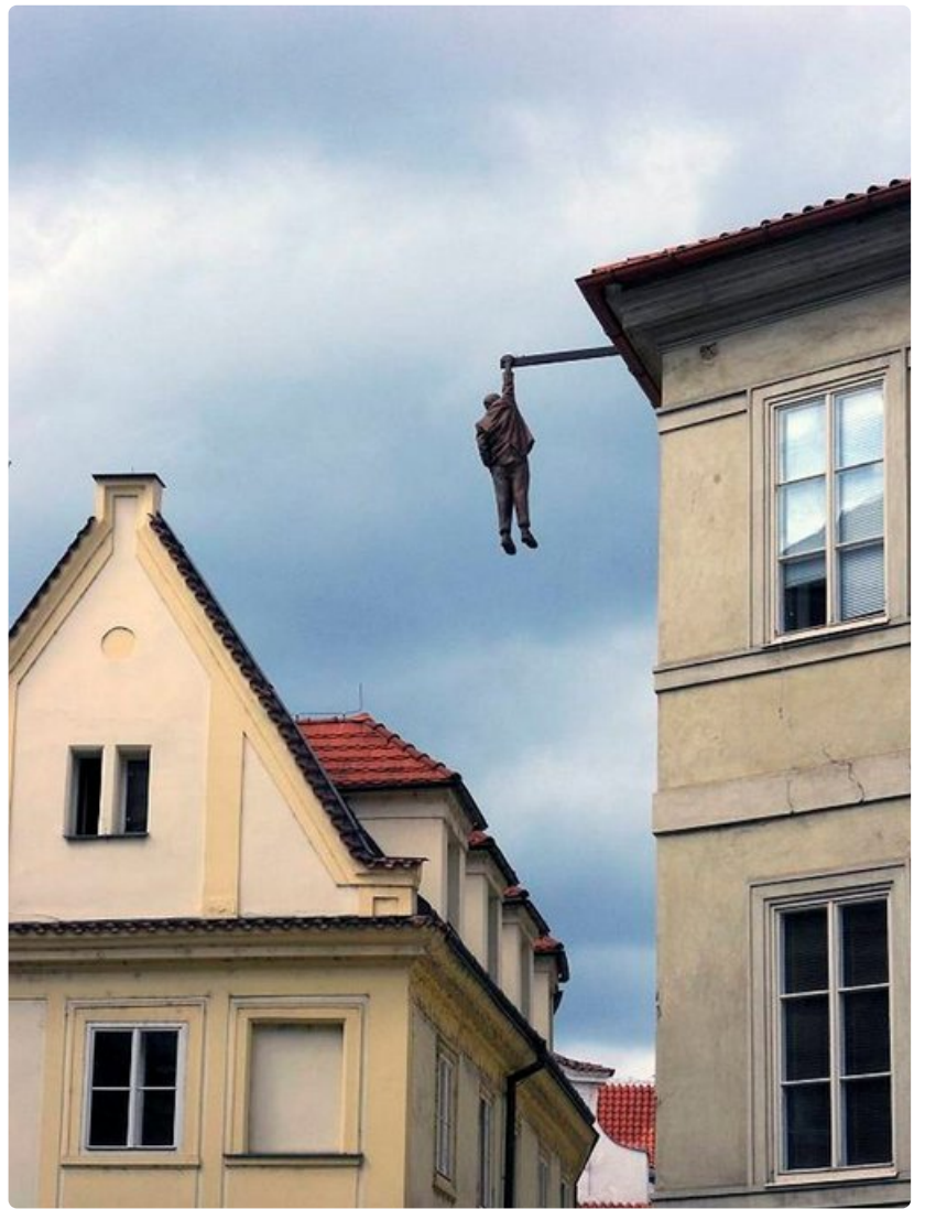
Hanging around - elämää kuilun partaalla.