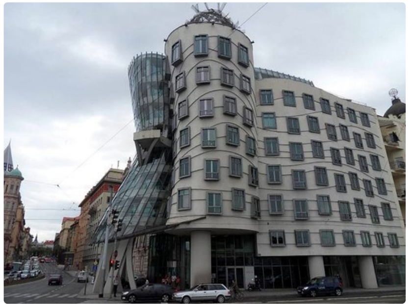
Frank Gehryn suunnittelema Tanssiva talo Vltavan rannalla.