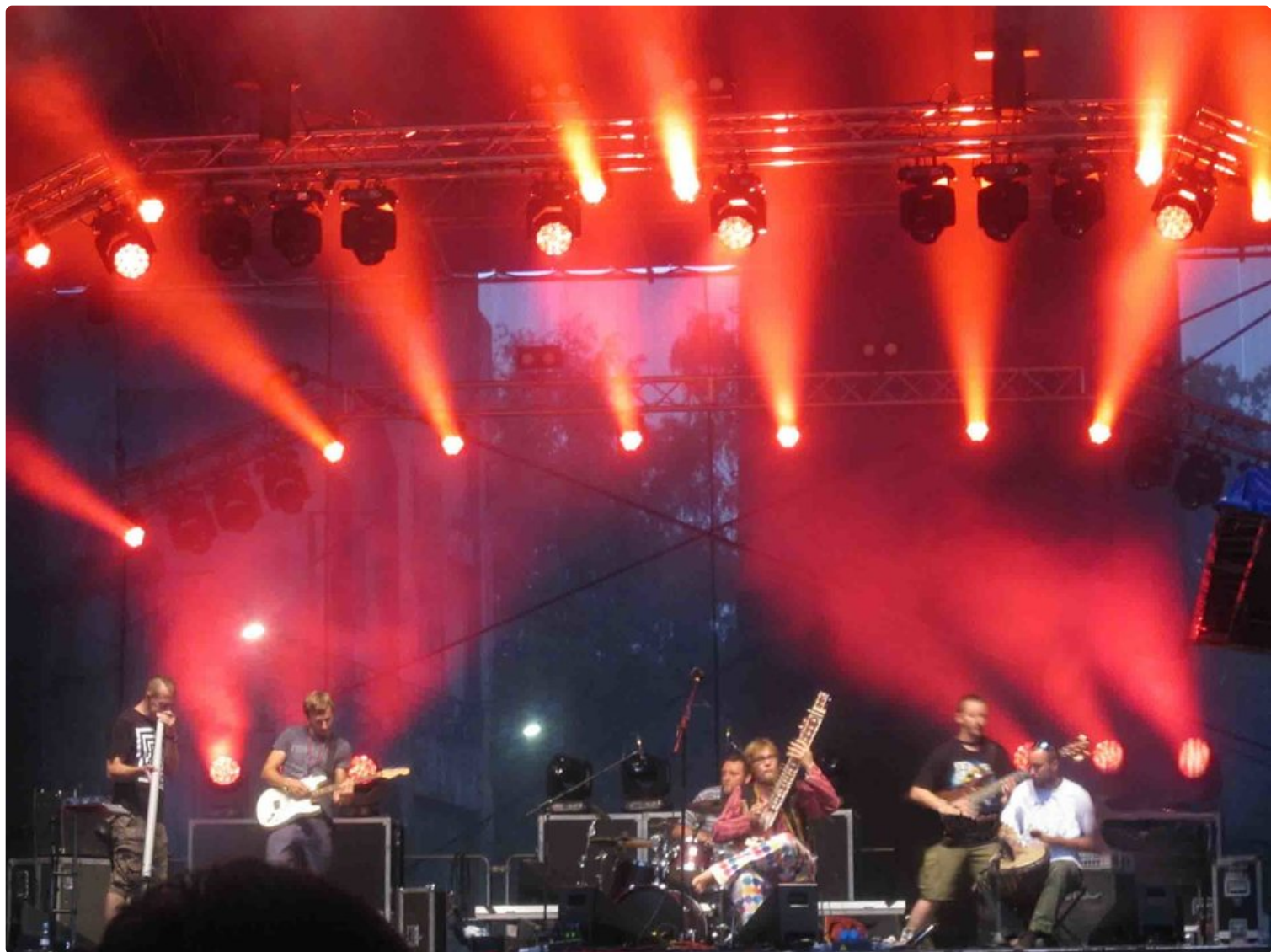
Ostravan värikäs nelipäiväinen musiikkijuhla 14.–17.7. alkoi lämmittelyllä jo edellisenä iltana.