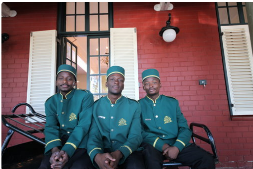
Rovos Raililla matkustajan ei tarvitse itse huolehtia mistään.