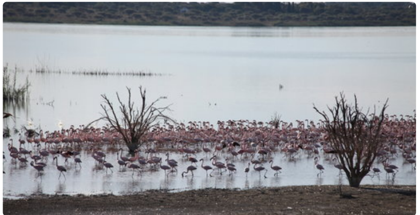
Junan jatkaessa matkaa Kimberleystä matkailijat saavat ihastella satoja vaaleanpunaisia flamingoja.