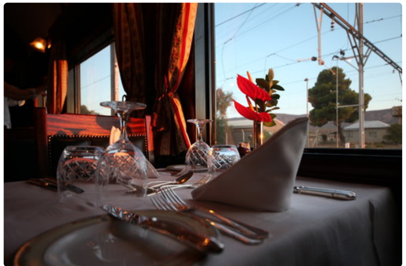
Joka päivä Rovos Railin ravintolavaunuissa tarjotaan aamiaisen, lounas ja neljän ruokalajin illallinen viinien kera.