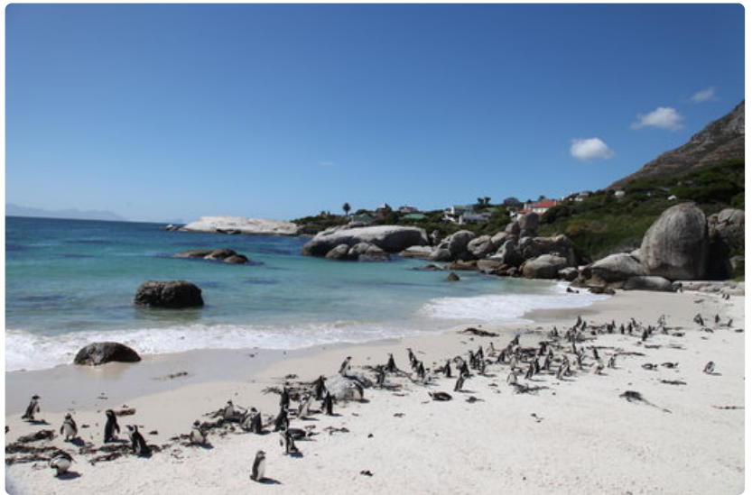
Boulders Beach sijaitsee Simons Townissa, jonne pääsee helposti autolla, taksilla, bussilla tai junalla.