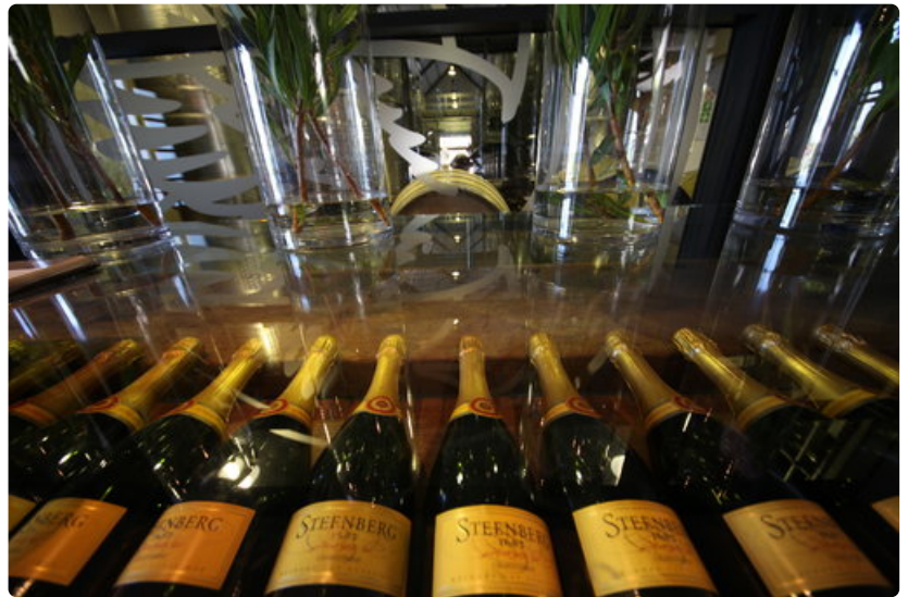
Steenberg Vineyards on vanhin rekisteröity viinitila Capen alueella.