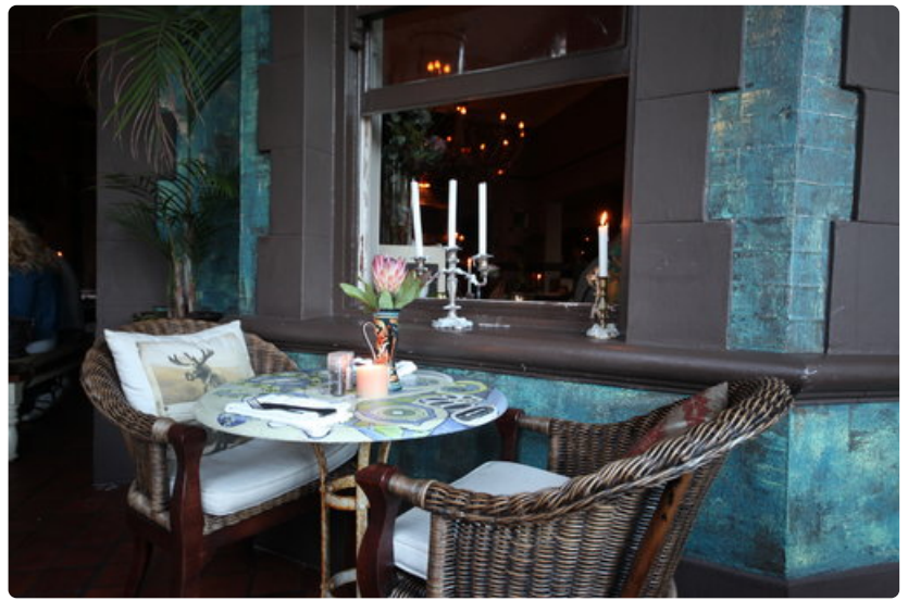
Kloofstreet House -ravintolan jokainen huone on sisustettu eri teeman mukaan.

Rovos Raililla saatuja univelkoja ei yksi yö ajan pysäyttämässä satulinnassa ole voinut pyyhkiä pois. Niinpä nukahdan ennen kuin kone on edes irronnut maasta, mutta unissani palaan vielä Etelä-Afrikkaan: seikkailen yhä viinitiloilla ja nautin kauniista hotelleista, kohtaan ystävällisiä ja elämäniloisia ihmisiä. Aurinko paistaa korkealta taivaalta ja lounaani nautin sen paahteessa. Herätessäni huomaan koneen olevan jo Euroopan rajoilla – ja alan haaveilla paluusta Etelä-Afrikkaan.