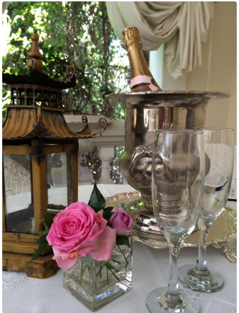
Illyria Housen sisustus on runsaan romanttinen.

Hotellissa vallitsee kunnioitettava, mutta rento ja lämminhenkinen tunnelma, jonka varmistaa vieraista huolehtiva henkilökunta. Ainoana miinuksena voi todeta vain illallisen hotellin ravintolassa -