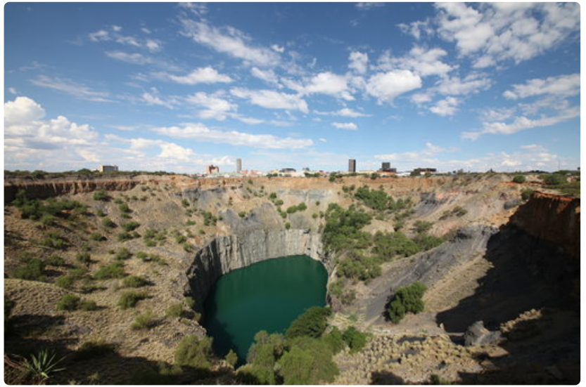
Matkalla Kapkaupungista Pretoriaan pysähdytään Kimberleyn timanttikaivoksella.

Vähitellen aurinko värjää laskiessaan karun maiseman oranssiksi. Kerta toisensa jälkeen en voi olla rakastumasta tähän Etelä-Afrikan maagiseen auringonlaskuun. Satumaisen kaunis hetki on myös aika