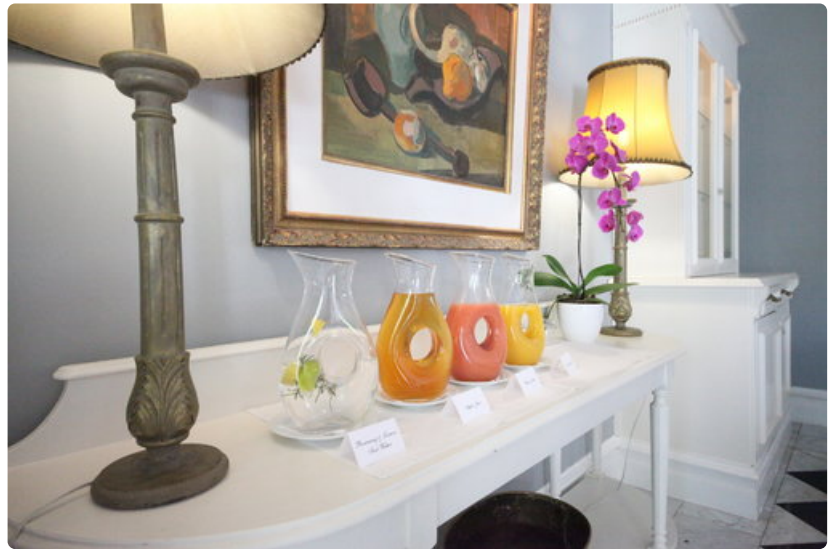
Hotelli Androksessa aamiaisen voi nauttia terassilla.