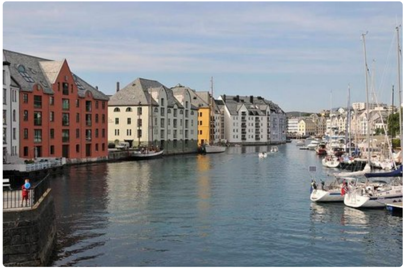
Uudet talot ovat hauskasti kanavan varrella. Vieressä pienvenesatama.