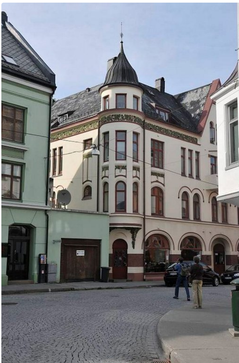
Ålesundin perusilme on edelleen jugendia.