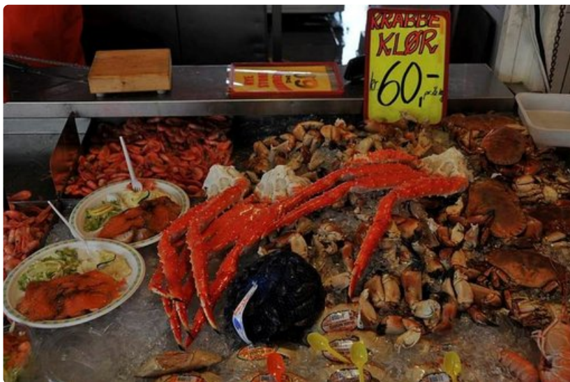
Tarjolla on mereneläviä hummereista taskurapuihin sekä suuriin hämähäkkirapuihin.