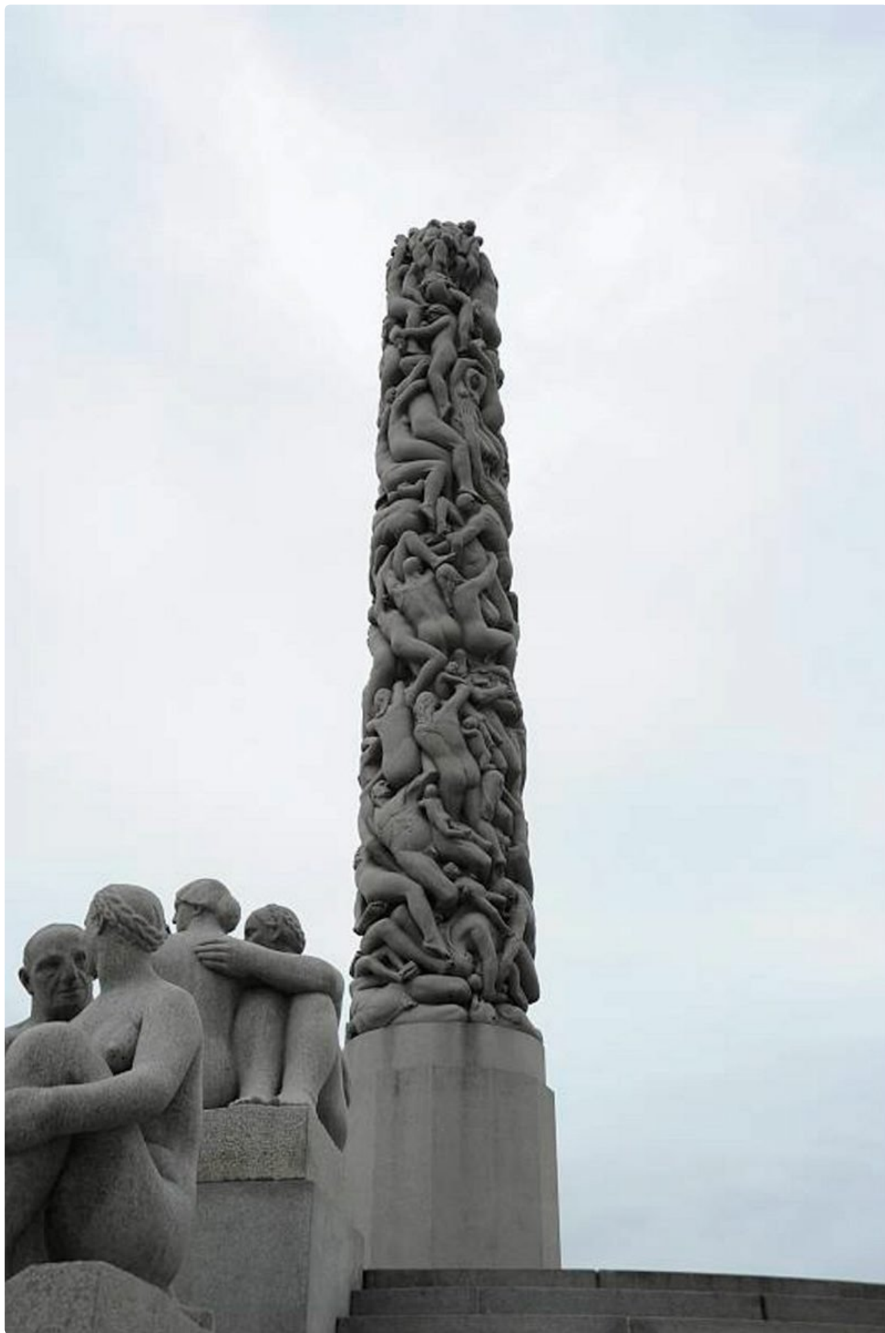
Gustav Vigelandin patsaat kuvaavat elämäkarta sekä miehen ja naisen välisiä suhteita.