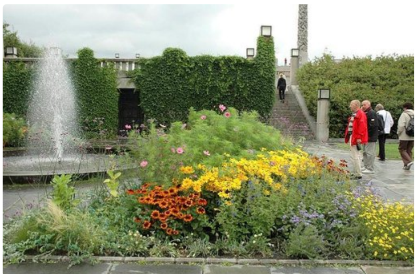
Vigelandin on kesäisin piknik-kohde.