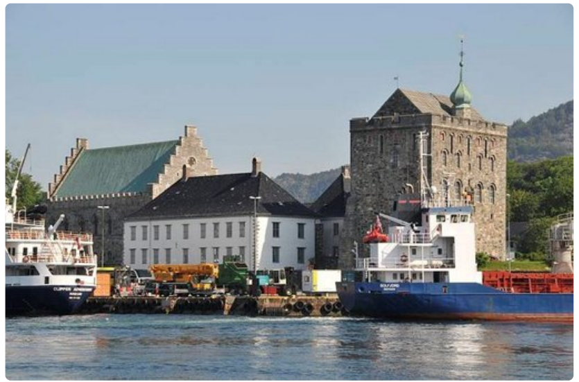
Rosenkrantz-torni ja juhlasali Bergenin sataman kupeessa.

Ålesundin pienehkö kaupunki sijaitsee Geiranger-vuonon suulla, niemen kärjessä. Norjalaiset ovat nimittäneet sen Norjan kauneimmaksi kaupungiksi, jossa on asukkaita noin 43 000. Lähisaariin pääsee autolla meren alitse tunneleita pitkin, joiden tekoon valtion öljyrahaa on käytetty säästelemättä.