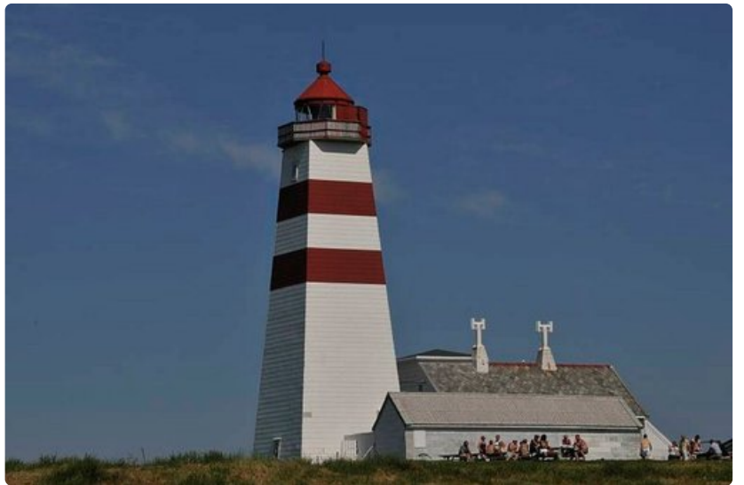
Majakkamuseo niemen kärjessä. Kerrankin kaunis päivä Ålesundissa.