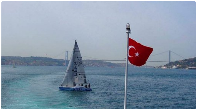
Lähi-idän romantiikasta nauttiville Istanbul on mitä mainioin kohde