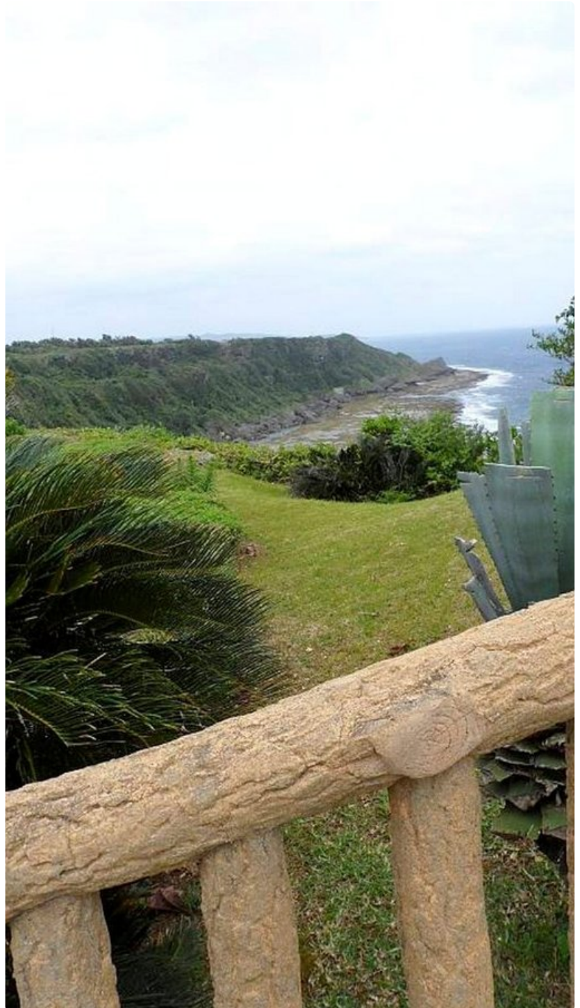
Rantakallioilla käytiin Okinawan taistelu.