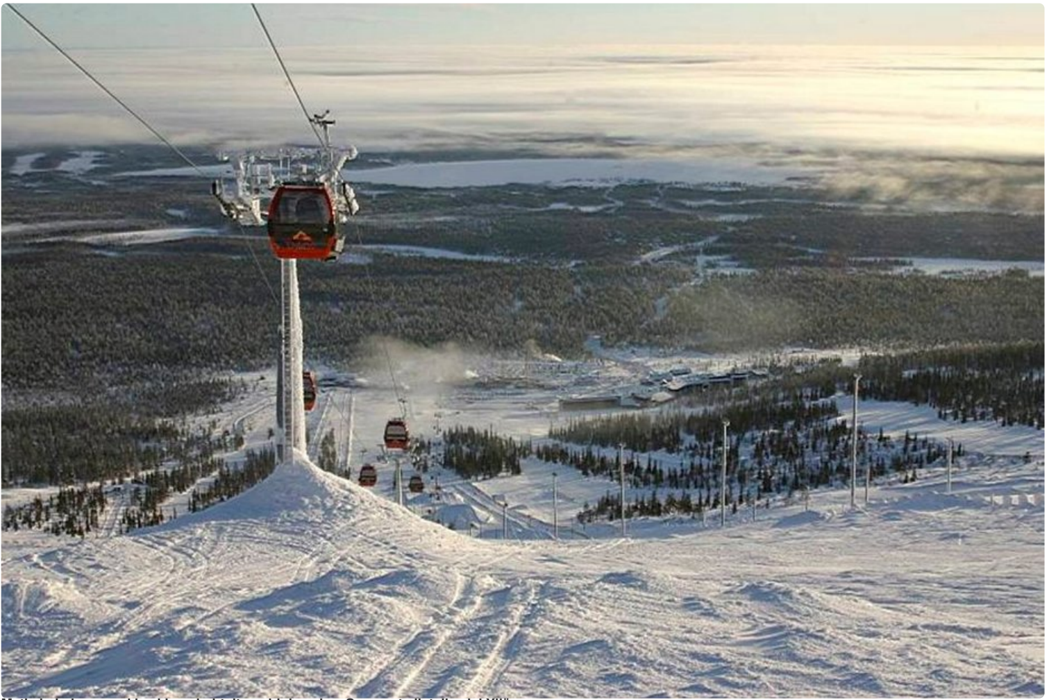
Matkahakukone rankkasi lomakohteita pohjoismaiss. Suomesta listalle ylsi Ylläs.