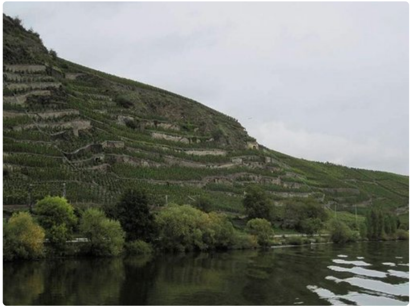
Viinitarhoja Moselin varrella.