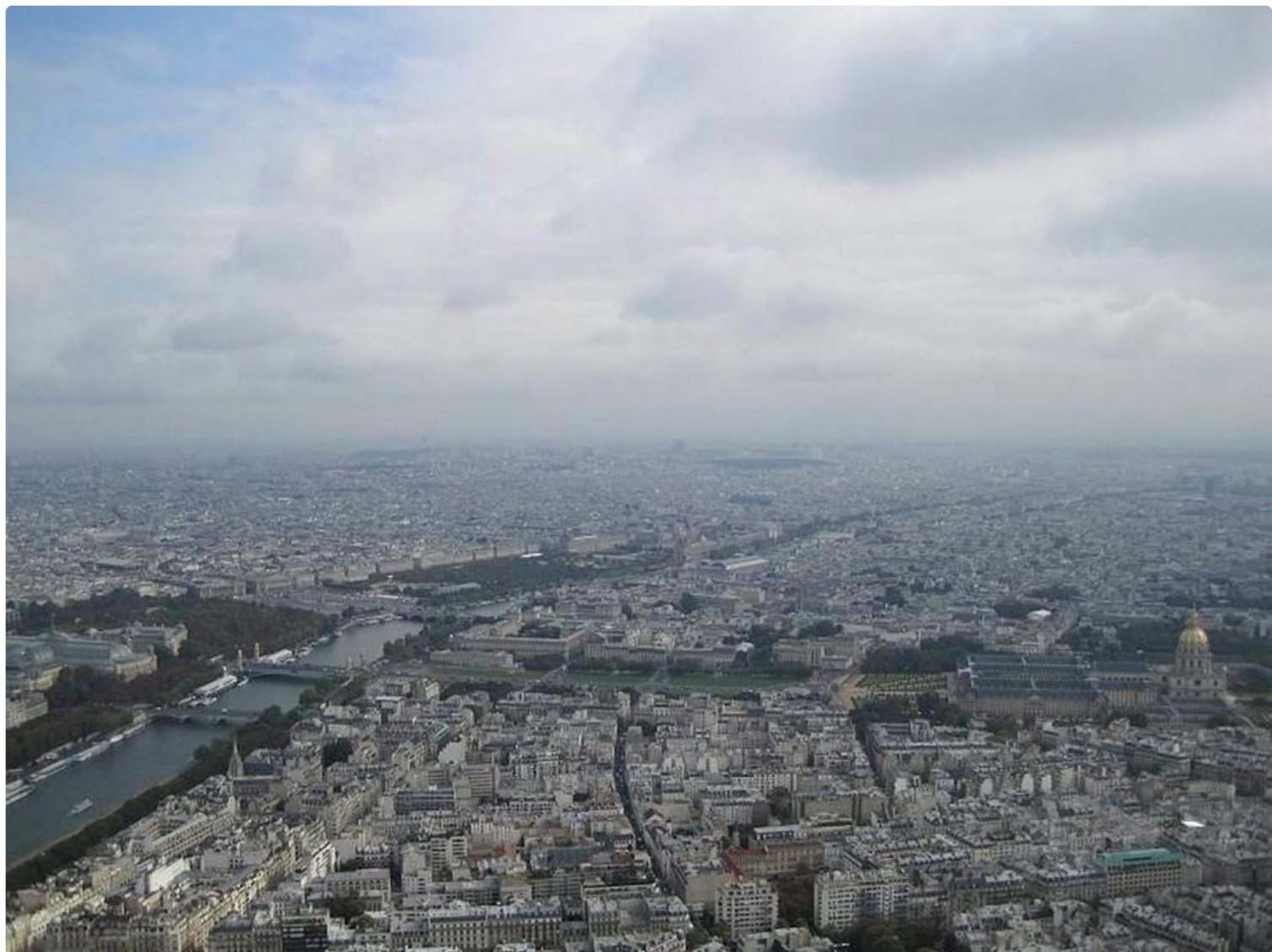
Näkymät Pariisiin Eiffel-tornin huipulta.