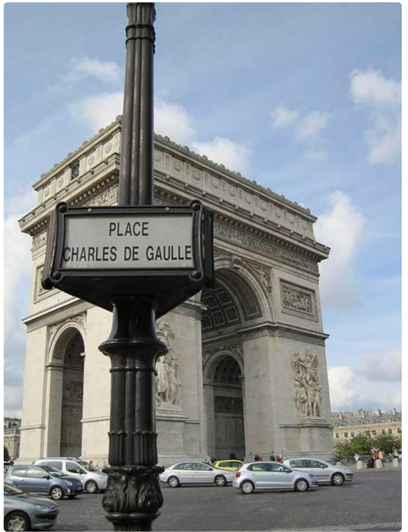
Arc de Triomphe.