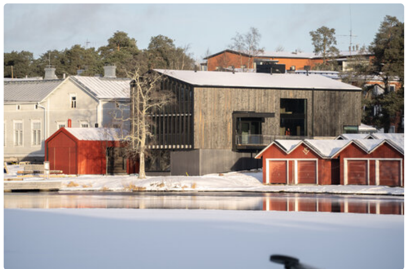
Nokkalan rantaan, Oulujoen varteen valmistuva PAVE Studio sijoittuu historialliseen pihapiiriin, joka tunnetaan venesatamastaan ja vanhasta Nokkalan koulun (entinen Laanilan kansakoulu) rakennuksesta.

Tietoja ryhmävierailuista ja kaikille avoimista päivistä on saatavilla Asuntomessujen kotisivuilla, ryhmille-alasivulla . Sieltä löytyy myös tietoa muista teemakokonaisuuksista, kohdevierailuista ja asiantuntijapuheenvuoroista. Tarkempia tietoja voi tiedustella suoraan messutiimiltä osoitteessa asuntomessut@ouka.fi .