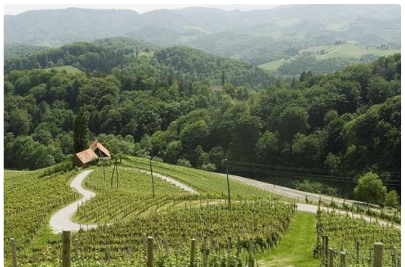
Viininviljely on Sloveniassa tärkeä elinkeino.