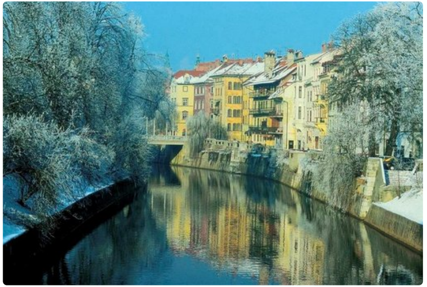
Pääkaupunki Ljubljana on hyvä matkakohde niin kesällä kuin talvellakin.

- Istun mieluummin täällä kanootissa kuin ajan autolla töihin pääkaupunkiin Ljubljanaan. Bohinjin laakso tunnetaan kukkafestivaalistaan, vaelluksista ja kalastusmahdollisuuksistaan. Talvella mennään hiihtokeskuksiin, ja kesälläkin viiden minuutin gondolihiissimatka kilometriä ylemmäs Bohinjin järveltä vie vaellusreittien lähtöpaikalle. Vaikka ei lähtisikään patikoimaan, kannattaa matka tehdä maisemien vuoksi, ja onhan Vogel in hiihtokeskuksessa auki ainakin Merjasecin alppitupa. Hiihtohotelli teki konkurssin poliittisten lehmänkauppojen jälkeen. Järvimatka hiljaisella sähkömoottorilaivalla on elämys. Bohinjin alue kuuluu Triglavin kansallispuistoon, joten järvellä ei paristella moottoriveneillä.