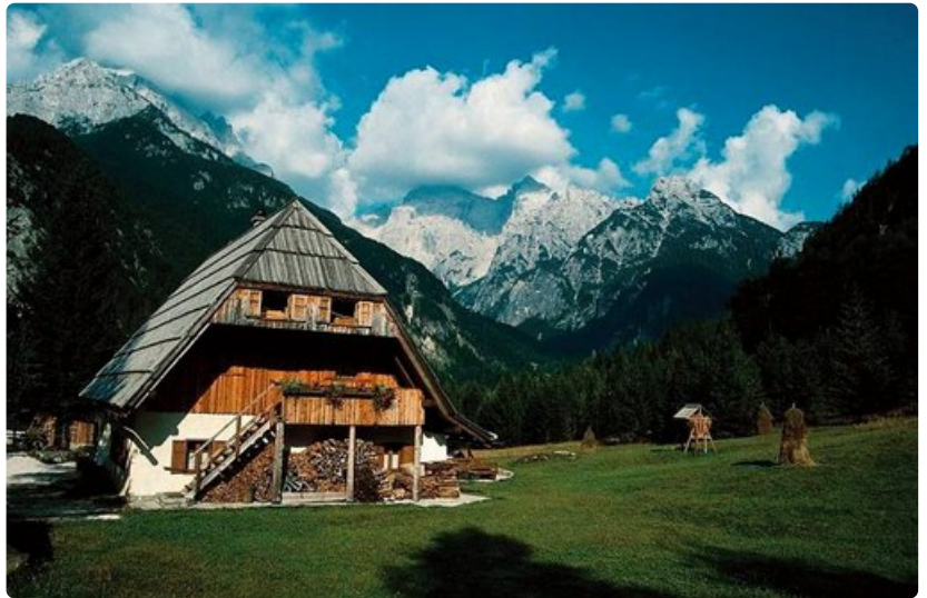
Paikalliseen elämään pääsee tutustumaan vaelluksilla ja telttailen tai mökkeillen.