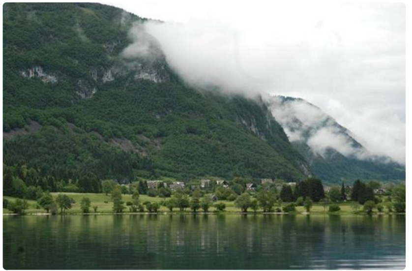
Gondolihsillä pääsee Bohinjin rannasta kilometrin ylös vaeltamaan tai hiihtämään Triglavin kansallispuistossa.