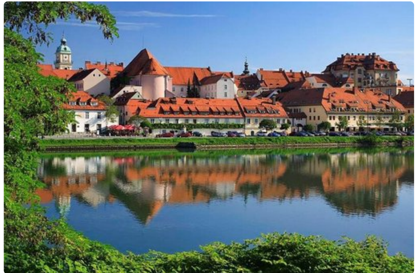
Historiallinen Maribor on vuoden 2012 Euroopan kulttuuripääkaupunki.

Jos Sočan laaksossa haluaa asua todella eristyksissä ja rauhassa pienissä mutta tasokkaissa vuoristomajoissa, kannattaa ajaa ylös Nebesaan eli taivaaseen. Vuorimaisema avautuu suoraan edessä.