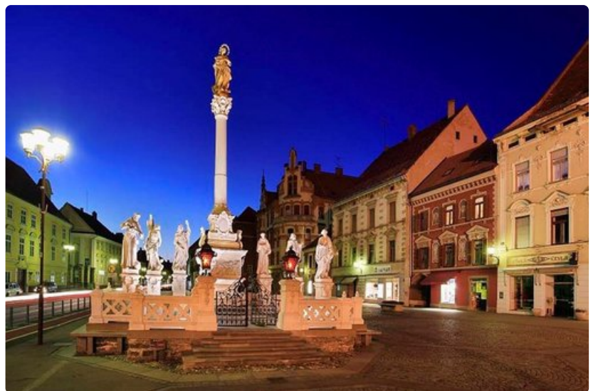
Mariborin raatihuoneenaukiota hallitsee ruton uhrien muistomerkki.