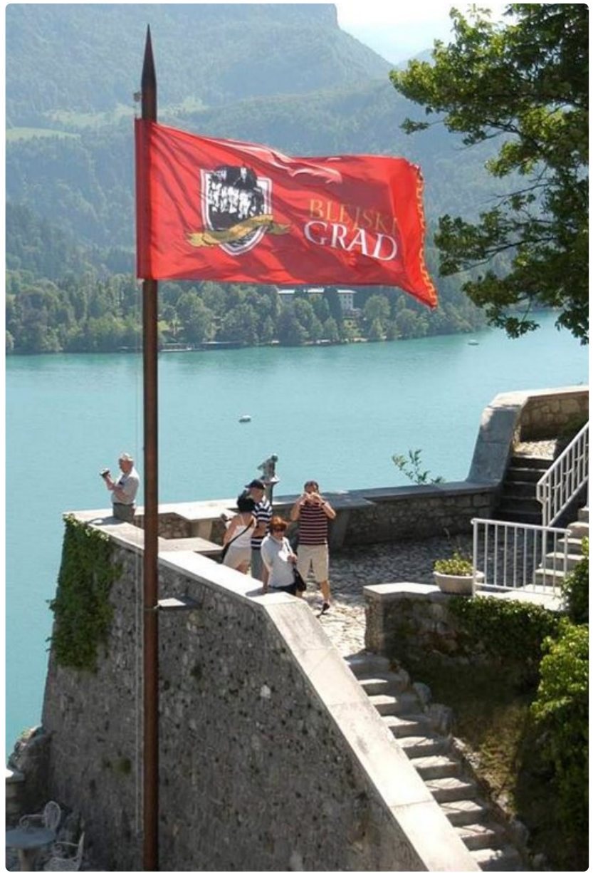
Bledin laakso linnoineen on kauneinta Sloveniaa.