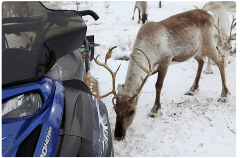
Moottorikelkka on poronhoidon nykyaikaa.