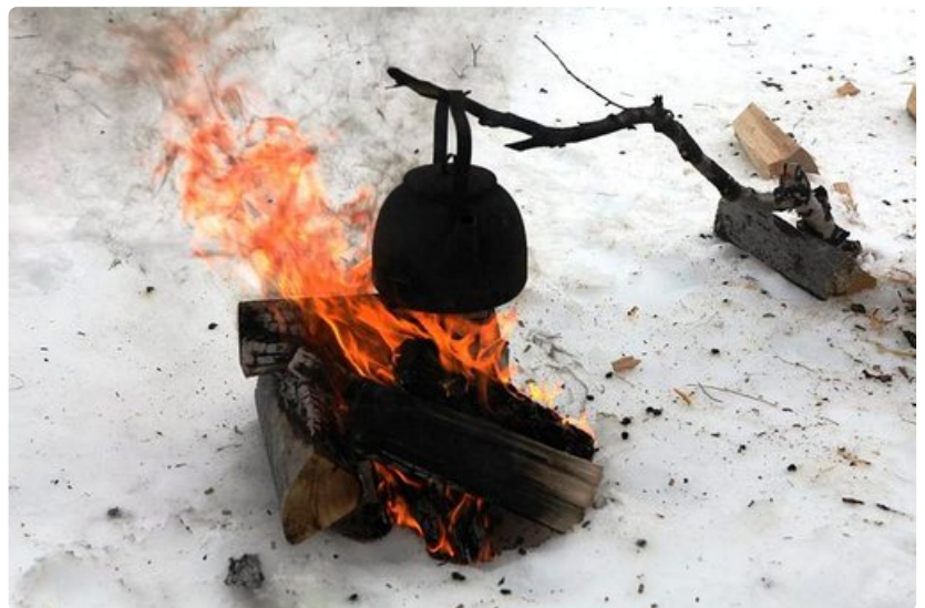
Nokipannukahvit kuuluvat olennaisena osana ohjelmopalvelua.