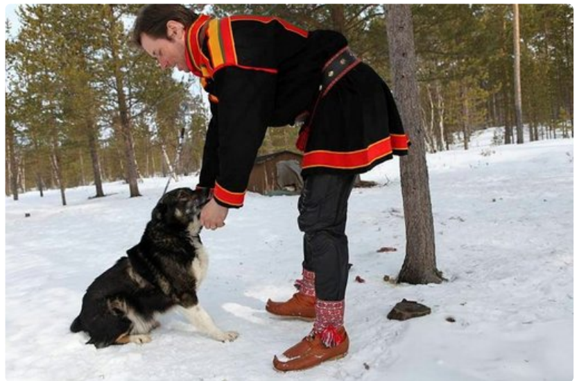
Tsaukki on poromiehen luotettava ystävä.