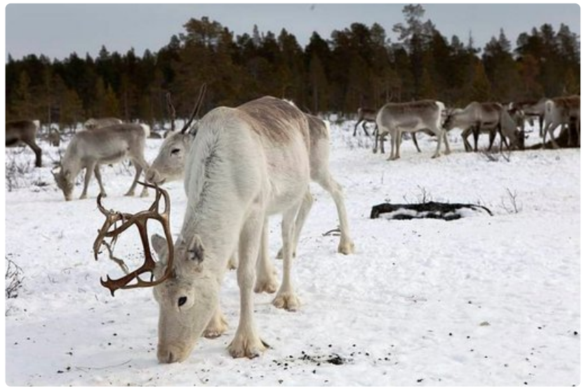
Porot löytävät lisärehunappulat helposti kovaksi tallaantuneella syöttöpaikalla.

vaami, vaadin = naarasporo hirvas = urosporo pailakka =kuohittu urosporo härkä = ajoporo räkkä = vertaimevät, poroissa loisivat hyönteiset rykimä = porojen kiima-aika erotus = työ, jossa porot erotellaan omistajilleen eläviksi ja teuraiksi siula = johdinaita tokka = suuri porolauma etto = porojen kokoaminen nulpoo =sarvensa pudottanut naaras