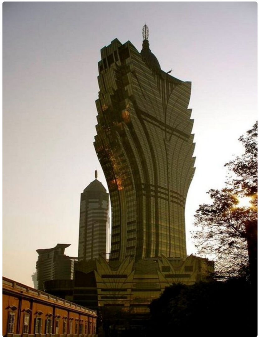
58-kerroksinen kasinohotelli, Grand Lisboa, on yksi Macaon maamerkeistä.

Nuorimies puhuu Temple Street -kadun kuuluisasta yötorista, jonka sadoista kojuista löytyy tavaraa lautapeleistä ja käsintehtyistä nahkakantisista kirjoista kännyköihin, joiden merkki saattaa olla Nokla ja iPhone. Myös muotivaatteita ja kenkiä on tarjolla runsaasti.