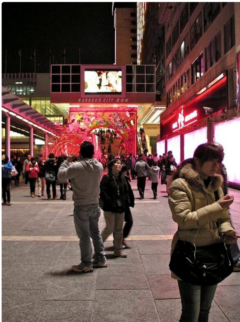
Ilta pimenee, mutta kaupunki valvoo.