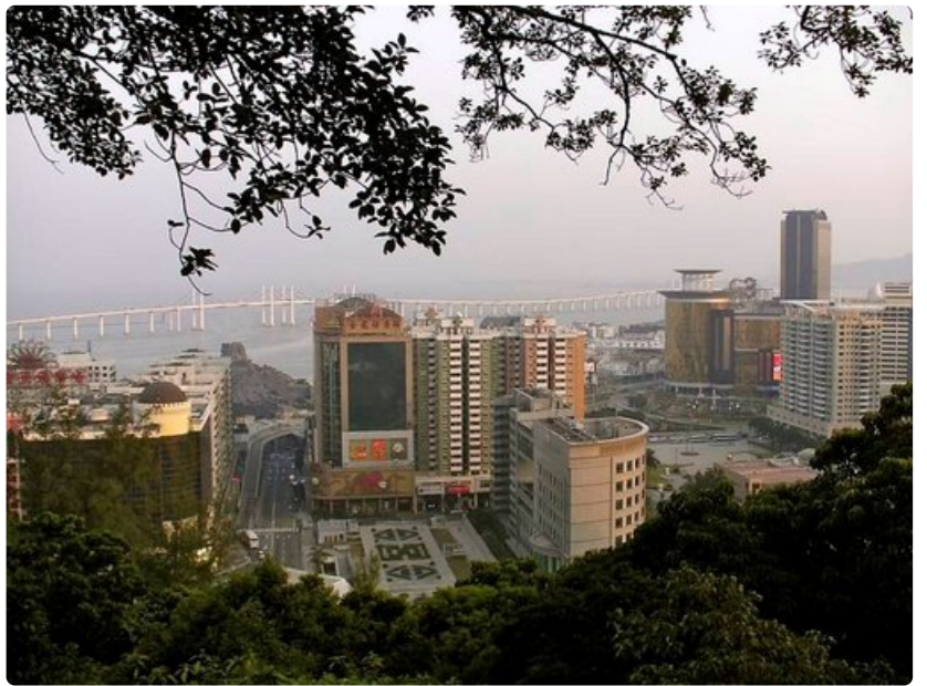
Ponte de Amizade, Ystävyyden silta, yhdistää Macaon niemimaan ja kaupunkiin kuuluvat saaret Taipan ja Coloanen.