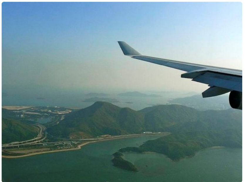
Hongkongin yllättävä vehreys tervehtii matkailijaa jo lentokoneessa.