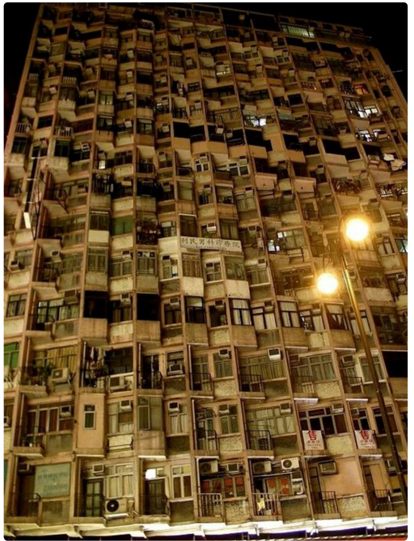
Suuri osa hongkongilaisista asuu kerrostaloissa, joista osa on jo parhaat päivensä nähnyt.

Jos kaipuu Hongkongin vilinään käy suureksi, voi lautan napata koska tahansa noin 13 euron hintaan. Muutaman vuoden kuluttua matka taittunee myös muilla kulkuneuvoilla, sillä Hongkongin, Zhuhain kaupungin ja Macaon välille on rakenteilla 50 kilometriä pitkä siltojen ja tunnelien muodostama väylä. Maailman suurimman merisillan arvioidaan avautuvan liikenteelle vuonna 2016.