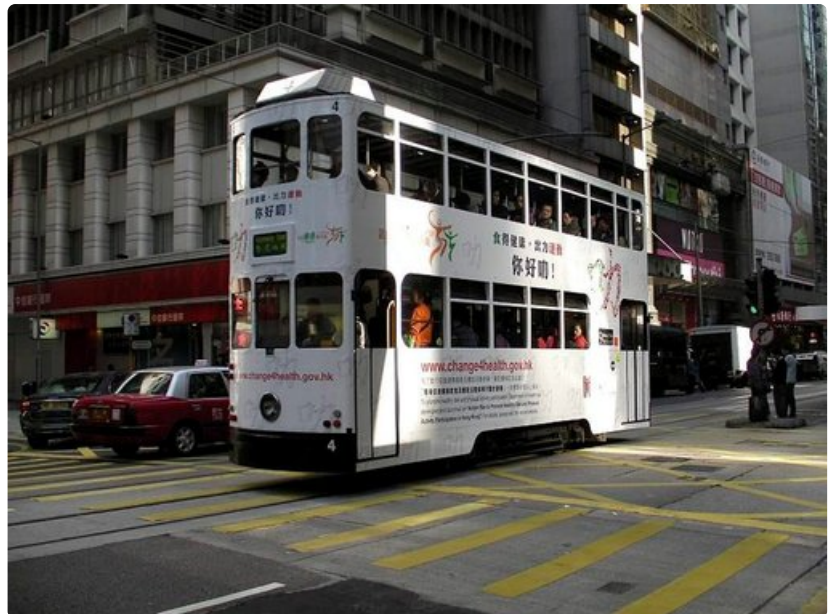
Kaksikerroksiset raitiovaunut ovat osa katukuvaa.