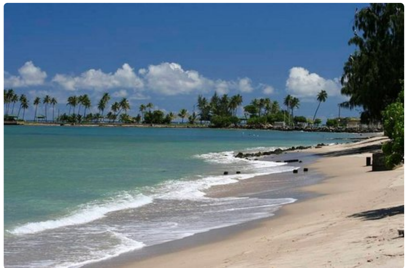
Puerto Ricon rannat ovat häkellyttäviä.