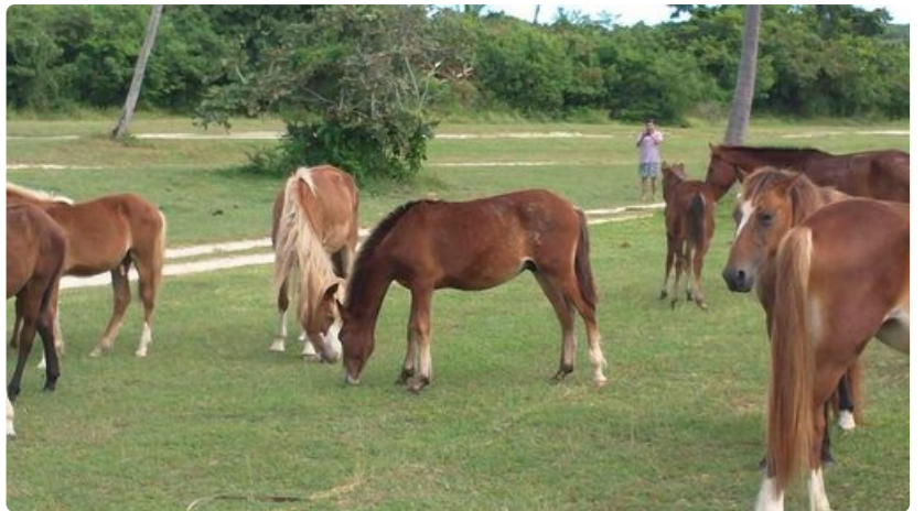
Monilla rannoilla voi nähdä hevosia käyskentelemässä.