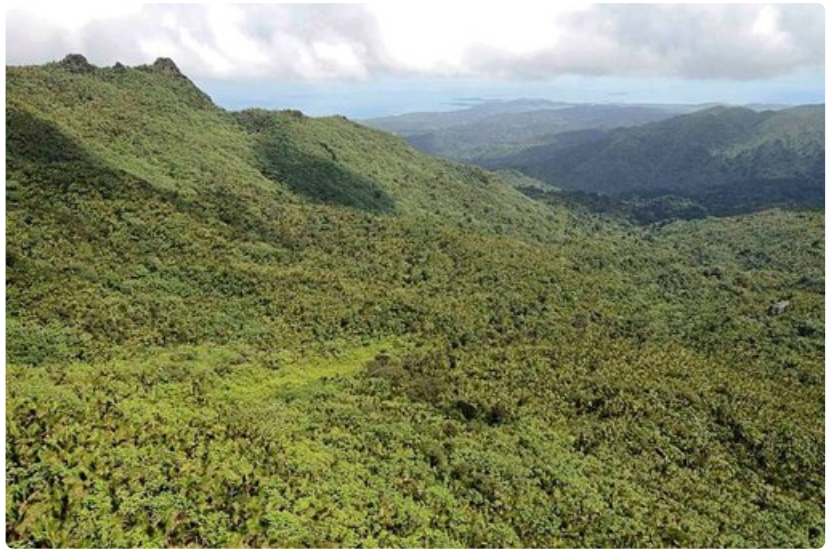
El Yunque kansallispuisto on sademetsää parhaimmillaan.