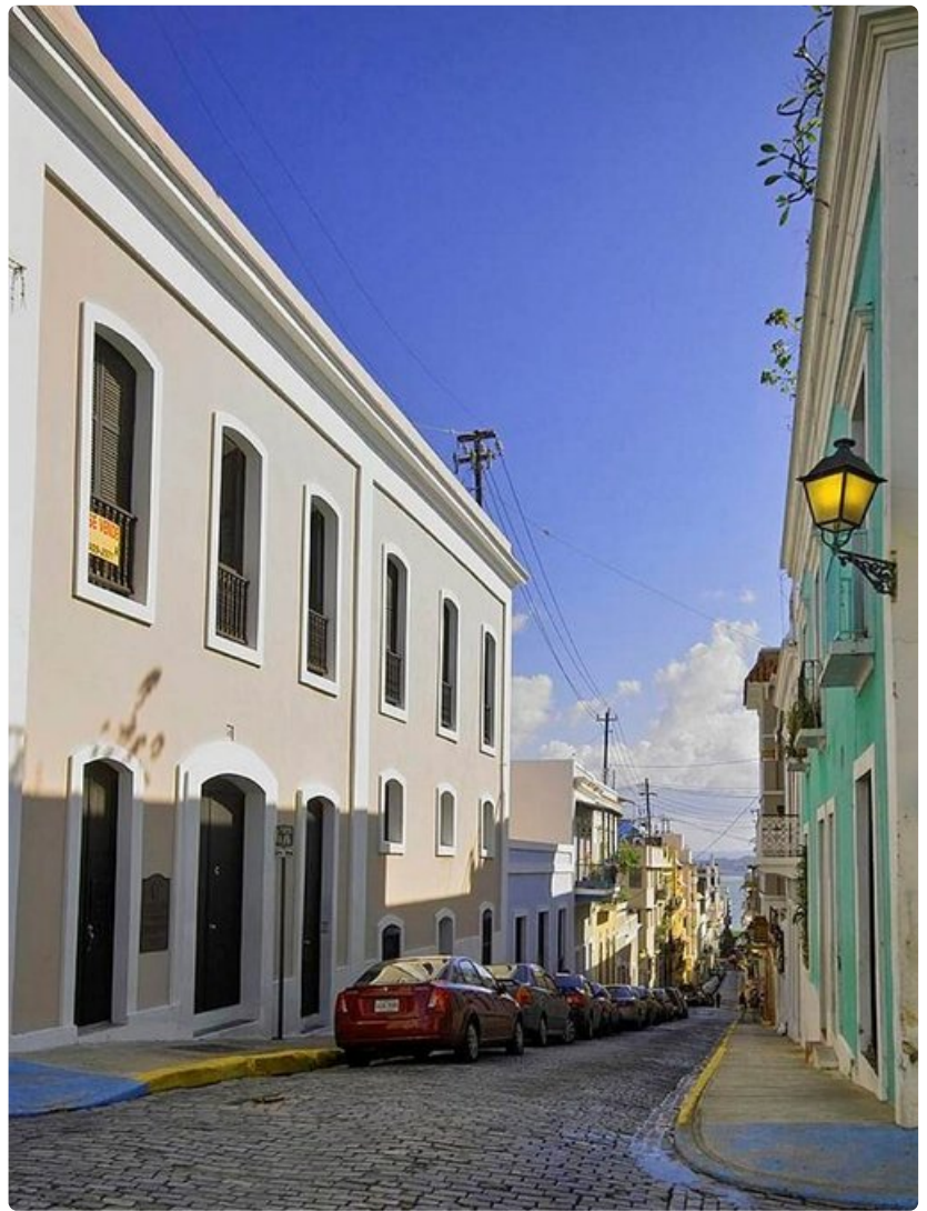
San Juanin Vanhankaupungin pastellinvärisiä taloja.