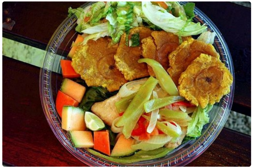
Puerto Rican food is fresh and very fishy.