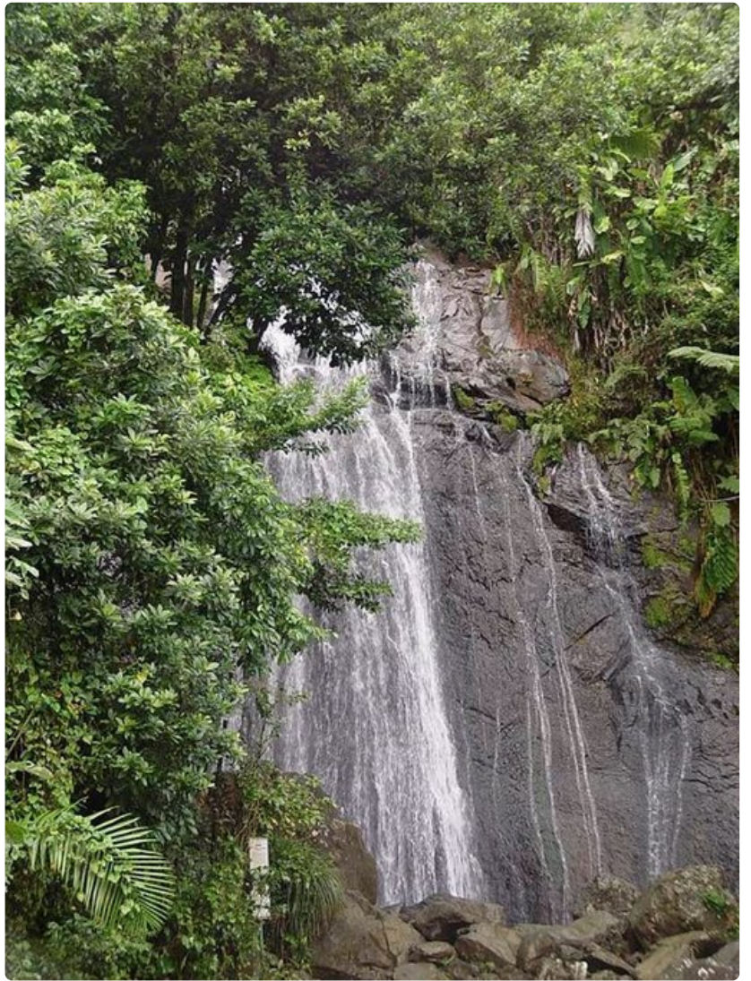
El Yunquen kansallispuistossa on lukemattomia vesiputouksia.