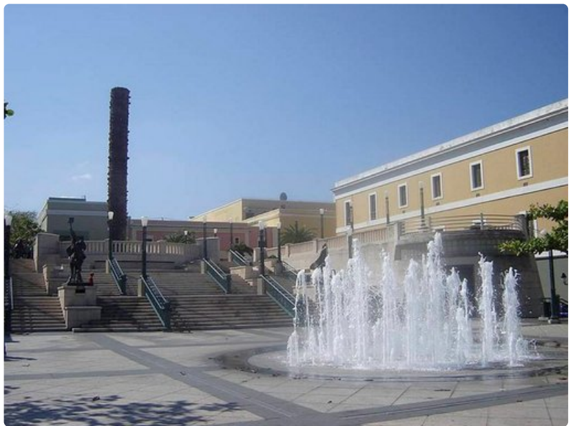
Vanhaa San Juanin kaupunginosaa.