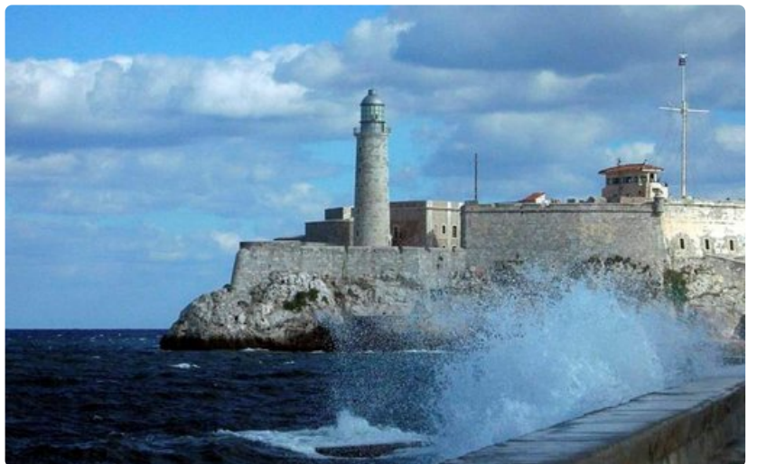
El Morro on yksi San Juanin merkittävimmistä nähtävyyksistä.