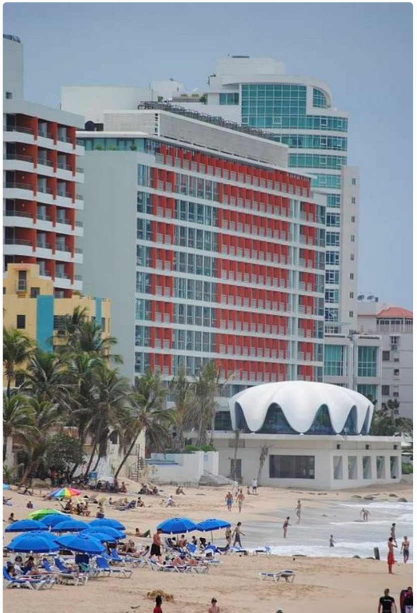
Paikallisten suosiman La Conchan rannan läheisyydessä on laaja tarjonta ravintoloita ja baareja.