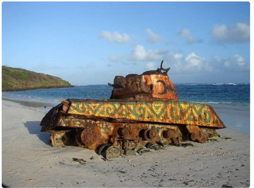
Flamenco Beachin panssarivaunu.