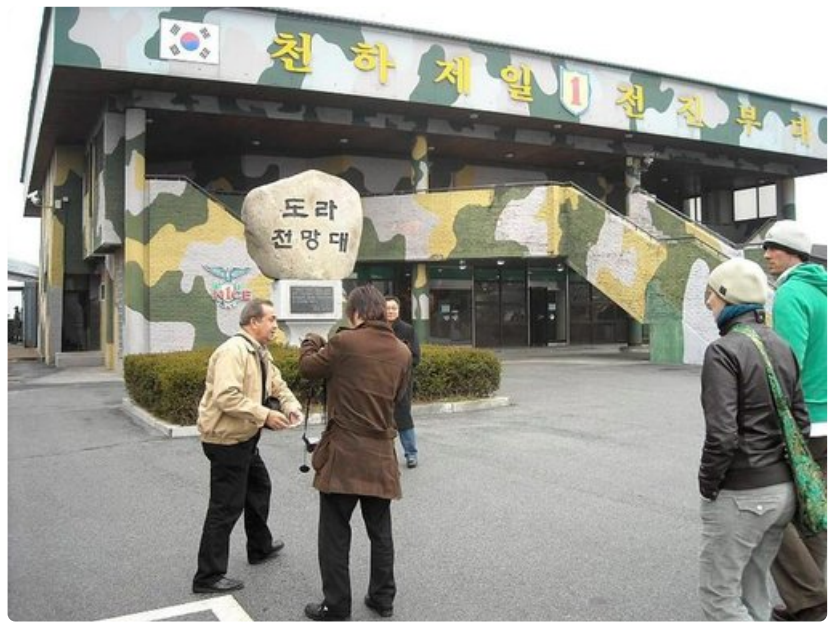
Korealaiset tulevat mielellään demilitarisoidulle rajavyöhykkeelle. Moni on joutunut eroamaan perheestään ja muistokäynnit rajalla ovat yleisiä.

Retken päätyttyä saan tekstiviestin Suomesta. Koreoiden merirajalla on edellisenä iltana uponnut sota-alus ja 50 sotilaan arvellaan hukkuneen. Sotilaiden omaiset ovat kerääntyneet rajalle suremaan, rukoilemaan ja osoittamaan mieltään.