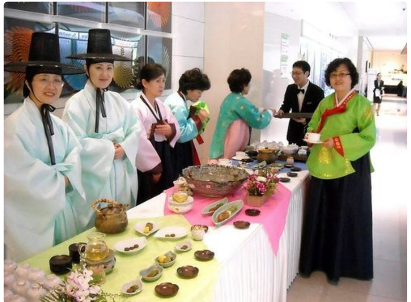
Tee maistuu siltä miltä sen pitääkin, kun se tarjollaan perinteiseen tapaan.