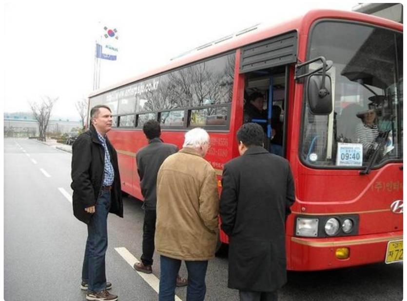
Rajavyöhykkeellä turistibussi vaihtuu toiseen linja-autoon. Passit tarkastetaan ja kellonaikoja noudatetaan minuutilleen.