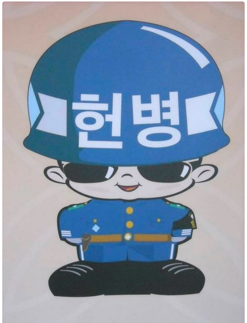
Eteläkorealaisella sotilaalla on aurinkolasit.