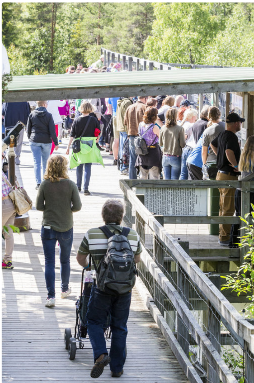
Ranuan eläinpuiston ydinkesä oli vilkkaampi kuin viime vuonna.