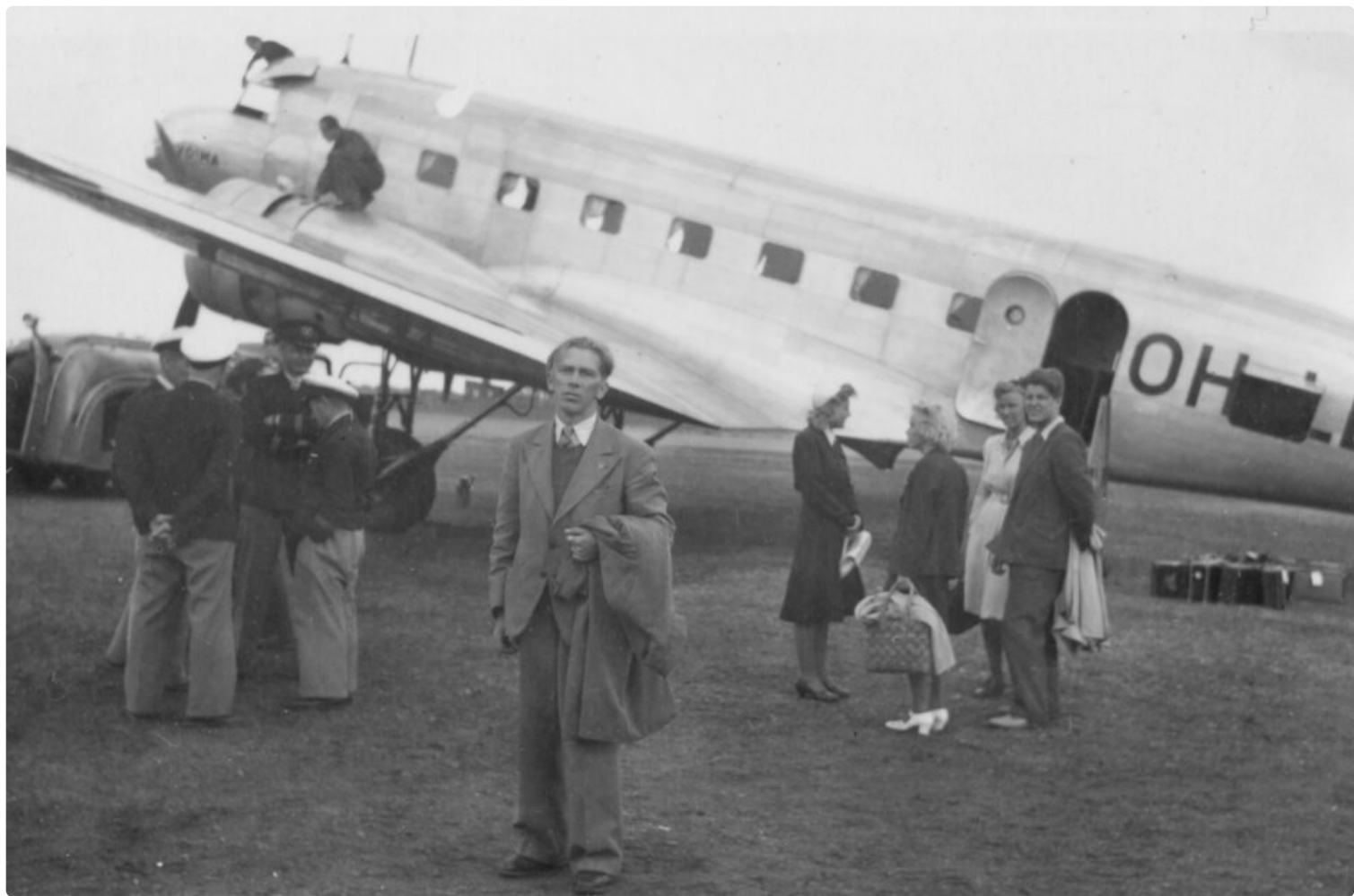
Matkustajia Hyvinkään lentokentällä. Taustalla Aero Oy:n DC-2 OH-LDA "Voima".