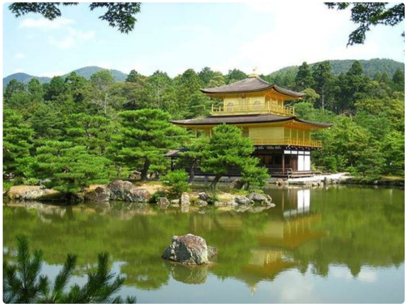
Kioton Kultainen temppeli on vaikuttava näky.