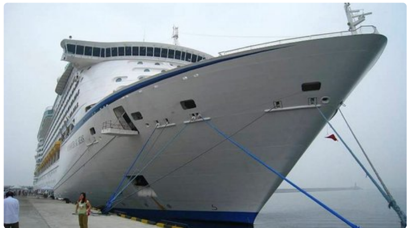
Voyager of the Seas -alus on rakennettu Suomessa.