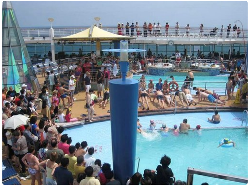
Ohjelmatarjontaa ja tapahtumia riittää myös kannen allasalueelle.

Viikon risteilyloma kuluu kuin siivillä, ja pian horisontissa pilkottaa taas Wusongkoun avaruusala muistuttava satamarakennus. Vielä on muutamia matkapäiviä jäljellä, ja niiden aikana ennätämme ihastua monipuolisen Shanghain vetovoimaan. Kiinan länsimaisimmaksi kaupungiksi kehitetty ja parjattu kaupunki on ainutlaatuinen yhdistelmä uutta ja vanhaa. Ikivanhat pikkutemppelit nököttävät sovussa taivaita kohti kurkottelevien modernien pilvenpiirtäjien lomassa. Vierailukohteita on sopivasti, ja kävellen ehtii nähdä paljon pieniä, mutta kiinnostavia yksityiskohtia. Kuumankostea ilma verottaa hieman nautintoa, mutta onneksi lomalla ei ole mihinkään kiire.