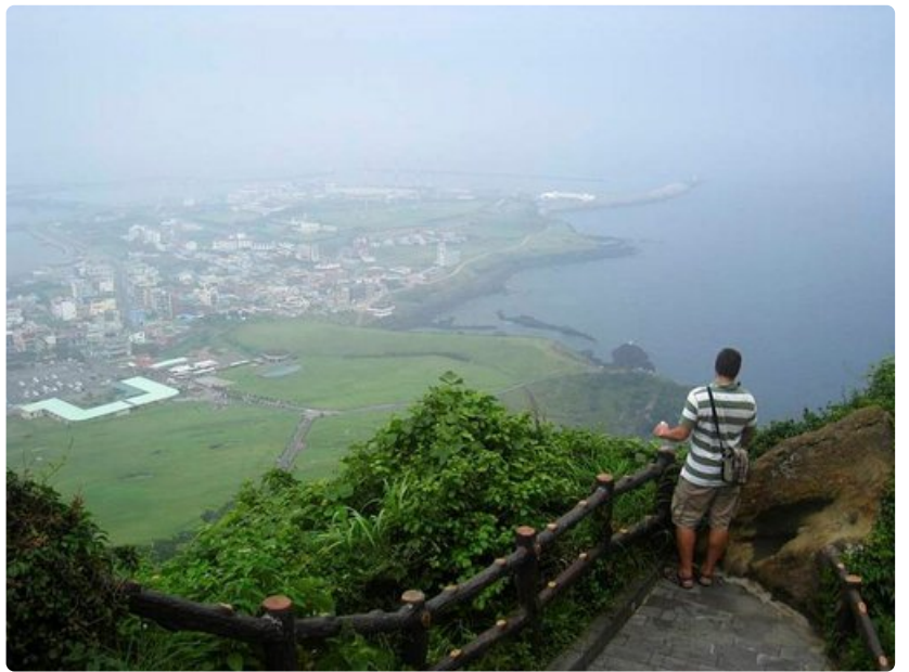
Jejun tulivuorisaari Etelä-Koreassa on tuntematon helmi.