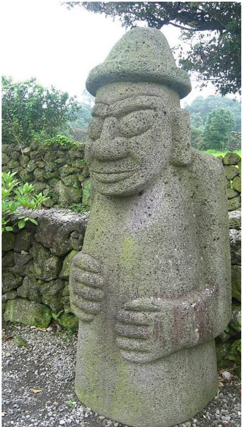
Vulkaaniset kivipatsaat ovat yleinen näky Jejun saarella.