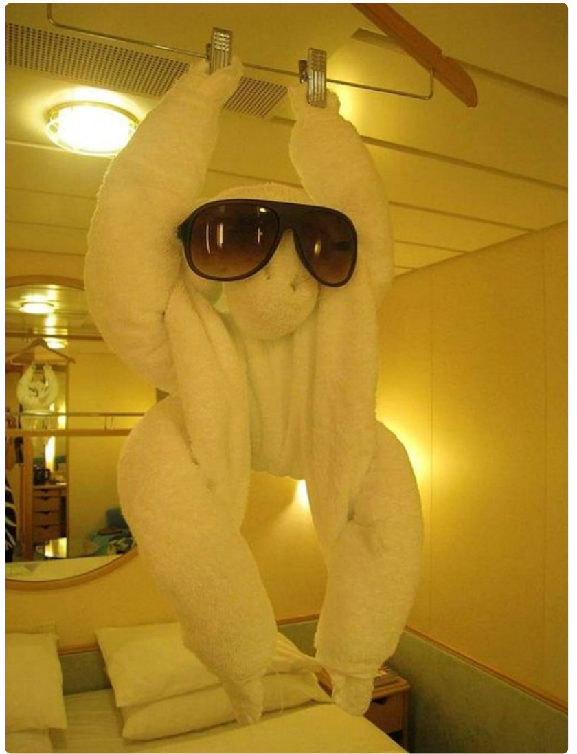
Illallisen aikana hyttiin ilmestynvä pyyhe-eläin riemastuttaa.