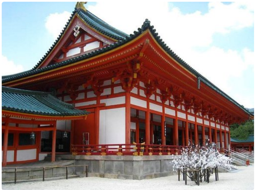
Punainen shintolaistemppeli kuuluu Kioton kauneimpiin nähtävyyksiin.