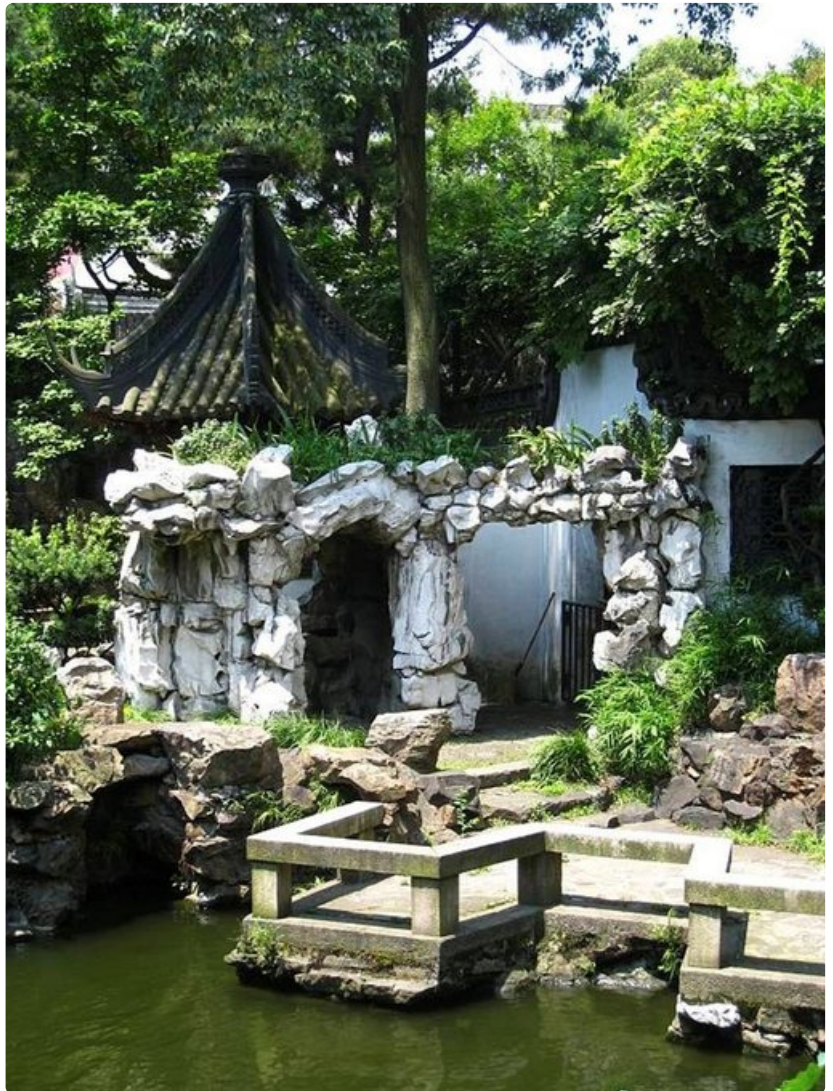
Yu's Garden -puisto Shanghain keskustassa on rauhallinen keidas miljoonakaupungin keskellä.