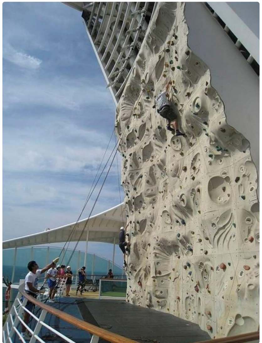
Kiipeilyseinä viihdyttää hurjapäitä.