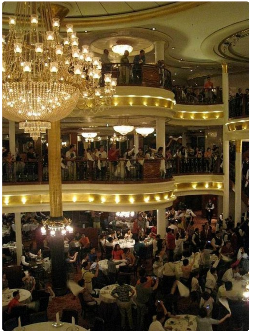
Ylelliset ruokasalit tekevät illallishetkistä nautinnon.