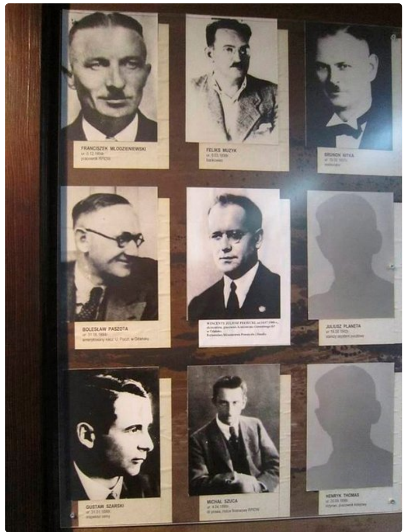
Puolan eliitti tuotiin Stutthofin leirille työhön ja tuhottavaksi.