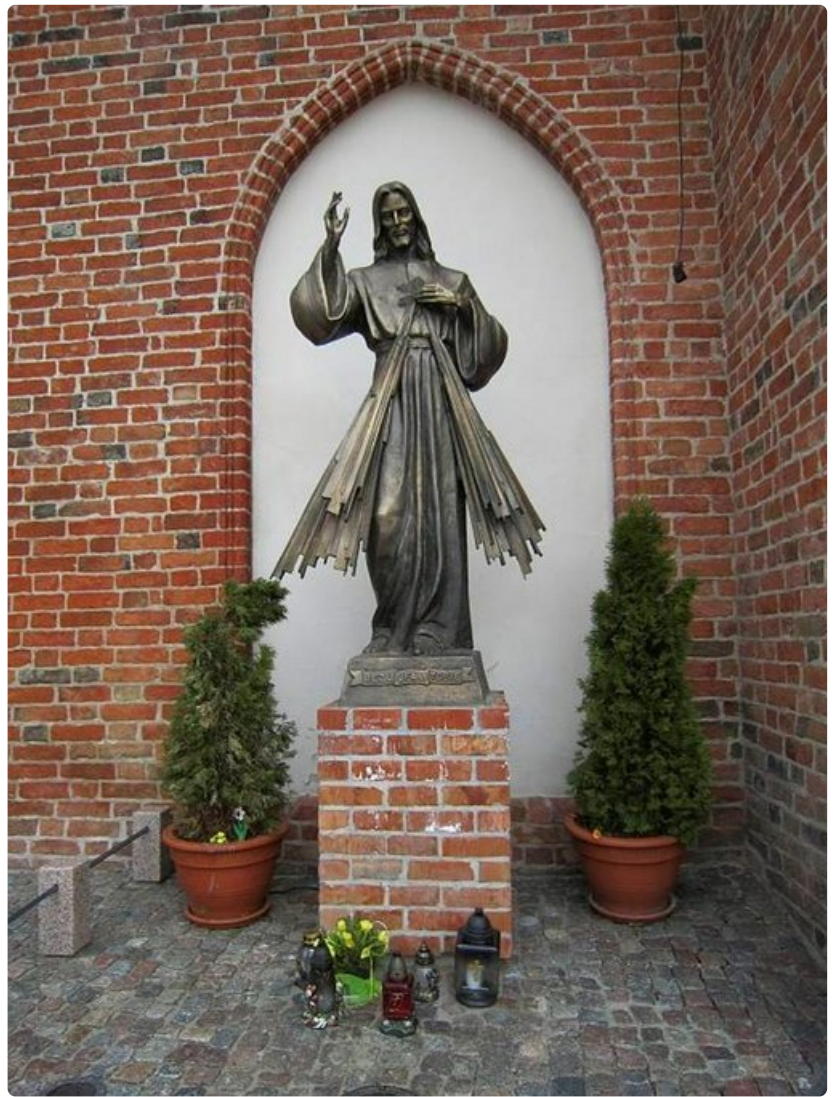
Tervetuloa Oliwan katedraaliin.