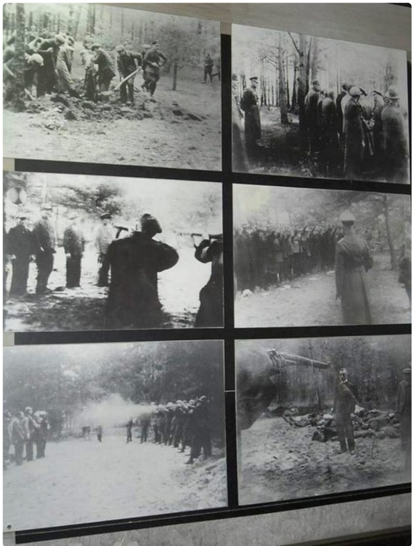
Museon kuvakertomuksesta löytyy vain pahuutta ja tuskaa.