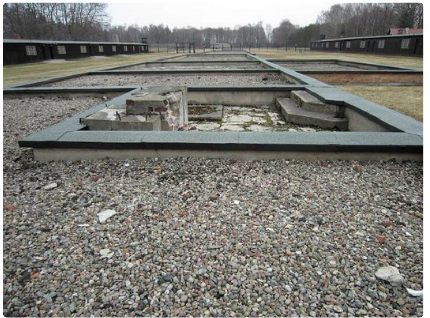
Lohduttoman karu keskitysleirin pääkenttä.