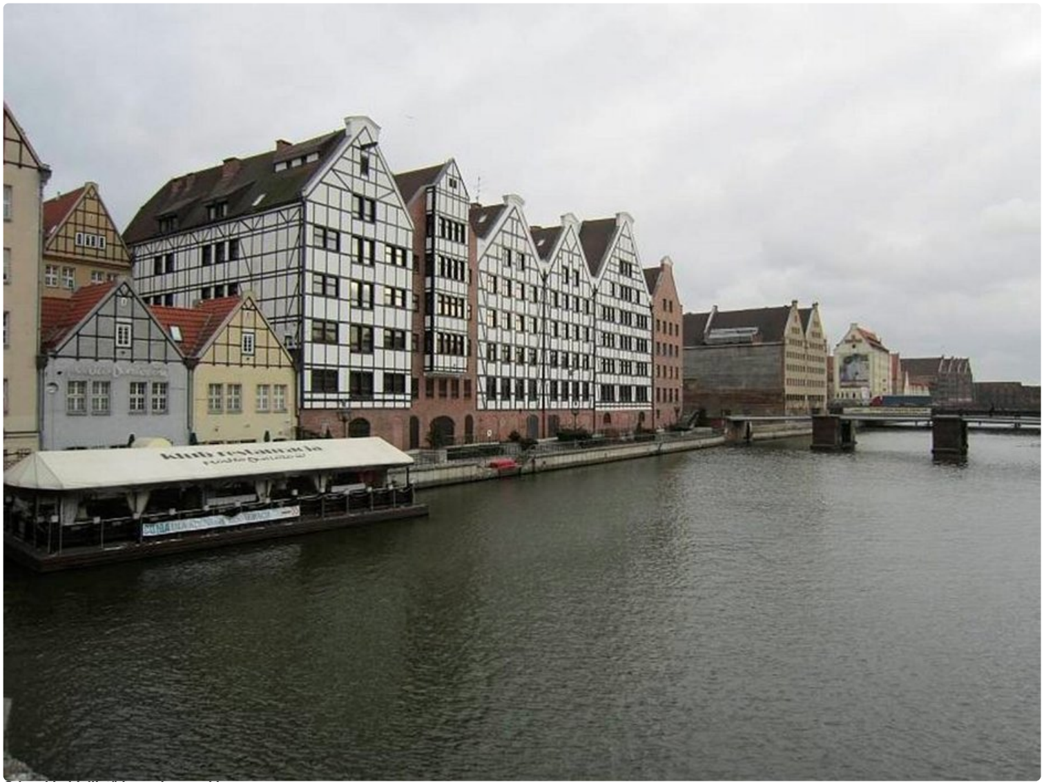
Gdanskin idyllistä hansakaupunkia.