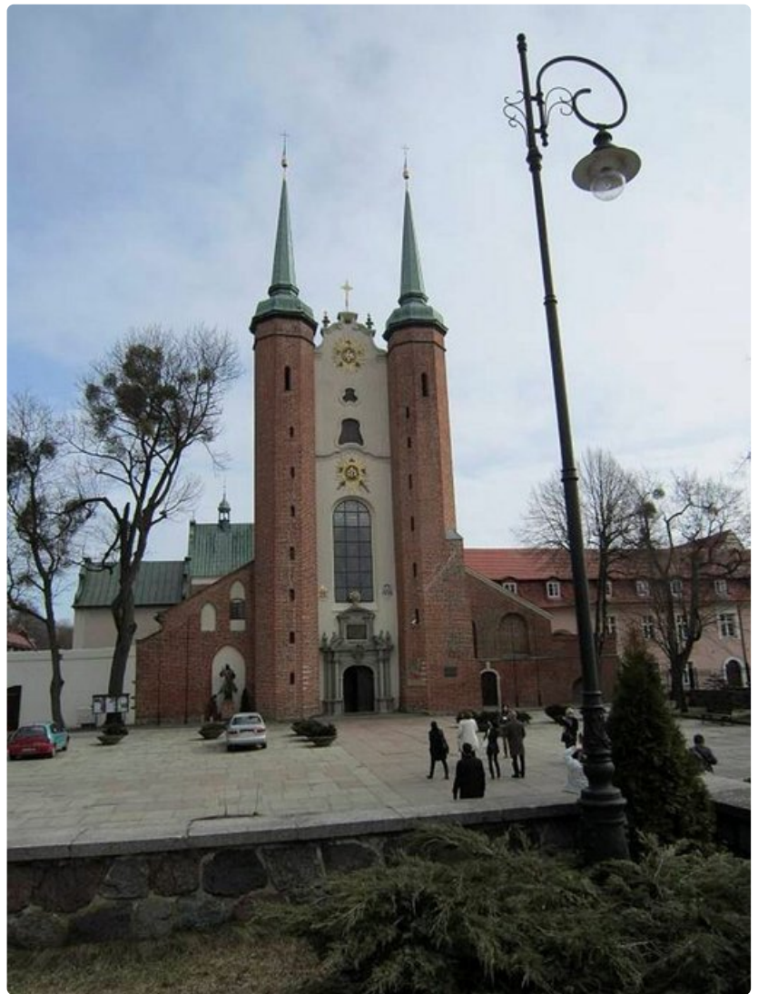
Oliwan katedraalissa voi hiljentyä kuuntelemaan 7800 urkupillin ääntä.

Jo vuonna 1936 Puolassa listattiin "epärotuiset", puolalainen eliitti ja juutalaiset. Sodan alettua pidettiin 36 000 korkeasti koulutettua puolalaista, joita alettiin koota historian ensimmäiselle, Saksan