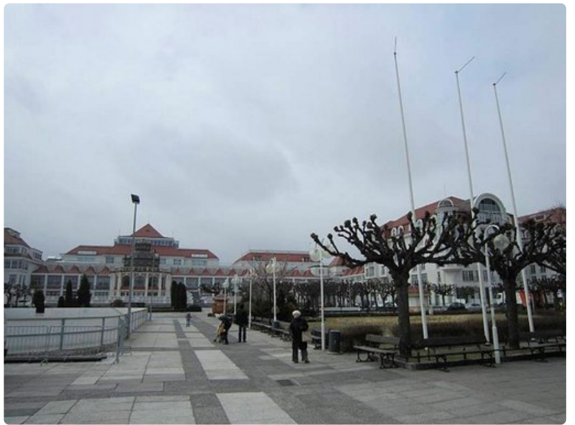
Sopotissa on tarjollakylpylöitä ja..