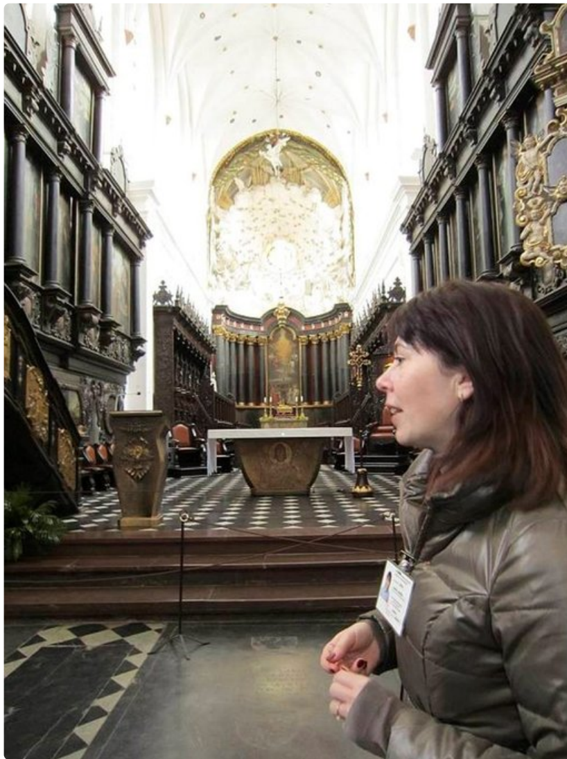
Alttaritaulun valkoinen yläosa kuvaa taivasta, alaosa tummaa maailmaa.