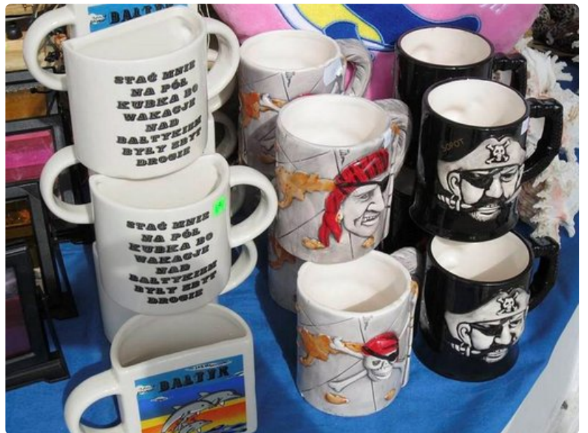
Mukeja matkamuistoksi Puolasta.