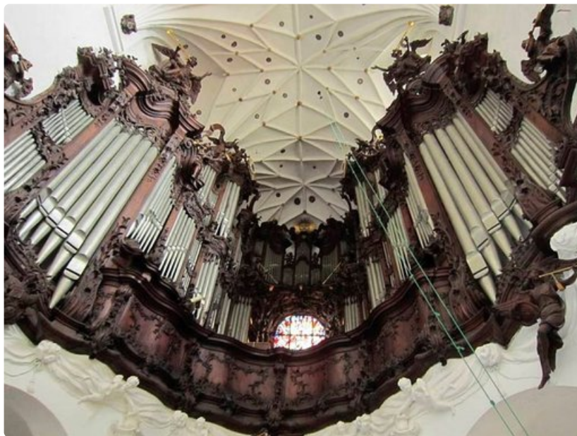
Katedraalin urkujen soiton tahtiin tanssii 20 enkeliä.