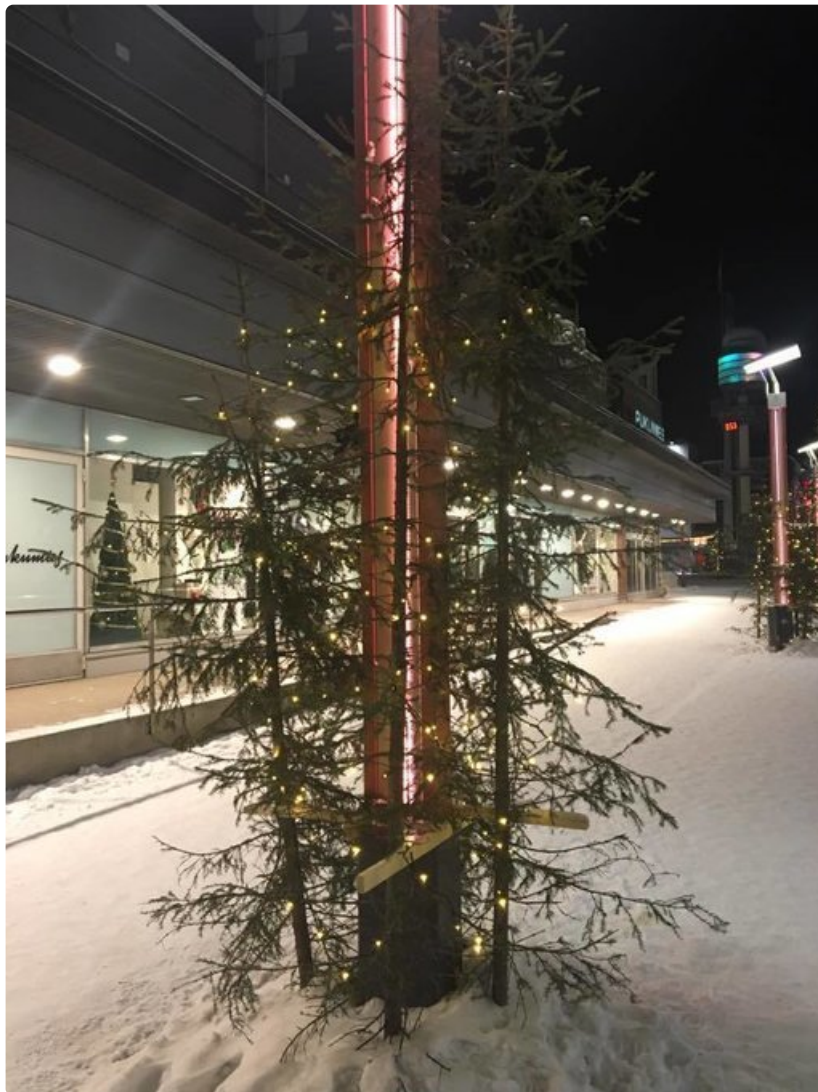
Tällaiset risukuuset koristivat viime joulun alla Rovaniemen joulukatua ennen viikonloppua, jona Janne Honkanen joukkoineen toi paikalle uudet, tuuheammat kuuset (kuva ylhäällä).