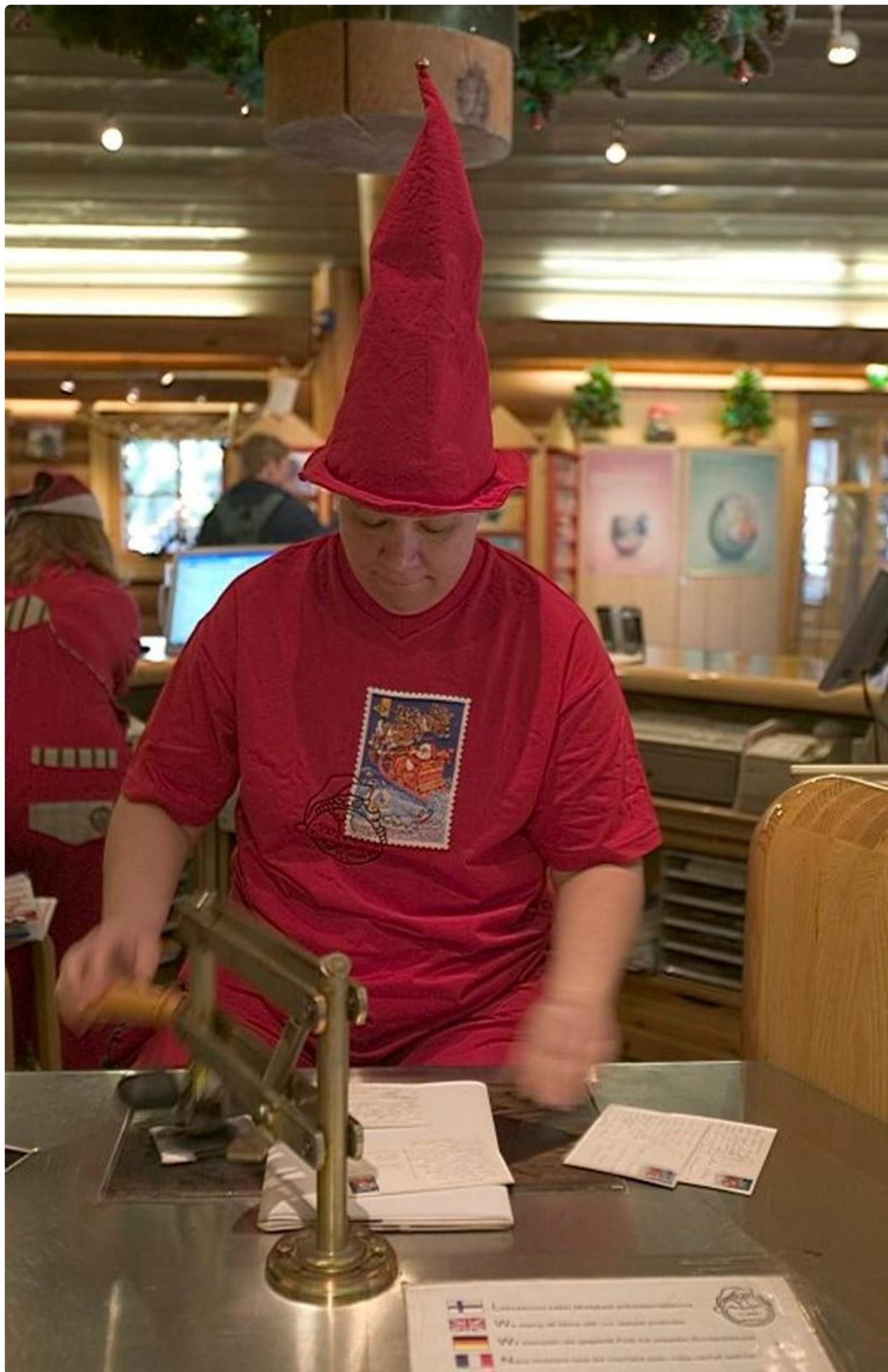
Rovaniemeltä aloite maailman tonttulakkipäivästä 1.12.