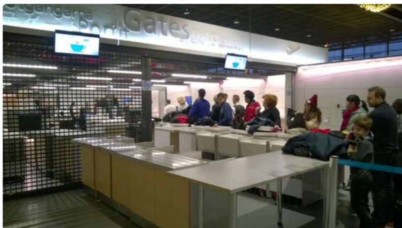
Rovaniemen lentoaseman toinen turvatarkastuslinja pysyi suljettuna ruuhkasta huolimatta.