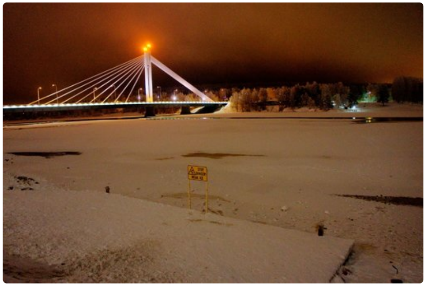
Laiturin edustalla olevalla jäällä on nähty kävelijöitä lähes päivittäin.