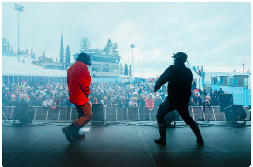
Jällivaaralaisduo Hooja toi energisen show'nsa aikana lavalle mm. mekaanisen hirvenvasan, vaahtosammuttimen ja pyrotekniikkaa.

Harmaa Rinne -after skitä on mukana rakentamassa suomalaisten rakastama aito harmaa lonkero, Hartwall Original Long Drink, joka on tapahtuman pääyhteistyökumppani