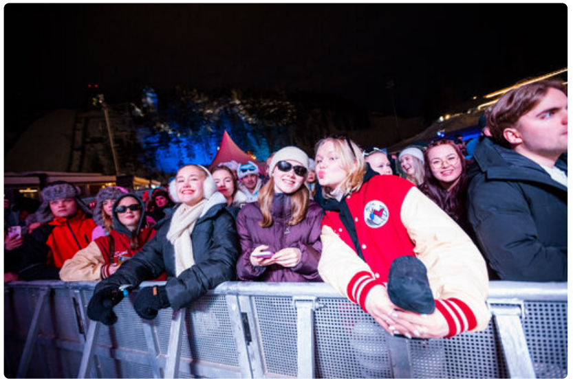
Kävijät olivat pukeutuneet sään ja after ski -etiketin mukaisesti.