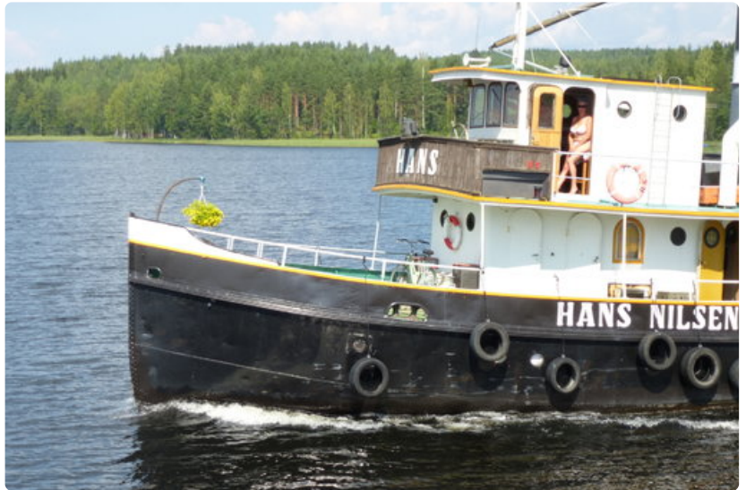
Kesäinen Saimaa on laivabongarin Eldorado. Huvijahdeiksi muutetut vanhat hinaajat tarjoavat bongareiden kameroille historiallista silmänruokaa.