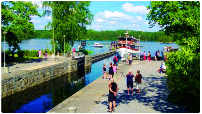
Aluksen saapuminen kanavan sulkupoorttien väliin on kylällä päivän päätapahtuma, johon saapuvat niin paikalliset asukkaat kuin kesävieraatkin.