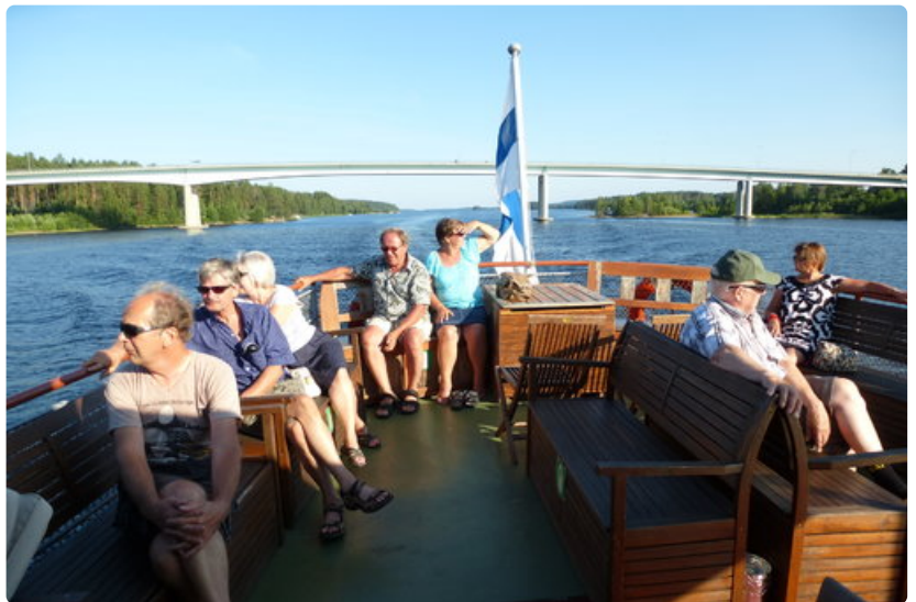
Kuopiota lähestyttäessä alitetaan Vehmersalmella yksi maamme komeimmista maantiesilloista. Aurinkokannella aletaan tähyillä kohti luodetta: Joko Puijo näkyy?