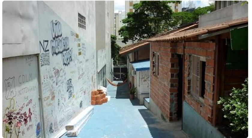
Vila Madalena hostelli.