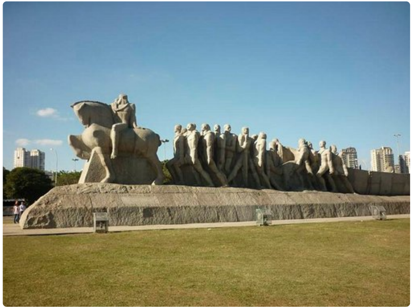
Bandeirantes monumentti Ibirapuerassa.

Paras matkustusaika: Heinäkuusta huhtikuuhun lämpötila on noin +30 astetta, mutta touko- ja kesäkuussa lämpötila saattaa laskea päivälläkin jopa +10 asteeseen.