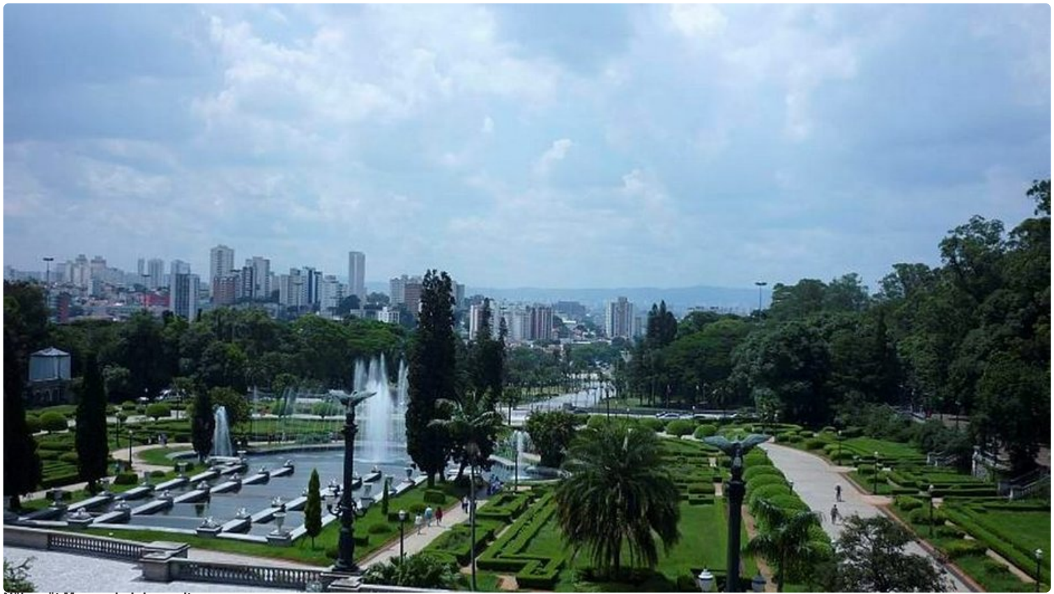
Näkymät Museu do Ipirangalta.