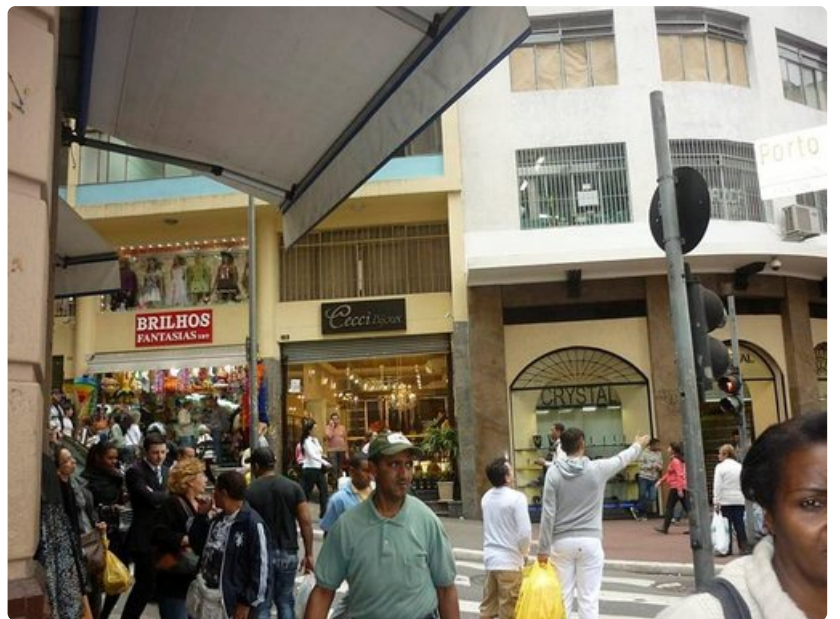
Shoppailu ei ole halpaa.