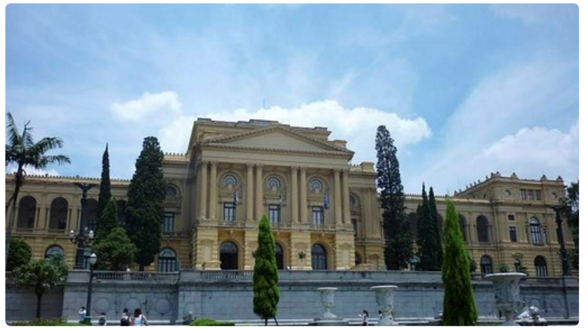
Museu do Ipiranga.