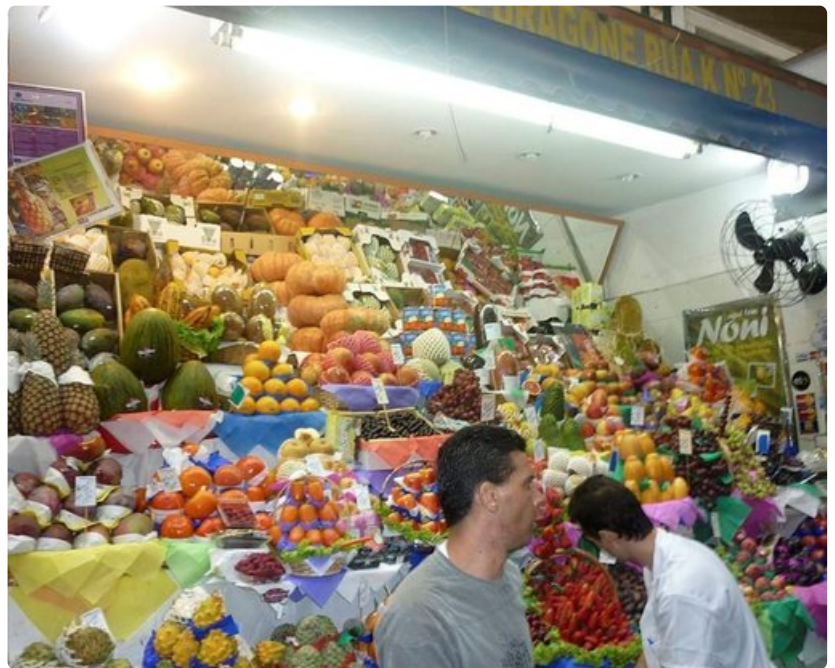
Värikylläinen hedelmäkoju kauppahallissa.