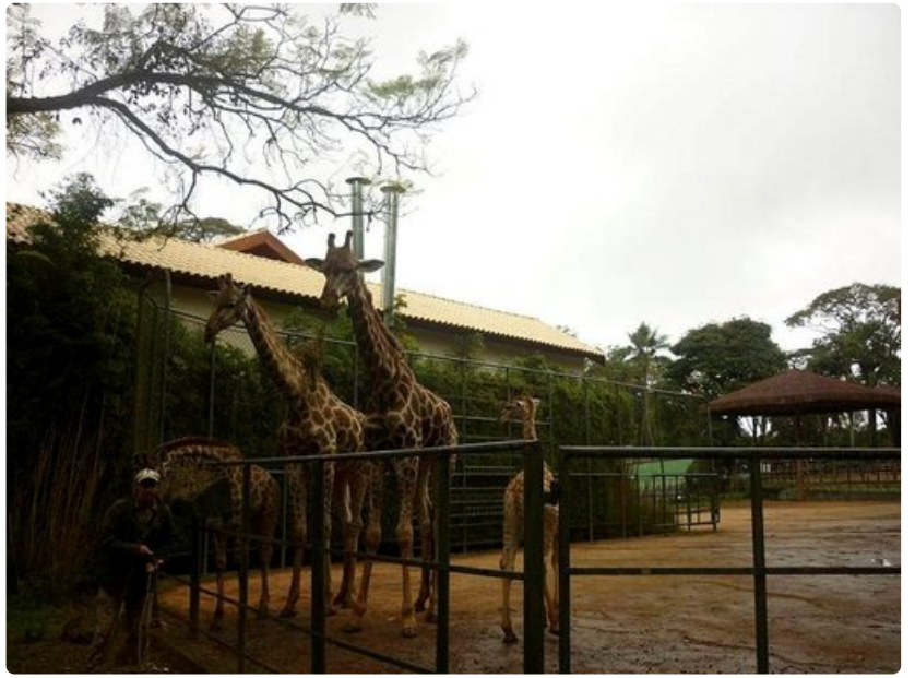
São Paulon eläintarhan kirahvit.