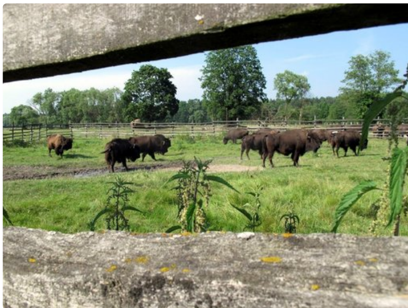
Biisonit ovat villejä, joten niitä on viisainta tarkkailla aidan takaa.

Paikkaan liittyy toinenkin legenda. Lähimetsään oli eksynyt ritari, joka oli kovin nälkäinen. Ritari kuuli kanojen kaakatusta, ja ääntä seuraten löysi tiensä kylään, josta löysi kauniin vangitun neidon. Ritari pelasti neidon, meni tämän kanssa naimisiin ja rakensi kiitokseksi kylään kirkon. Paholainen suuttui kirkosta ja alkoi kivittää sitä. Yksi kivistä on edelleen tallella Kurozwekin kartanon kellarissa.