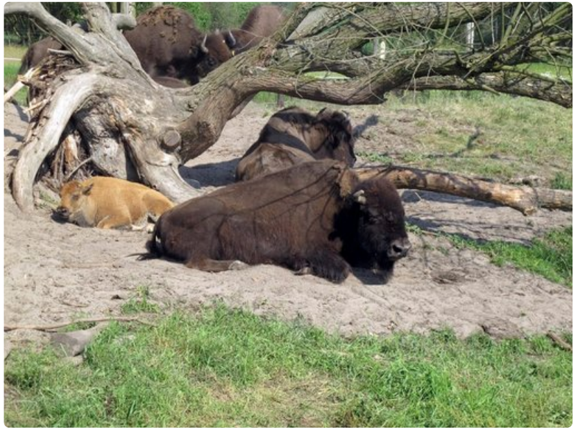
Helteisenä päivänä biisonit hakeutuvat mielellään pieneenkin varjoon.