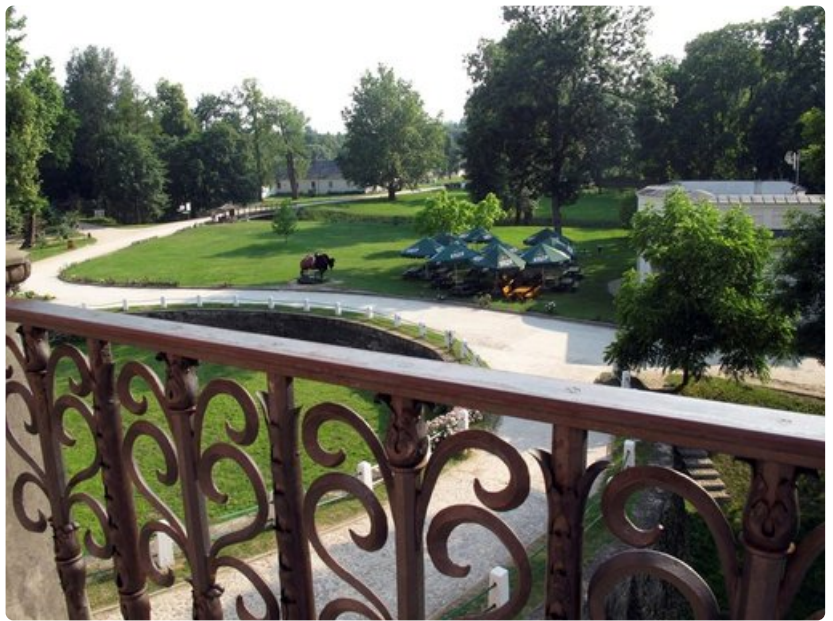
Palatsin terassilta aukeaa näkymä kauniiseen pihapiiriin.