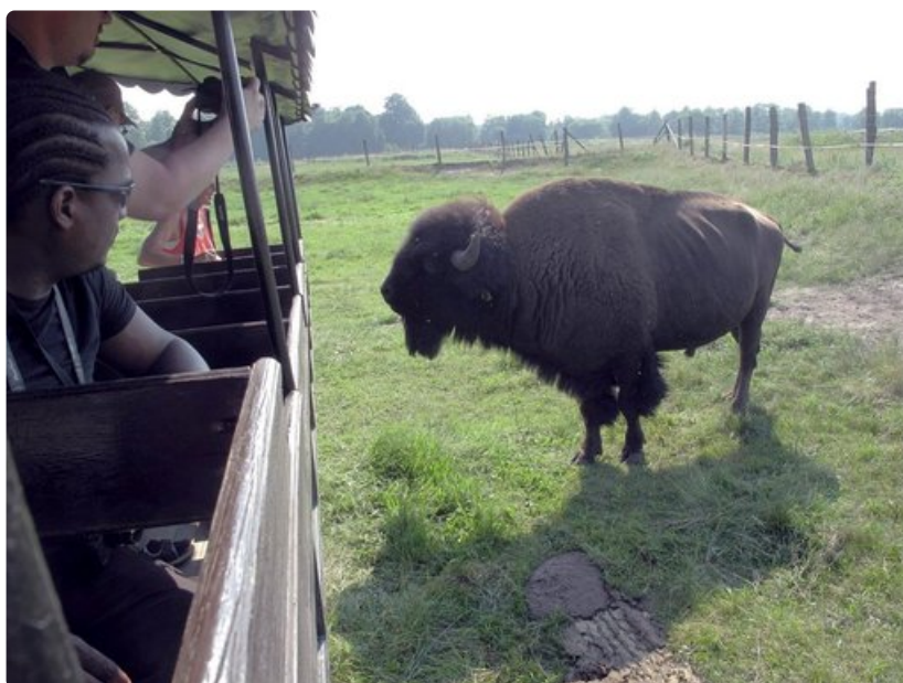
Traktorin peräkärystä villiä biisonia voi tuijottaa silmästä silmään.