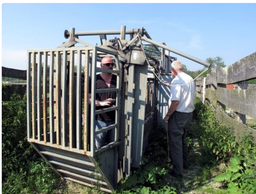
Turisti saa kokea, millaiseen loukkuun biisoni ajetaan ennen teurastusta.