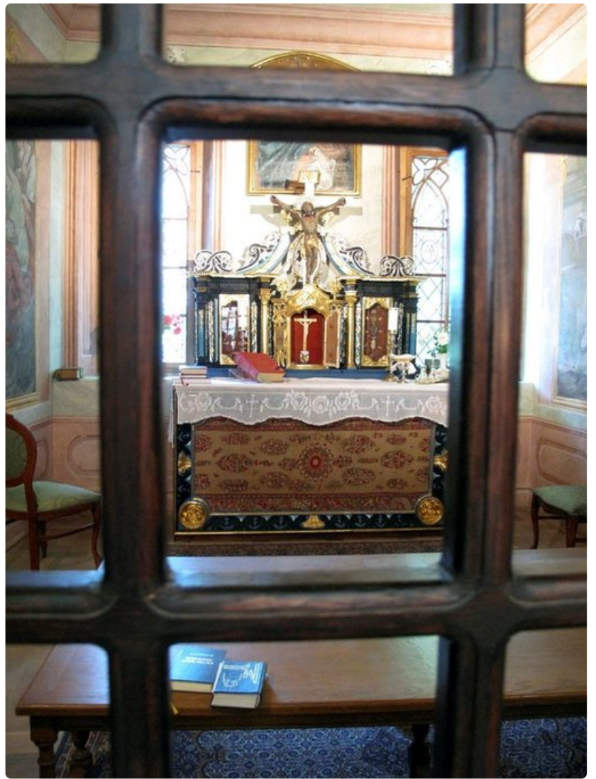
Pienessä kappelissa vihitään usein hääpareja.