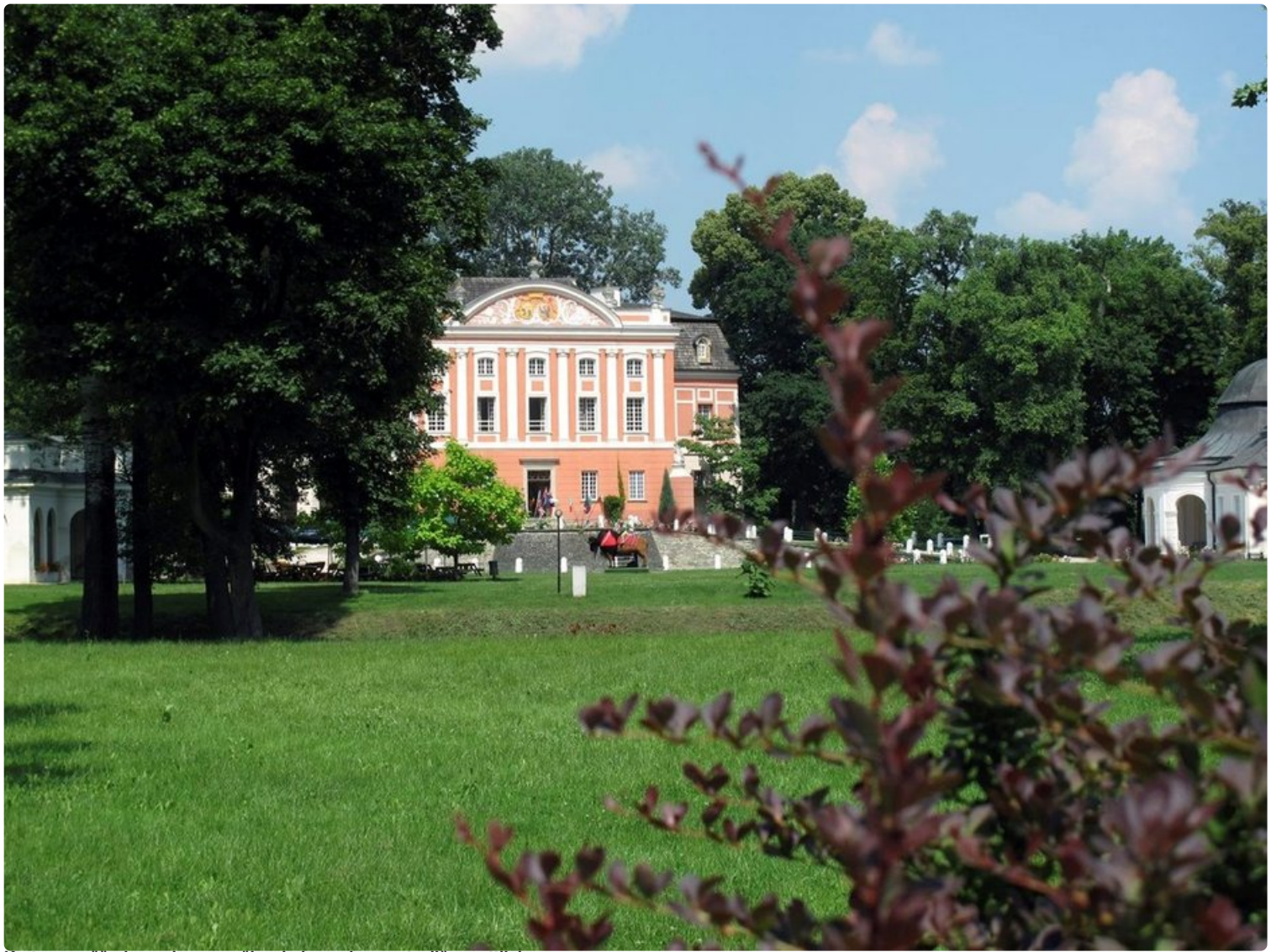
Kartanon päärakennuksessa näkyy kolme rakennustyyliä: goottilainen, renessanssi ja klassinen barokki.