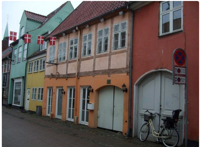
Helsingør kunnioittaa vanhaa rakennuskantaansa.