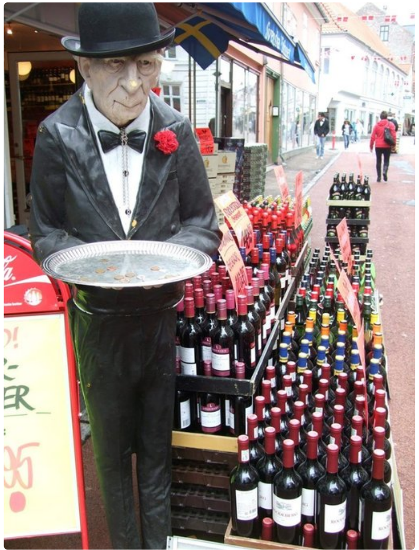
Kun kaikki myyntiviinokset eivät mahdu kauppaan ja jalkakäytävälle, otetaan kävelykatu avuksi.