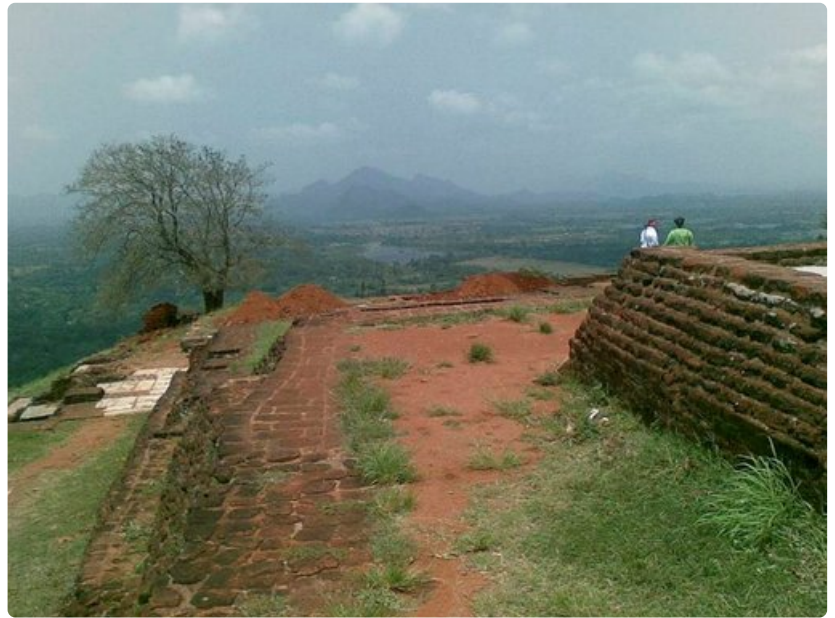
Sigiryan laelle kipuavan matkailijan palkitsevat huimat näkymät.

Kandalama-hotelli sulautuu ympäröivään trooppiseen viidakkoon hyvin. Arkkitehtoniset ratkaisut on tehty ympäröivän luonnon ehdoilla. Lisäksi hotelli noudattaa kierrätyksen ja ekomatkaailun periaatteita. Hotellin aula on kuin vuoren onkaloon louhittu luola, jonka avonaisesta seinästä avautuu henkeäsalpaava näkymä Kandalama-järvelle. Sivuseinät ovat louhittua kiveä ja lattia on kiillotettua intialaista kadappa-kiveä. Karkea kallioseinä ja kiiltävä kivilattia muodostavat vastakohtien yhdistelmän keskellä trooppista vehreyttä. Suunnittelija on hyödyntänyt periaatetta maiseman sulautumisesta avonaiseen tilaan myös muissa hotelleissa, kuten Gallen Lighthouseissa ja Wadduwan Blue Waterissa. Subtrooppisen kuumun ja kostean ilmaston ansiosta rakennuksissa voidaan käyttää avoseiniä, mikä mahdollistaa luonnon ja sisätilojen harmonisen sulautumisen toisiinsa konkreettisesti.