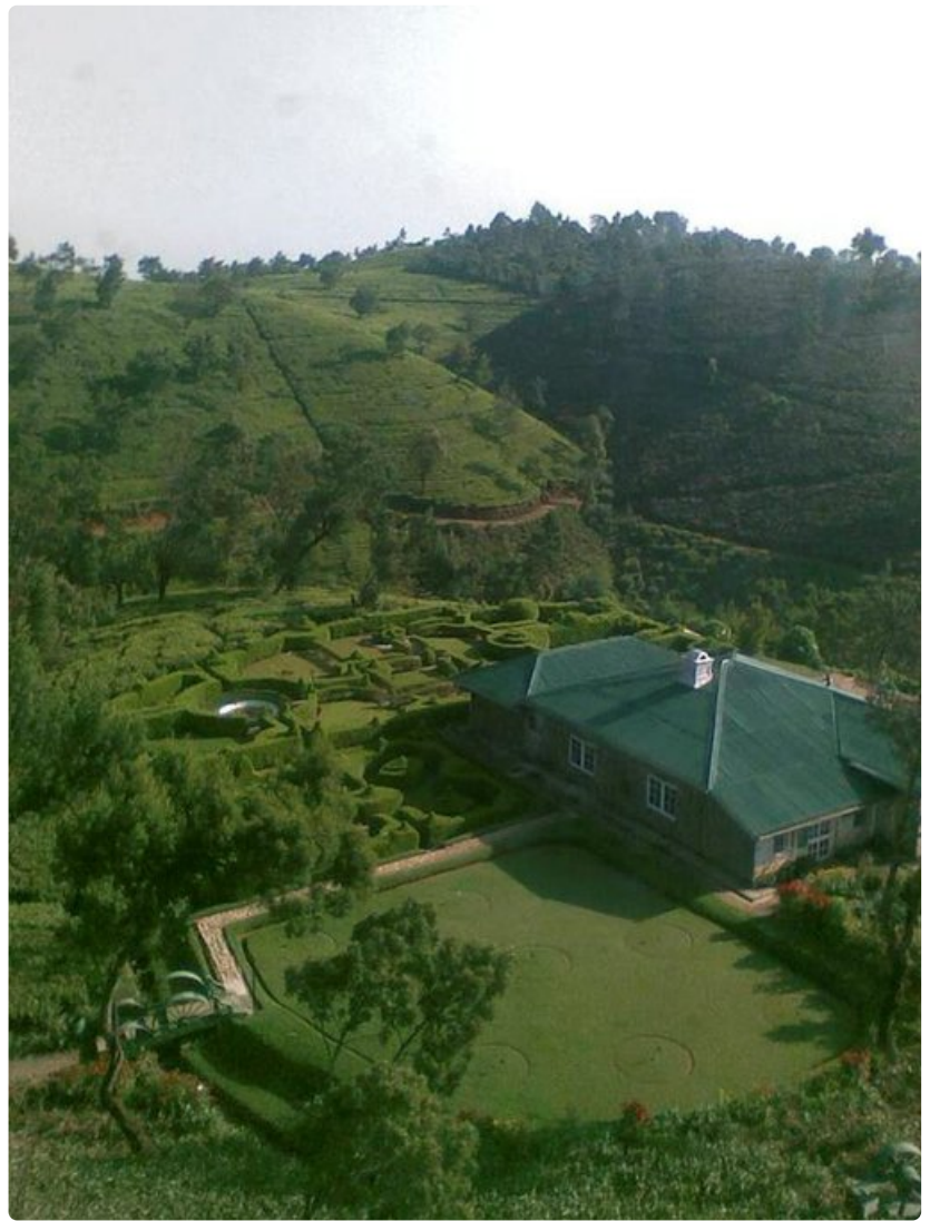
Teenviljelyaluetta ei turhaan kutsuta pikku Englanniksi.

Maan pohjoisosa on edelleen sodan päättymisen jälkeenkin aluetta, jonne pääsyä rajoitetaan eikä sinne ole syytä omin päin lähteäkään huonokuntoisten teiden ja mahdollisten maamiinojen vuoksi.