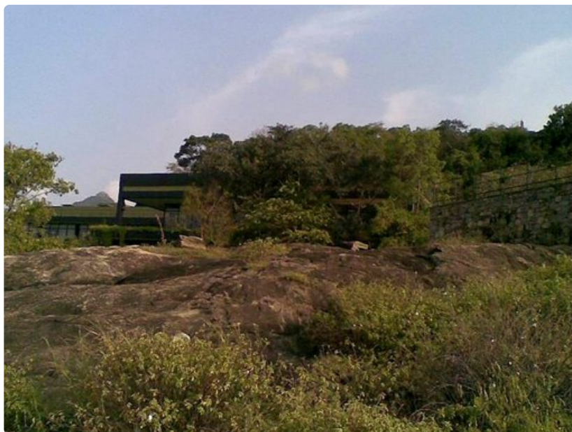
Kandalama-hotelli sulautuu täydellisesti ympäröivään kalliomaisemaan.