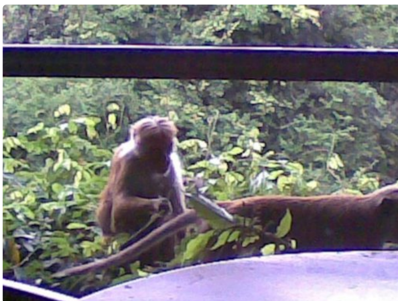
Hotellihuoneen parvekkeella seikkailevat apinat eivät anna matkailijoiden häiritä itseään.