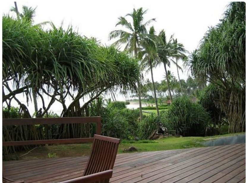
Aurinkoa on mahdollista ottaa uima-altaalla tai rannalla.