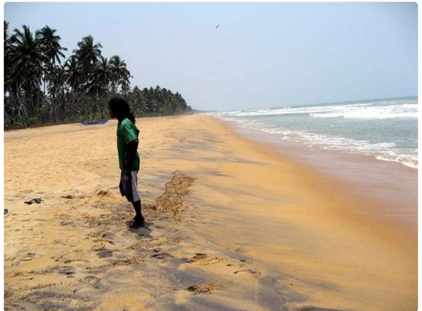
Sri Lankan länsirannikko on täynnä toinen toistaan upeampia hiekkarantoja. Turistihotellien liepeillä saattaa usein olla innokkaita kaupustelijoita.