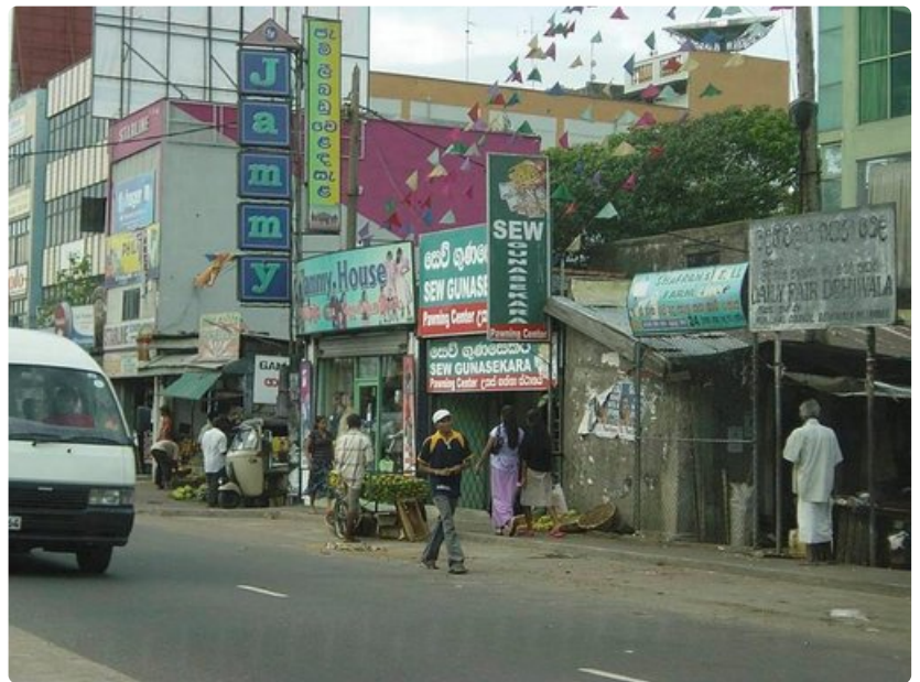
Colombon liikennekulttuuri on villiä ja torvet soivat lähes tauotta.