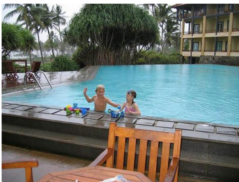
Lighthouse-hotellin monissa uima-altaissa on hyvin tilaa ja ne sopivat myös lapsille.