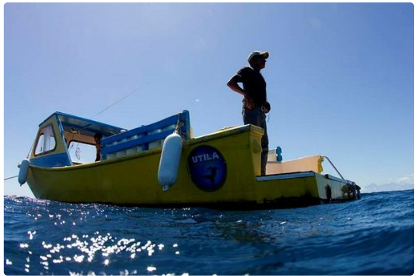
Kapteeni odottelee kyytiläistensä paluuta.