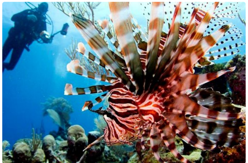
Karibian lämpimissä vesissä oleilevat lukemattomat trooppiset kalalajit.