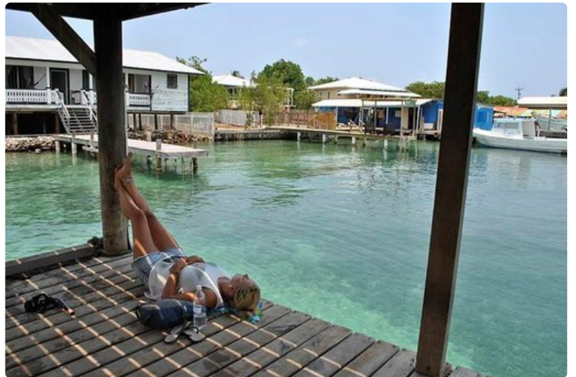
Utilan saarella Karibian rento elämäntyyli tarttuu matkailijoihin.