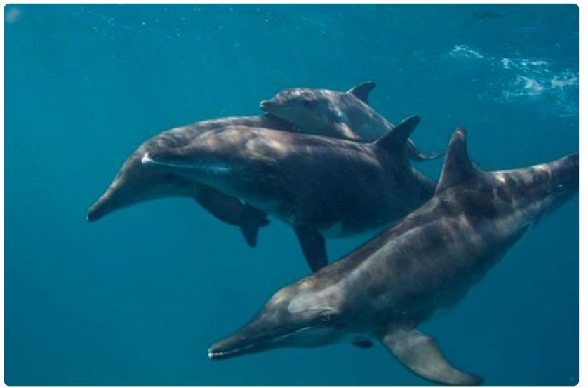
Hyvänä päivänä voi päästä uimaan iloisten delfiinien kanssa. Delfiinit ovat usein uteliaita, eivätkä pelkää ihmisten läheisyyttä.