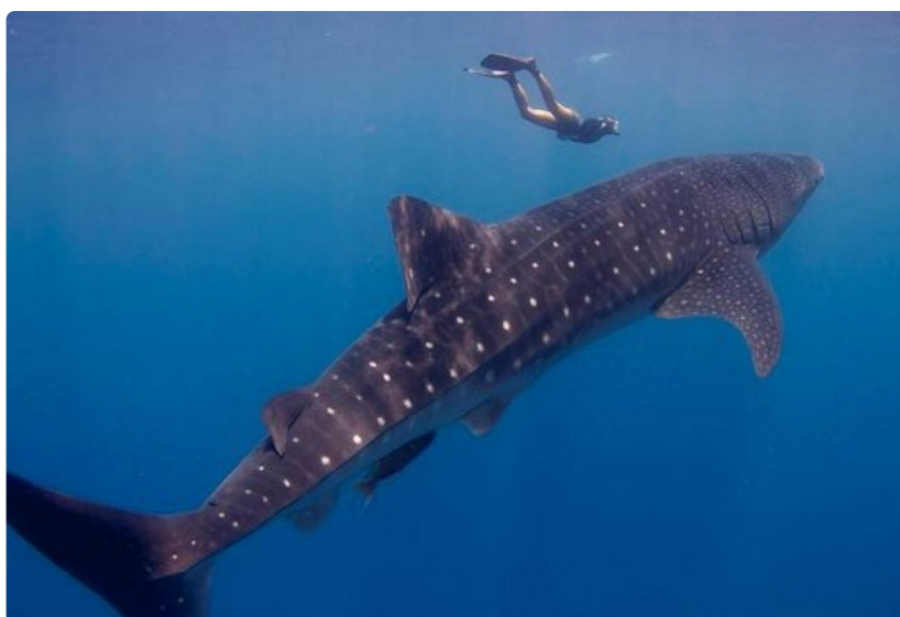
Keväisin valashait vaeltavat Bay-saarten läpi Meksikon rannikolle. Muutaman viikon ajan niitä voi nähdä myös Utilan läheisyydessä.