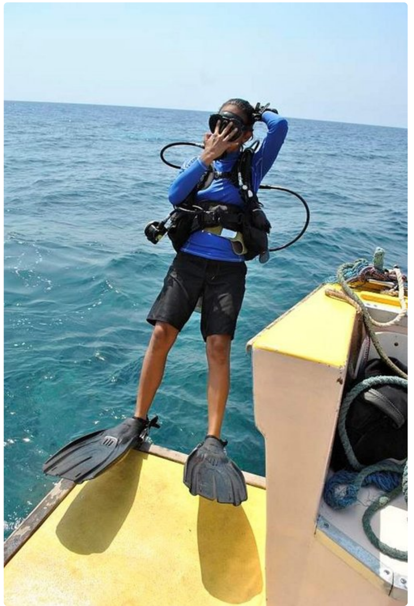
James Bond -tyylinen poistuminen veneestä on niin kurssilaisten kuin opettajienkin mieleen.