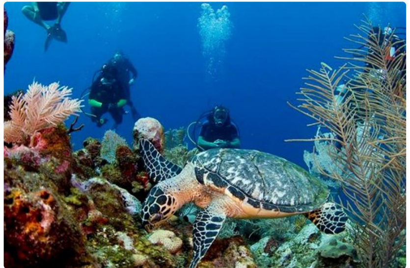
Kuvaaminen pinnan alla on suosittu harrastus, ja kilpikonnat ovat loistavia malleja.