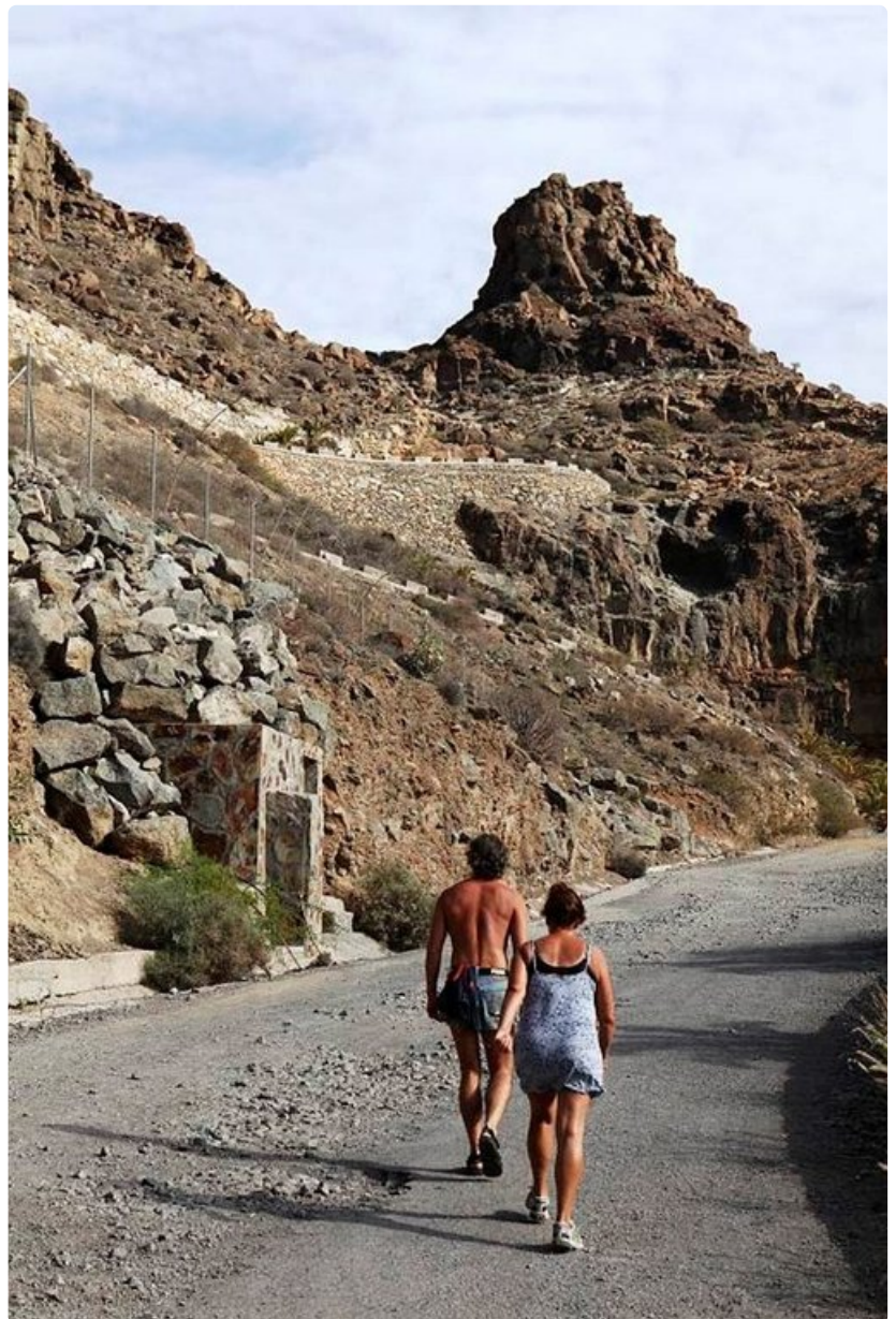
Ruotsalaiset ovat vielä suomalaisiakin suvaitsevaisempia kumppaninsa lomailusta yksin tai kavereiden kanssa.

Kielteisesti kumppaninsa matkailuun ilman heitä suhtautuu: