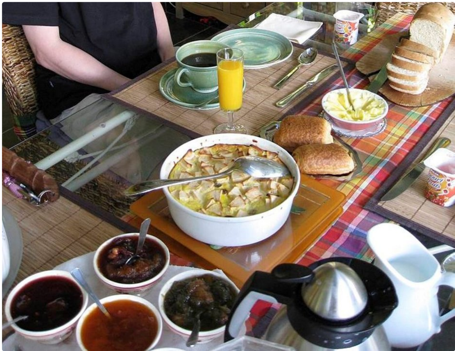
Perhemajoitusten aamiaispöydät notkuvat oman keittiön herkkuja croissanteista hilloihin.

Suomalaisille aamiaispöydässä tärkeintä on - yllätys, yllätys - kahvi