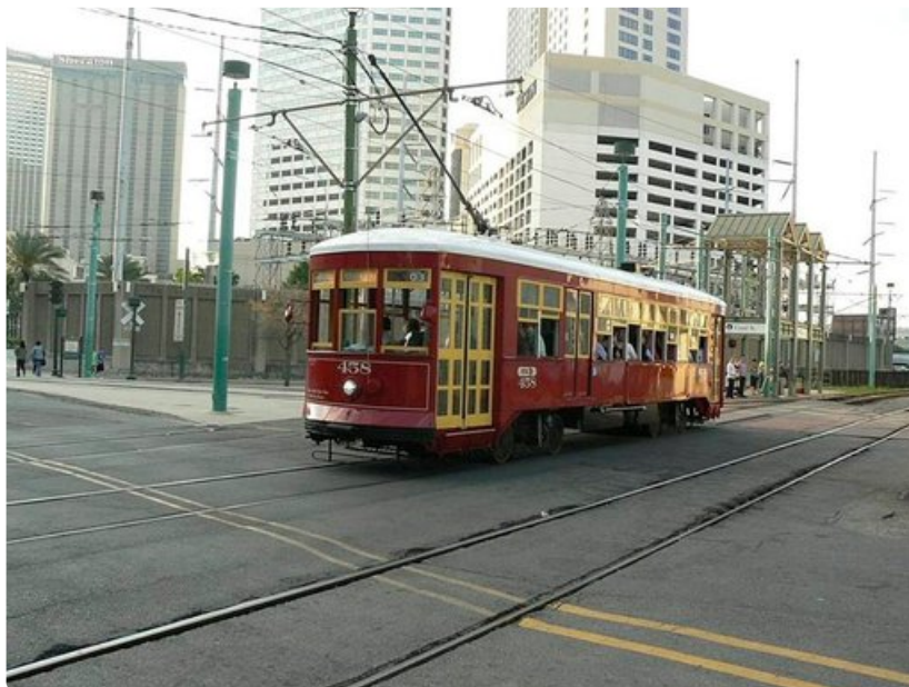
Jos jalat väsyvät, voi pienen matkan Misisippijoen rannan tuntumassa matkustaa raitiovaunulla.

Vedestä nousevat puut luovat aavemaisen tunnelman ja matkailijan mielessä voi käydä kiitollisuus siitä, että pääsee turvallisesti pois ennen pimeän tuloa. Paikalliset oppaat tuntevat paikat kuten omat taskunsa ja tietävät jopa miten alligaattorit voi houkuttaa veneen lähelle matkailijoiden kuvattaviksi. Salaisuus piilee vaahtokarkeissa.