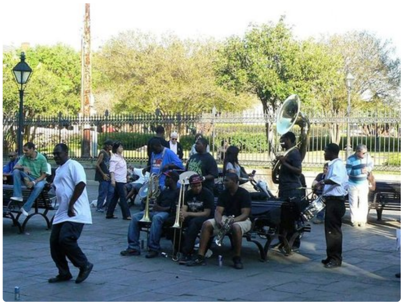
Musiikilla on tärkeä sija kaupungin katuelämässä, eikä ihme, sillä New Orleansin oma poika Louis Armstrong on edelleen monen afroamerikkalaisen muusikon esikuva.