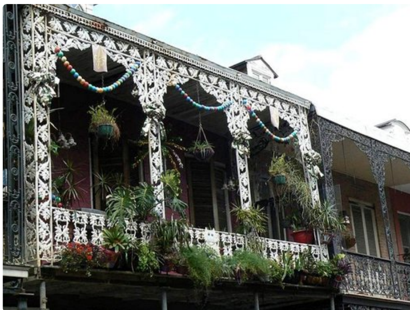
Ranskalaiset vaikutteet ovat selvästi havaittavissa New Orleansin arkkitehtuurissa.