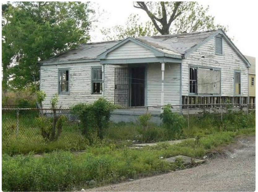
Destrehanin orjat asuivat näissä vaatimattomissa mökeissä.

Ranskalaisten talojen parvekkeilla seisovat ihmiset heittelevät värikkäitä muovihelminauhoja alas kadulle väkijoukkoon vaatiensa sitä henkilöä, joka poimii helminauhan itselleen paljastamaan povensa. Helminauhamyynti on varsinaista bisnestä, ja ovathan ne mukavia tuliaisia. Kaupasta ostettuna tai kadulta noukittuna - valinta on matkailijan. Helminauhojen lisäksi Bourbon Streetillä myydään muitakin juhlimiseen kuuluvia muovirihkamataroita, voodooesineitä, matkamuiistoja ja t-paitoja.