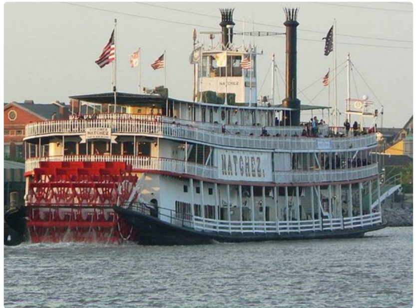
Siipiraslaiva Natchez vie matkustajat Mississippijoen alajuoksuun Meksikonlahden suulle.