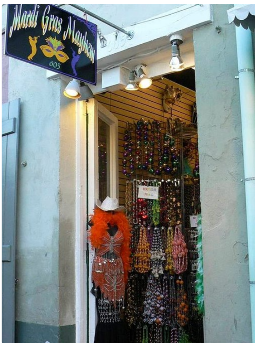
Värikkäät koristeet käyvät kaupaksi.