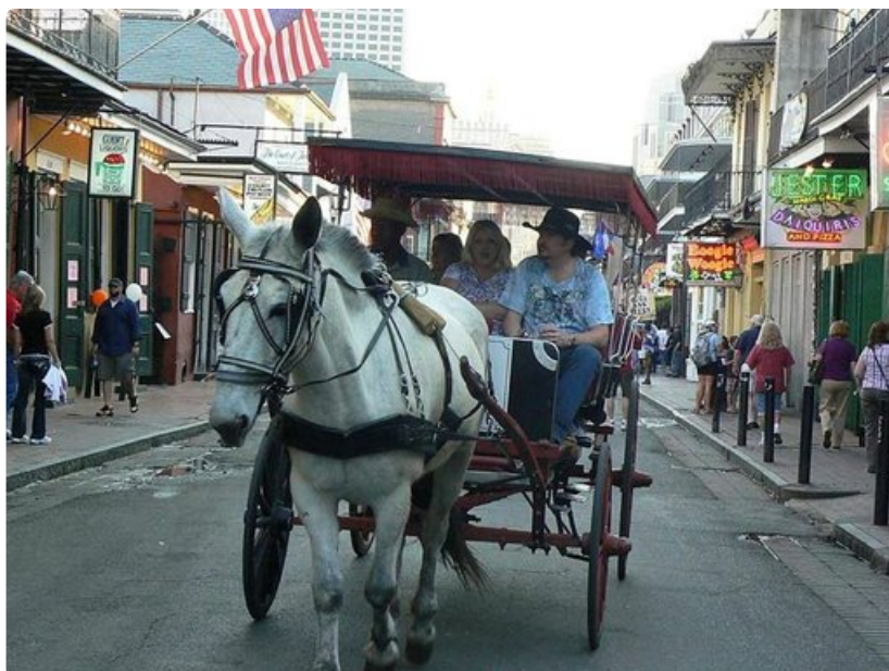
Mukava tapa tutustua kaupungin keskustaan on kiertoajaminen hevosvaunuilla.