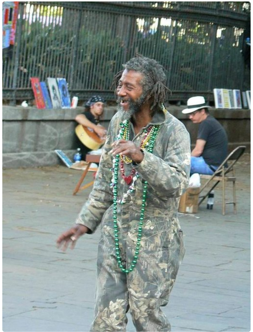
Elävää katutaidetta neworleansialaisittain.

Tarinan mukaan kaupungissa eläneen voodoo-kuningattaren Marie Laveaun henki elää vieläkin New Orleansissa. Voodoo on asukkaiden uskonto ja elämäntapa ja se näkyy kaikessa. Tarjolla on voodoo-mausteita, -ruokaa, -nukkeja ja jopa voodoo-museo. Matkailijoille järjestetyillä yöllisillä hautausmaakierroksilla voi nähdä zombien heräävän eloon, tavata voodooopappeja ja kurkistaa tulevaisuuteensa voodoo-ennustajan luona.