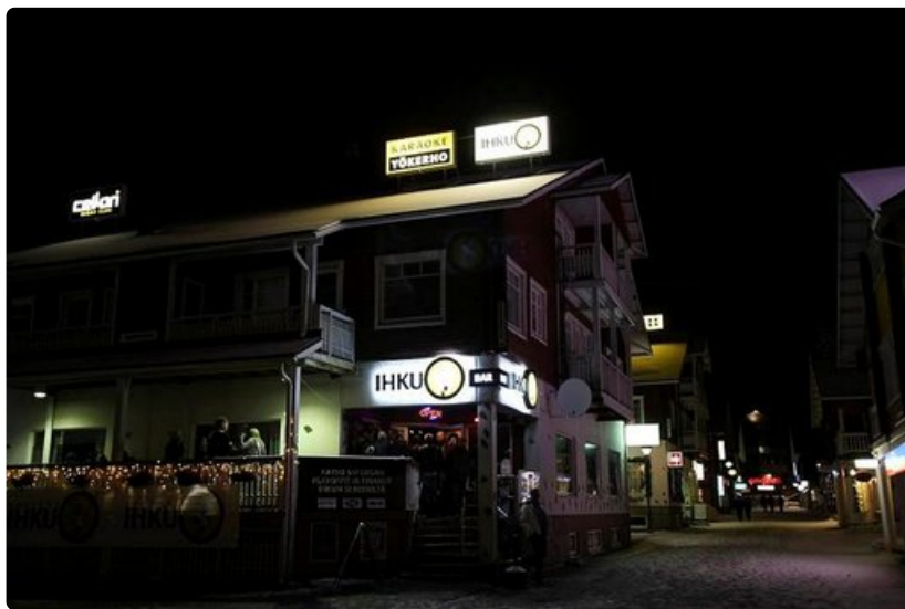
Kylänraitti on sunnuntai-iltana autio mutta ravintolat täynnä.