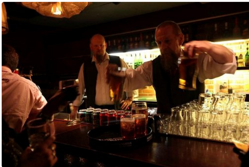
Hotelli Levitunturin Joiku-baarissa meno jatkuu aamuun asti.