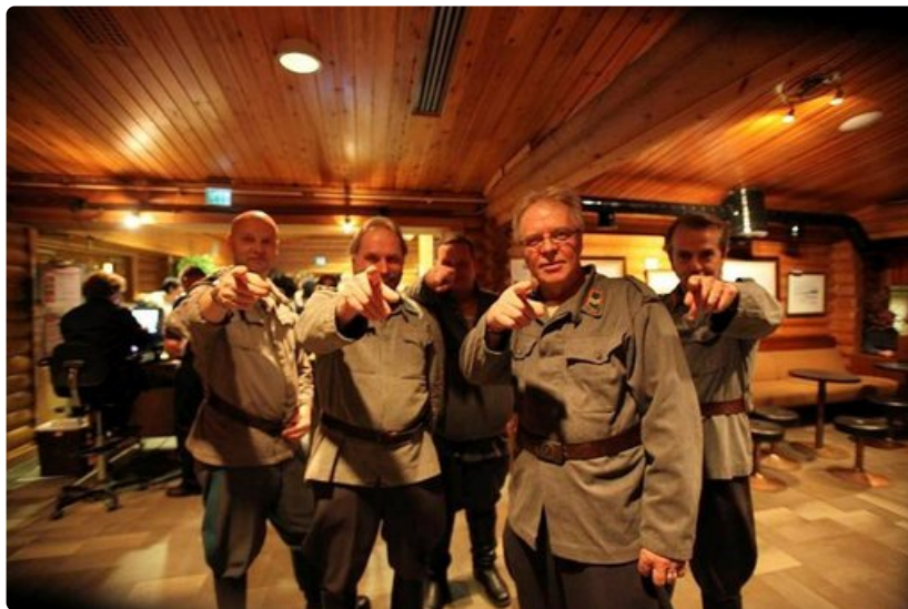
Korsuorkesteri veti Levitunturin salin sunnuntai-iltana täyteen.