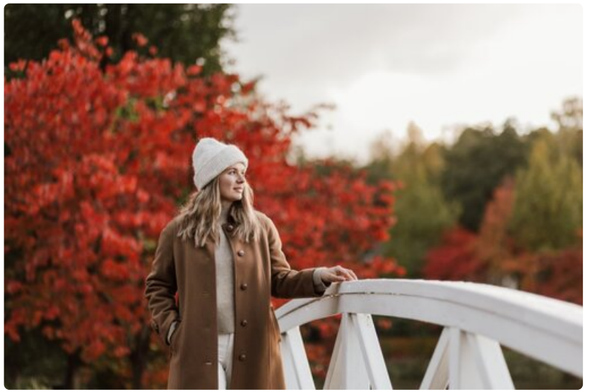
Sapokan vesipuisto ruskan väreissä.