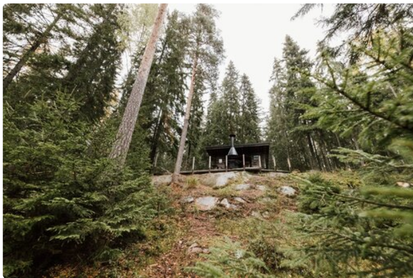
Kukuljärven idylliä rantamaisemaa.