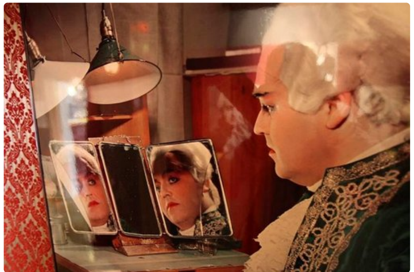
Maailmankuulu ja suomalaiset sukujuuret omaava tenori Jussi Björling herää eloon kotimuseossa Borlångessa.