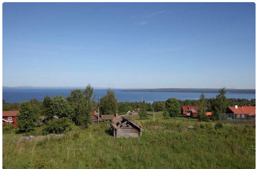
Siljan-järven rannalla kuvankaunis Tällbergin kylä lumooa kesäillan auringon laskiessa suuren järven taakse tuntureiden syliin tai rannattoman järven horisonttiin.