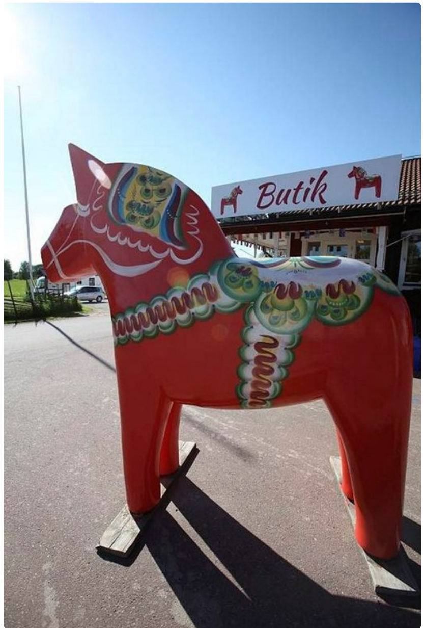
Taalainmaan punainen hevonen on koko Ruotsin symboli.

Vanha kalkkikaivos elää uutta aikaansa Dalhallassa. Kalkkikivikaivokseen rakennetussa amfiteatterissa akustiikka hakee vertaistaan. Viime kesänä luonnonnäyttämö ja -katsomo täyttyi ilta toisensa jälkeen maailmantähtien äänistä huikean akustiikan avulla.