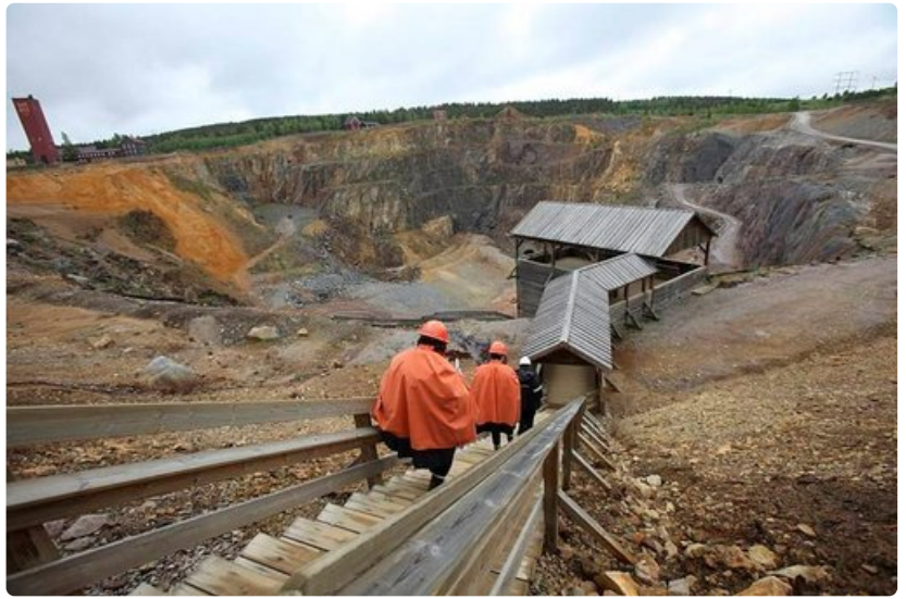
Taalainmaan-matkan ehdoton kohde on Falunin kuparikaivos, jonka syvyyksiin, aina 600 metriin, pääsee ihmettelemään kaivosmiesten ankaria olosuhteita.

Historiaa: Björling kuoli alkoholismiin vuonna 1960, alle 50-vuotiaana. Koko hänen sukunsa oli lyhytikäistä.