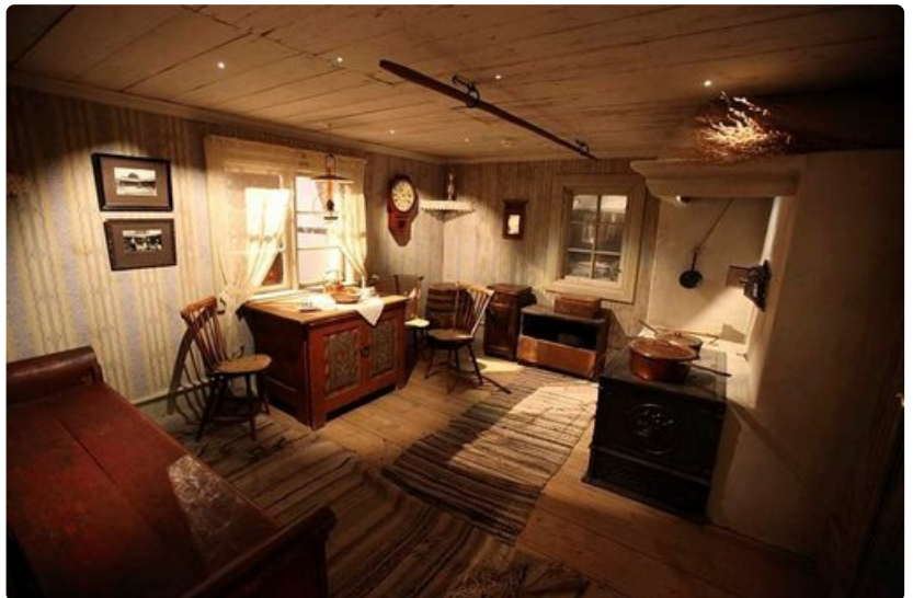
Näin taalainmaalainen perhe asui.