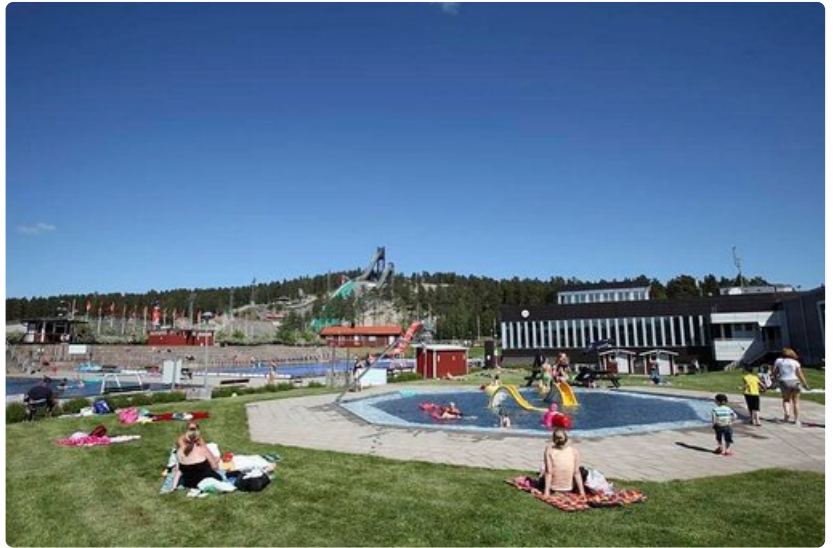
Falunin hiihtokeskus näyttää kesällä aivan toiselta kuin talvella. Helmikuussa näissä maisemissa on hiihdon MM-kisat.