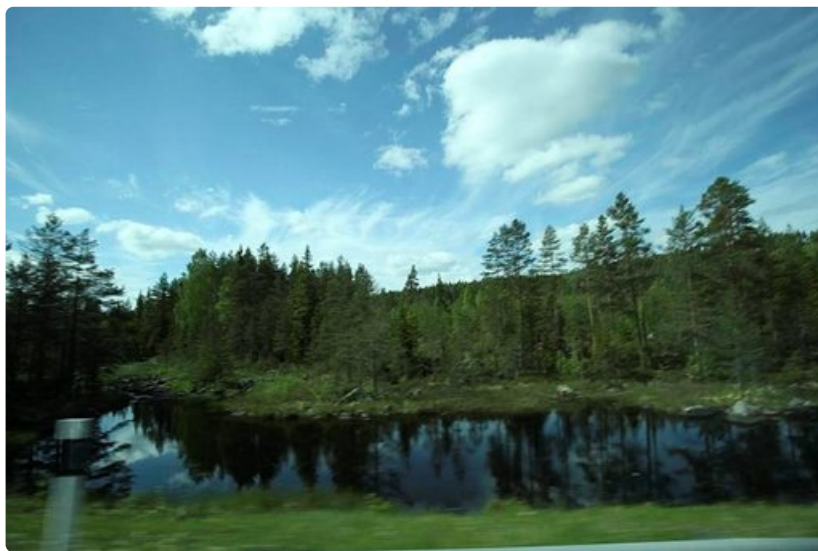
Näihin maisemiin tulivat tuhannet suomalaiset asumaan.

-Tämä on kyllä hyvä asia, että kaikki tästä historiasta ei katoa, Eino sanoo katsellessaan juuri kunnostettua tupaa.