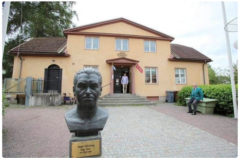
Jussi Björling -museo.