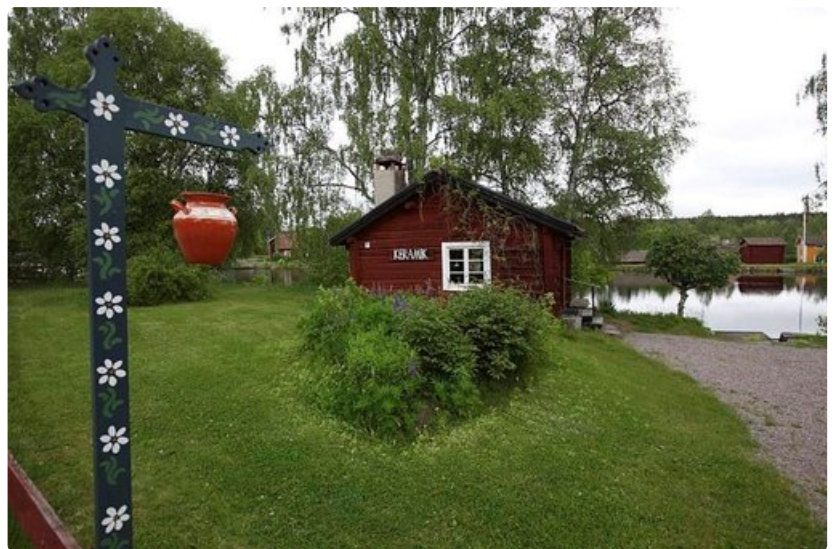
Sundbornissa on Carl Larssonin kotimuseo, jossa kamera ei pääse ulko-ovea pitemmälle.