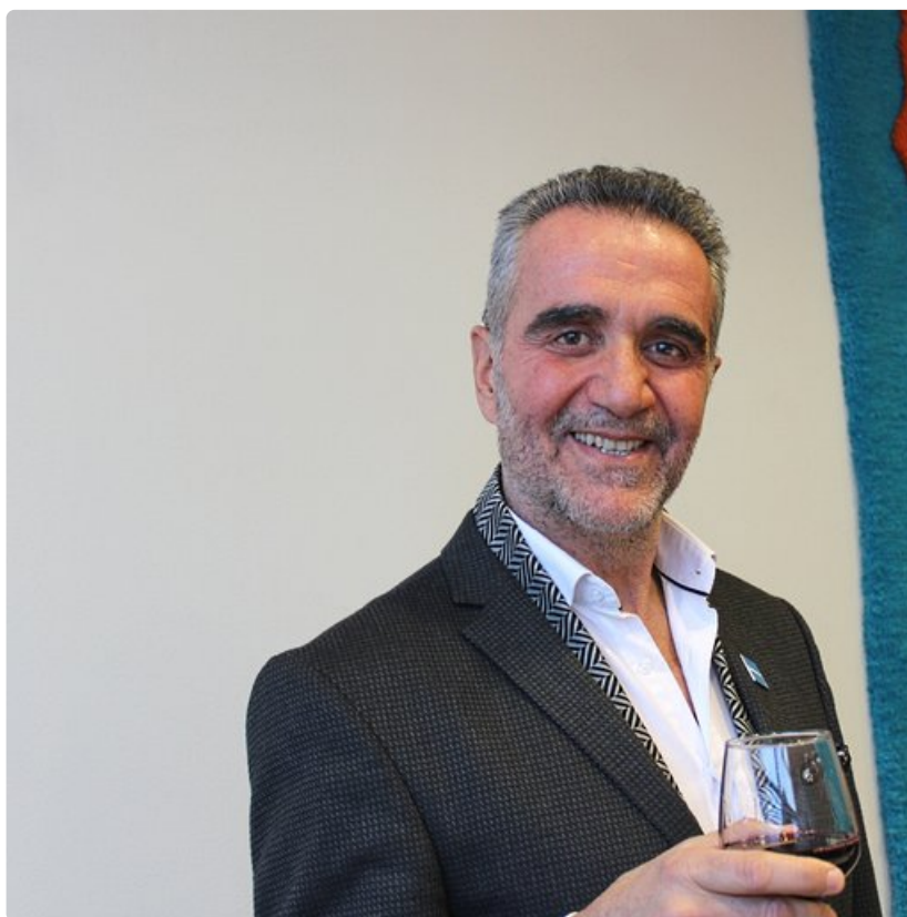
Kreikan korkein matkailuviranomainen, valtion matkailutoimiston toimitusjohtaja Babis Karimalis oli tyytyväinen nähtyään miten suomalaiset täyttivät Messukeskuksen ja kansoittivat Kreikan osaston.