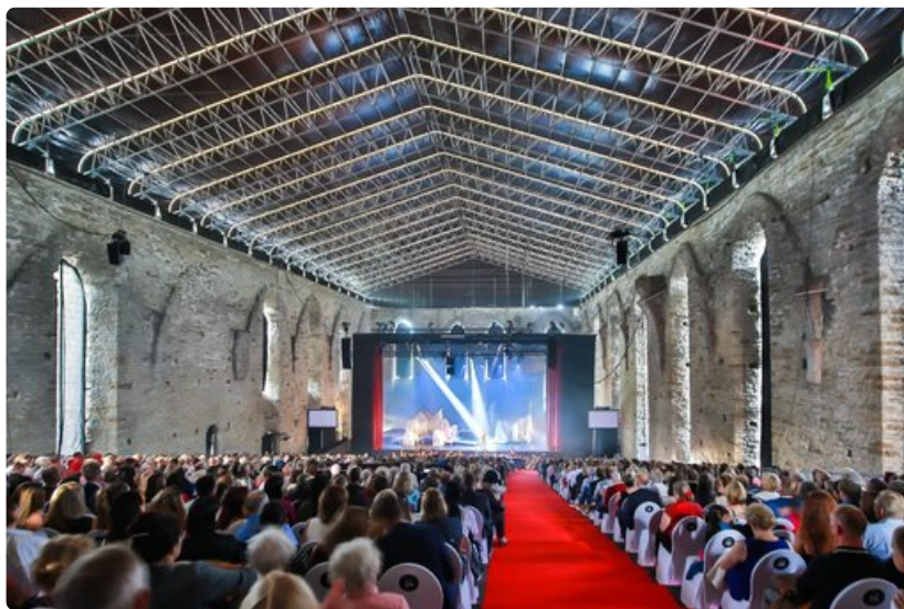
Luostarin katsomo.

Teksti: Esa Paavolainen