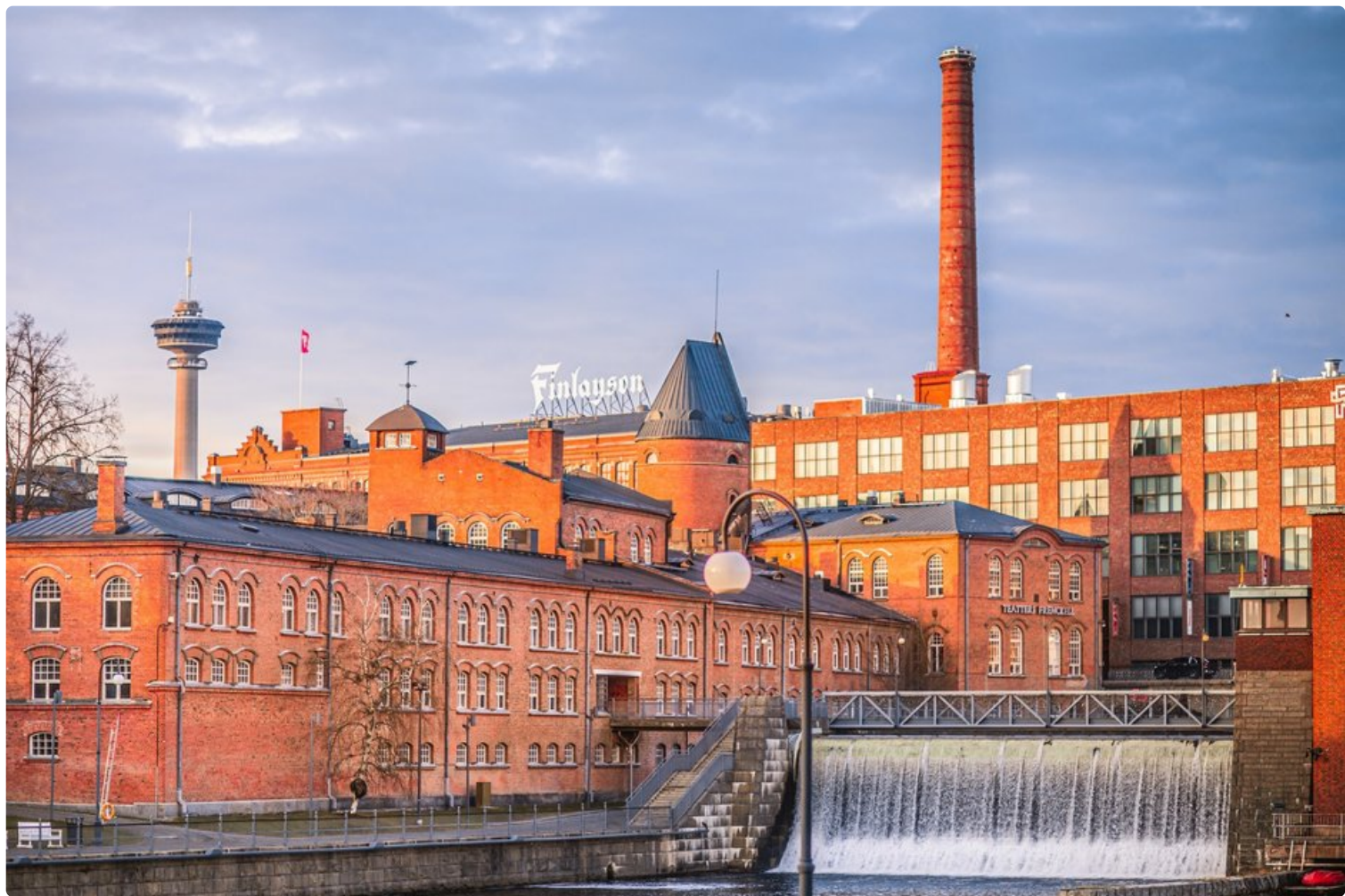
Tampereella oli erinomainen matkailukesä.