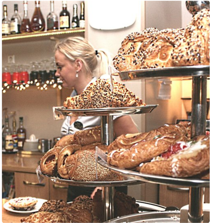
Kahvila Werner tarjoaa kaupungin parhaat leivokset ja pullat.