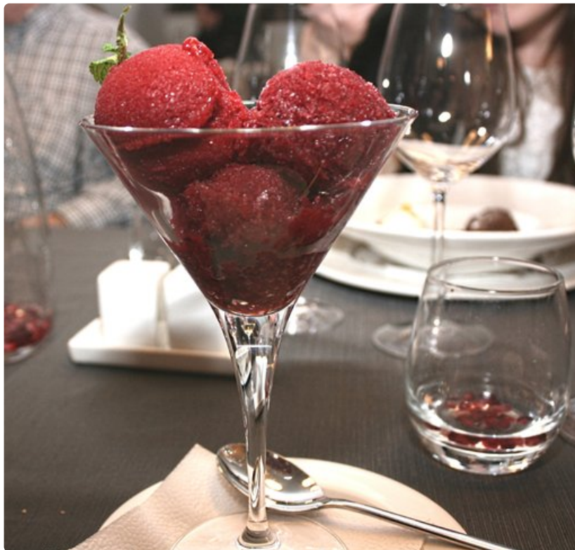
Ravintola Polpo vadelmasorbetti

Ravintola Polpo (Rüütli 9) sijaitsee vain korttelin päässä raatihuoneelta. Polpo eli mustekala toimii Hotel Londonin yhteydessä. Paikka on kauniisti sisustettu, ja sen ruokalista on monipuolinen. Välimeren kulinaarinen perintö on hyvin esillä, mutta myös paikallinen keittiöperinne on mukavasti edustettuna. Ruokalistalta voimme suositella savustettua lohta, paikallisia porsaankyljyksiä tai Chateaubriand-pihviä. Jälkiruokana maistuu aina vadelmasorbetti.