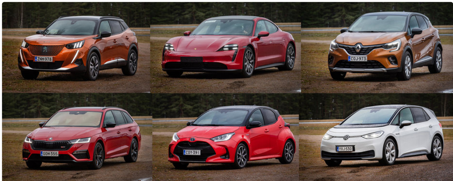
Vuoden Auto ehdokkaat vasemmalta alkaen aakkosjärjestyksessä: Peugeot 2008, Porsche Taycan, Renault Captur, Škoda Octavia, Toyota Yaris ja Volkswagen ID.3.