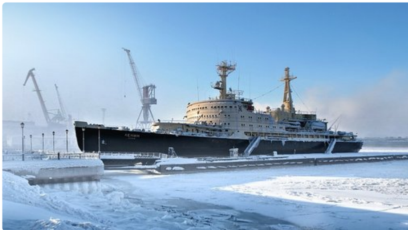
Jäänmurtaja Lenin Murmanskissa on maailman ensimmäinen ydinvoimalla toiminut jäänmurtaja.