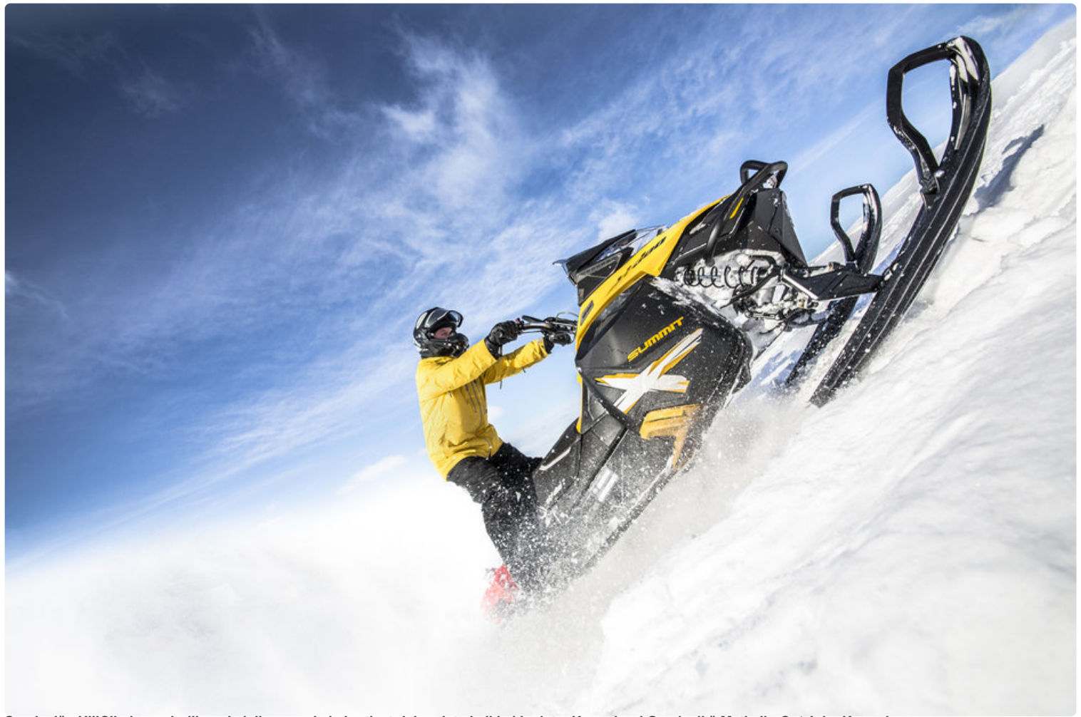
Saariselän HillClimb on virallinen ja lajissaan yksi ainutlaatuisimmista kelkkakisoista.